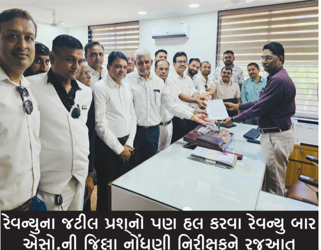
રેવન્યુના જટીલ પ્રશ્નો પણ હલ કરવા રેવન્યુ બાર એસો.ની જિલ્લા નોંધણી નિરીક્ષકને રજૂઆત

રાજકોટ મિરર, તા.૨૯ ભાગીદારી પેઢીમાં સ્ટેમ્પ ડ્યુટીની વિસંગતતા તેમજ રેવન્યુના લાંબા સમયથી અણઉકેલ પ્રશ્નો તાકીદે નિવારવા માંગ થઈ છે. આ અંગે રાજકોટ તાજેતરમાં રાજકોટ રેવન્યુ બાર એસોસિએશન લેખીત રજૂઆત કરી જણાવ્યું હતું કે, જ્યારે ભાગીદારી પેઢીમાંથી કોઈ ભાગીદાર છુટા થાય કે દાખલ થાય ત્યારે દરેક સબરજીસ્ટ્રાર દ્વારા મનવડત પોતાના મુજબજદા જુદા અર્થઘટનો કરી સ્ટેમ્પ ડ્યુટી વસુલ લેવામાં આવે છે.