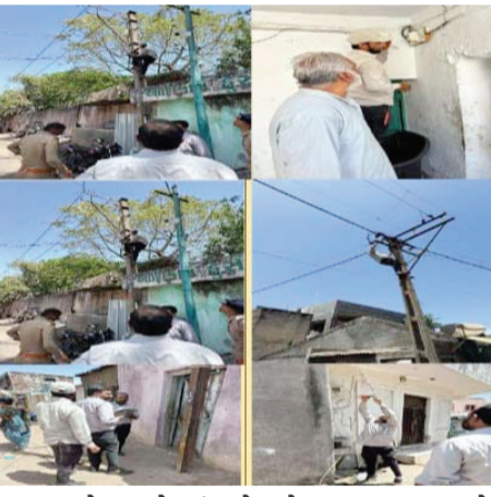
રાજકોટ: શહેરમાં ગુનેગારો, અસામાજિક તત્વો સામે પોલીસે શરૂ કરેલી અંતર્ગત પ્રધુમનનગર પોલીસે વધુ દસ શપ્સોને નિશાન બનાવી તેના ઘરના ગેરકાયદેસર વિજકનેક્શન કાપવા નાખ્યા હતાં. સુરક્ષા