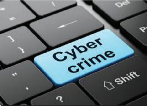
ગોવાના ડિલરે માલિકનો ફોન આવ્યાનું સમજી રોકડ ટ્રાન્સફર પણ કરી દીધી: કર્મચારીઓને ઇ-મેઈલથી છેતરવાનો પ્રયાસ: શહેર સાયબર ક્રાઈમ પોલીસે તપાસ આરંભી

રાજકોટ: સાયબર ગઠીયાઓએ એક કંપનીના માલિકના નામે બોગસ વોટ્સએપ એકાઉન્ટ બનાવી તેમનો ફોટો મુકી ડિલરોને મેસેજ મોકલી પૈસા ઉઘરાવવાનું ચાલુ કરતાં અને એક ડિલર પાસેથી રૂપિયા લઈ પણ લેતાં તેમજ કર્મચારીઓને માલિકના નામે ઇ-મેઈલ કરી ફોડનો પ્રયાસ કરતાં સાયબર ક્રાઈમ પોલીસે તપાસ આરંભી છે.