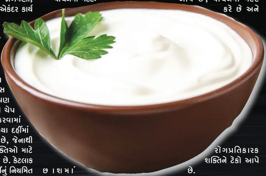
રોગપ્રતિકારક શક્તિને ટેકો આપે છે.

દહીંમાં રહેલા પ્રોબાયોટિક્સ રોગપ્રતિકારક શક્તિને પાટો આપે છે, જે શરીરને રોપ સામે પોતાનો બચાવ કરવામાં મદદ કરે છે. આથી પ્રક્રિયા દહીંમાં લેક્ટોઝનું પ્રમાણ ઘટાડે છે, જેનાથી લેક્ટોઝ અસહિષ્ણુ વ્યક્તિઓ માટે તેને પચવામાં સરળતા રહે છે. કેટલાક અભ્યાસો સૂચવે છે કે દહીંનું નિયમિત