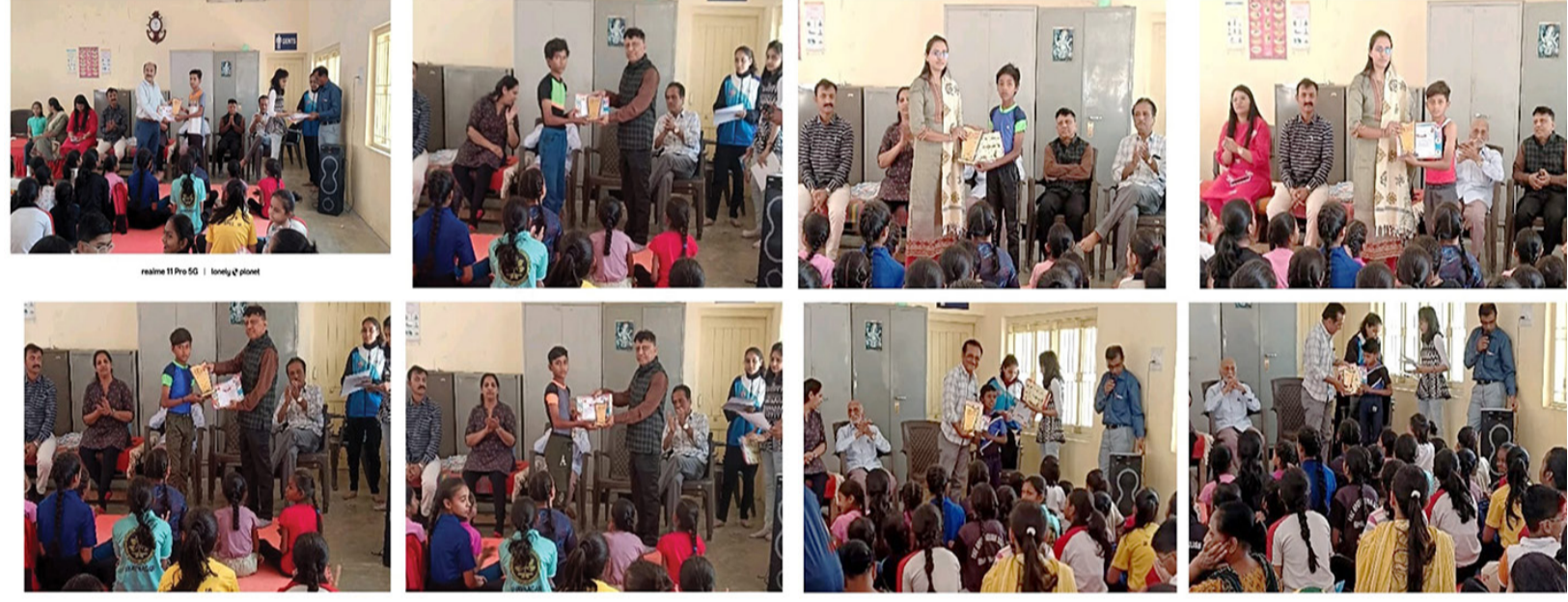
ઝાંસીની રાણી લક્ષ્મીબાઈ શાળા નંબર પરના ૯ બાળકોએ માર્યું મેદાન

રાજકોટ મિસ્ત્ર, તા.૩૦ ભાવનગર શહેરની અઢારમી નોનમેડલિસ્ટ યોગાસન સ્પર્ધાનું આયોજન આજે રવિવારે મહારાજા કૃષ્ણકુમારસિંહજી ભાવનગર યુનિવર્સિટી ખાતે કરવામાં આવ્યું હતું. આ સ્પર્ધા અંદર ૧૦, ૧૪, ૧૭, ૧૯ એમ ચાર એઈજ ગ્રુપમાં અને ભાઈઓ બહેનો માટે અલગ અલગ યોજાઈ હતી. જેમાં ઝાંસીની રાણી લક્ષ્મીબાઈ શાળા નંબર ૫૨ ના કુલ ૯ બાળકોએ અલગ કેટેગરીમાં ભાગ