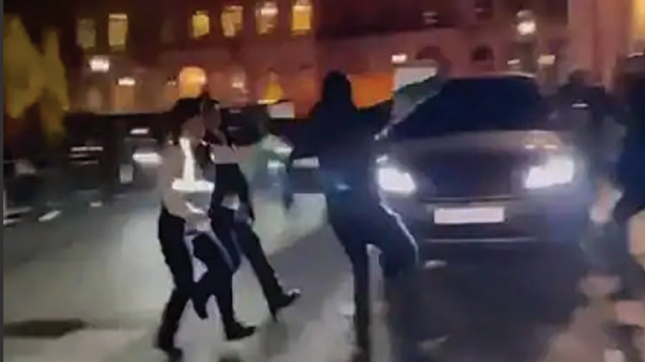
ભારતીય હાઈ કમિશનમાંથી ભારતીય ધ્વજ ઉતારી લીધો હતો. આ ઘટના પર ભારતે આકરી પ્રતિક્રિયા આપી હતી. ભારતે દિલ્હીમાં સૌથી વધુ બ્રિટિશ રાજદ્વારીને બોલાવ્યા હતા અને મિશનમાં સુરક્ષા વ્યવસ્થાની સંપૂર્ણ ગેરહાજરી અંગે ખુલાસો માંગ્યો હતો. ભારતની માંગ છે કે બ્રિટન તેની ધરતી પરથી કાર્યરત ખાલિસ્તાન તરફી તત્વો સામે કાર્યવાહી કરે. લંડનમાં ચેથમ હાઉસ થિંક ટેન્કમાં એક કાર્યક્રમ ઓડીને જયશંકરને ખાલિસ્તાની

નવીદિલ્હી, તા. ૭ ભારતે લંડનમાં વિદેશ મંત્રી એસ જયશંકરની સુરક્ષામાં ખલેલ પહોંચાડનાર ખાલિસ્તાન તરફી તત્વો સામે કાર્યવાહી કરવાની માંગ કરી છે. નવી દિલ્હીએ કહ્યું કે આ ઘટના આવા દળોને આપવામાં આવેલ લાયસન્સ દર્શાવે છે. બુધવારે સાંજે સંવાદ સત્રની સમાપ્તિ પછી જયશંકર જ્યારે સ્થળ છોડવામાં જઈ રહ્યા હતા ત્યારે તેમની સુરક્ષામાં ખલેલ પહોંચાડનાર ખાલિસ્તાન તરફી વિરોધકર્તાઓએ બેરીકેડ તોડવાનો પ્રયાસ કર્યો હતો. કેટલાક લોકોએ ભારત વિરોધી નારા પણ લગાવ્યા હતા. આ મામલે ભારતે આકરી પ્રતિક્રિયા આપી છે. નવી દિલ્હી ખાલિસ્તાન વિરોધી કમિશનના ઇન્ચાર્જને વાંધા પત્ર મોકલીને વિદેશ મંત્રીની સુરક્ષામાં થયેલી ક્ષતિ અંગે ઉગ્ર વિરોધ નોંધાવવામાં આવ્યો હતો. વિદેશ મંત્રાલયના પ્રવક્તા રણધીર જયસ્વાલે શુક્રવારે જણાવ્યું હતું કે, 'વિદેશ મંત્રીની મુલાકાત દરમિયાન, અમને બ્રિટનમાં હાજર અલગતાવાદી અને ઉગ્રવાદી તત્વો દ્વારા સુરક્ષા વ્યવસ્થામાં અવરોધોનો સામનો કરવો પડ્યો હતો. અમે બ્રિટિશ સત્તાવાળાઓને આ અંગે અમારી ઊંડી ચિંતા જણાવી છે તેમણે કહ્યું કે આ ઘટના એક મોટો પરિપ્રેક્ષ્ય ધરાવે છે. આ સ્પષ્ટપણે આવા દળોને આપવામાં આવેલ લાયસન્સ તેમજ તેમની ધમકીઓ અને ધાકધમકી દર્શાવે છે. તે ચુકેમાં અમારી રાજદ્વારી પ્રવૃત્તિઓને અવરોધવાના ઉદ્દેશ્યની ક્રિયાઓ પ્રત્યેની ઉદાસીનતાને પણ પ્રકાશિત કરે છે. ખાલિસ્તાન તરફી તત્વો દ્વારા સુરક્ષા ઉલ્લંઘનની આ પહેલી ઘટના નથી. કેટલાક ખાલિસ્તાન તરફી તત્વોએ માર્ચ ૨૦૨૩માં લંડનમાં