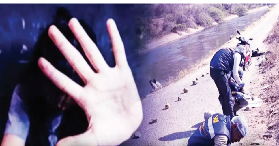
ત્રણ અજાણ્યા વ્યક્તિઓ વિરુદ્ધ બળાત્કાર, લૂંટ, હુમલો અને હત્યાના પ્રયાસનો નોંધ્યો કેસ : હોમ સ્ટે સંચાલક મહિલાનો પણ દેહ અભડાવ્યો