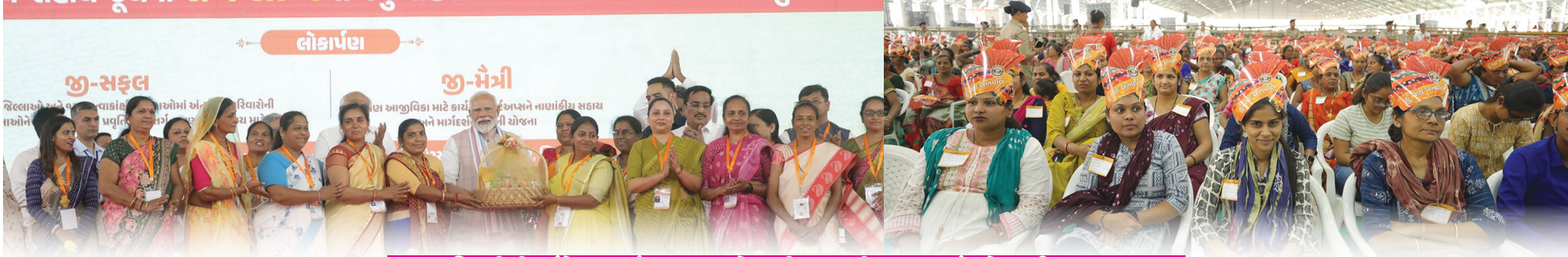
લાખપતિ દીદી સંમેલનમાં ૪૫૦ કરોડથી વધુની સહાયનું લોકાર્પણ કરતા PM