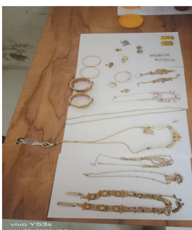
રાજકોટ મિસ્ત્ર, ગોંડલ તા.૩૧ ગોંડલ નાં માર્કેટ યાર્ડ માં ભાગીદારીમાં વેપારી પેઢી ચલાવતા

યાદમાં જણાવવાનું છે. રાજ્યના ૨૦ જિલ્લાઓ સહિત બે કેન્દ્રશાસિત પ્રદેશોના લાયક પુરુષ ઉમેદવારો આ ભરતીમાં ભાગ લઈ શકશે, જેમાં અમદાવાદ જિલ્લો પણ સામેલ છે. અગ્રે ઉલ્લેખનીય છે કે, ભરતી વર્ષ ૨૦૨૫-૨૬ માટે આગ્રિવીરોની ભરતી બે તબક્કામાં હાથ ધરવામાં આવનાર છે. જમાં પ્રથમ તબક્કા ઓનલાઈન કમ્પ્યુટર આધારિત લેખિત પરીક્ષા અને બીજો તબક્કો ભરતી રેલી શારીરિક કસોટી, દસ્તાવેજ તપાસ અને તબીબી તપાસ છે. ઓનલાઈન કોમ્પ્યુટર આધારિત પરીક્ષા લેખિત પરીક્ષા જૂન ૨૦૨૫માં યોજવામાં આવનાર છે.