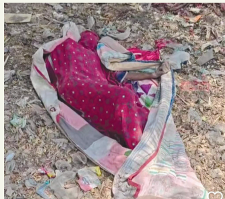
ઓછું સાંભળતા હોવાથી ટ્રેન આવી ગયાની ખબર ન રહી ને ઘટના બની

બીજા બનાવમાં ઘરેથી નીકળ્યા બાદ ભગવતીપરાના યુવાનની બેડી ચોકડીએ લાશ મળી