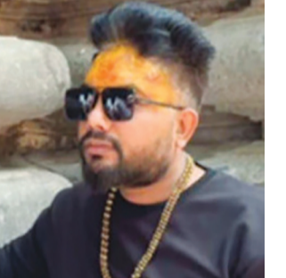
રજુ છે. જોકે આ સત્ય હકીકત શું છે તે પોલીસ તપાસ બાદ સામે આવી શકે છે. આપવાતની બનાવ અંગે સિવિલ હોસ્પિટલ દ્વારા જણાવવા મળ્યું હતું કે બપોરના સમયે

તેમણે ઝેરી દવા પી આપવાત કરી લીધો હતો. જેમાં આ ઘટના બુદ્ધિપૂર્વક સમ્રાટો છવાઈ ચૂક્યો હતો, ત્યારે આ બાબતે ઉપલેટા પોલીસનો સંપર્ક કરતા પોલીસ દ્વારા જણાવવામાં આવ્યું હતું કે, આપવાત કરનાર વ્યક્તિએ સિવિલ હોસ્પિટલમાં આપવાત કરી લીધો છે. આપવાતની ઘટના અંગે એક સુસાઈટ નોટ પણ મળી હોવાની માહિતીઓ પ્રાપ્ત થઈ છે. આપવાતની ઘટનાને લઈને ઉપલેટા પોલીસે દ્વારા સુસાઈટ નોટ કબજે કરવામાં આવી અને સમગ્ર બાબતે તપાસ હાથ ધરવામાં આવી છે. યુવાના પચલાં પાછળ આર્થિક સંકટામણ હોવાનું પ્રાથમિક તપાસમાં બહાર આવ્યું હોવાનું પોલીસે જણાવ્યું હતું.