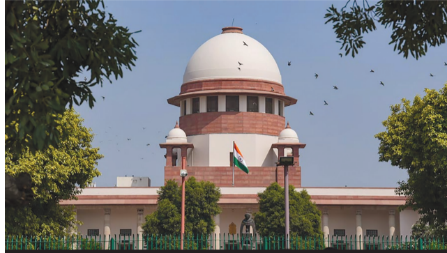
વહીવટીતંત્રએ ૨૦૨૧ માં પ્રયાગરાજ માં કેટલાક મકાનો નોટિસ પાઠવ્યાના ૨૪ કલાકની અંદર જ તોડી પાડ્યા હતા

નવીદિલ્હી, તા. ૧ ૨૦૨૧ માં કરવામાં આવેલા તોડી પાડવાના કાર્યને ‘ફૂર’ ગણાવતા, સુપ્રીમ કોર્ટે મંગળવારે ઉત્તર પ્રદેશ સરકાર અને પ્રયાગરાજ વિકાસ સત્તામંડળને છ અઠવાડિયાની અંદર ધરમાલિકોને ૧૦-૧૦ લાખ રૂપિયાનું વળતર ચૂકવવાનો નિર્દેશ આપ્યો. સુપ્રીમ કોર્ટે ૨૪ માર્ચે આપેલા તારણ બાદ આ ચુકાદો ૨૦૨૧ માં પ્રયાગરાજમાં કેટલાક મકાનો તેમના રહેણાંકોને નોટિસ પાઠવ્યાના ૨૪ કલાકની અંદર તોડી પાડ્યા હતા. ન્યાયાધીશ અભય એસ ઓકા અને ઉજ્જલ ભુયાનની બેન્ચે કહ્યું હતું કે તે પોતાના ખર્ચે તેમના પુનર્નિર્માણની મંજૂરી આપશે. અરજદારોના વકીલે કહ્યું હતું કે રાજ્ય સરકારે ખોટી રીતે મકાનો તોડી પાડ્યા હતા અને એવું માનીને કે જમીન ગેંગસ્ટર-રાજકારણી અતીક અહેમદની છે, જે ૨૦૨૩ માં પોલીસ એન્કાઉન્ટરમાં માર્યા ગયા હતા. અપીલકર્તાઓના જણાવ્યા મુજબ, ૧ માર્ચ, ૨૦૨૧ ના રોજ