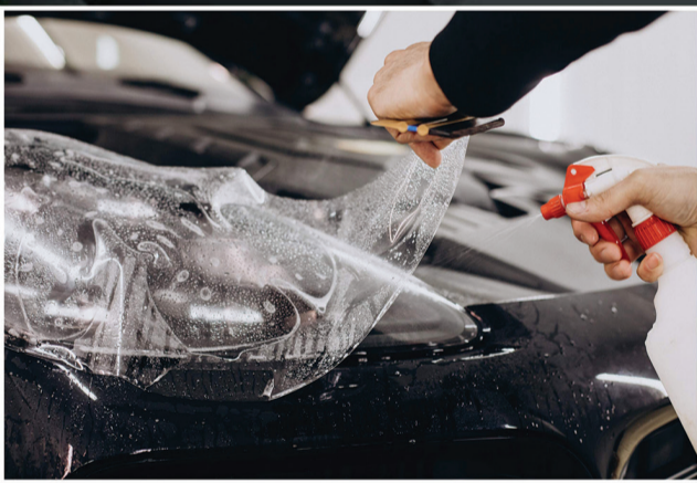
Paint Protection Film