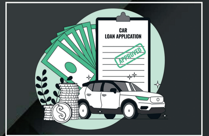
Loan & Insurance