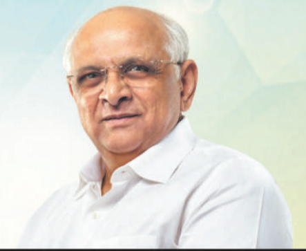
શ્રી ભૂપેન્દ્ર પટેલ માનનીય મુખ્યમંત્રી, ગુજરાત

ઇફકો ના માતૃ એકમ અને પ્રથમ યુરિયા કારખાનું સંકુલ કલોલની સુવર્ણ જયંતિ અને બીજ સંશોધન કેન્દ્ર, કલોલ, ગુજરાતનો શિલાન્યાસ સમારોહ