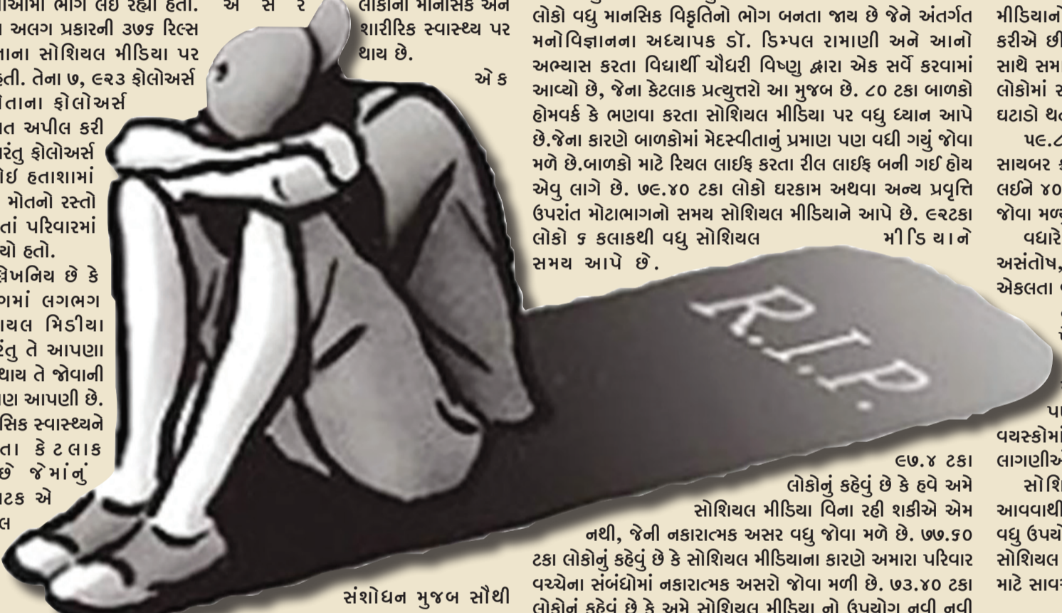
સંશોધન મુજબ સૌથી

માહિતી મેળવવા અથવા માત્ર મનોરંજન માટે કરીએ છીએ. આ ઉપરાંત ૭૯ ટકા લોકોનું કહેવું છે કે અમે સોશિયલ મિડીયાનો ઉપયોગ કરતા સમયે એકાંતમાં રહેવાનું વધુ પસંદ કરીએ છીએ. ૮૦ ટકા લોકો સોશિયલ મિડીયાના કારણે બીજા સાથે સમાજોજન કરી શકવાની ક્ષમતા ધરાવતા નથી. ૭૮.૫ ટકા લોકોમાં સોશિયલ મિડીયા ના ઉપયોગથી વ્યક્તિગત કૌશલ્યમાં ઘટાડો થતો જોવા મળ્યો છે. ૫૯.૮ ટકા લોકો સોશિયલ મિડીયા દ્વારા કોઈપણ પ્રકારના સાચબર કાઢી નો ભોગ બની ચૂક્યા છે. મોટાભાગે ૧૦ વર્ષથી લઈને ૪૦ વર્ષ સુધીના વ્યક્તિઓમાં સોશિયલ મિડીયાનું વળગણ જોવા મળ્યું છે. વધારે પડતો સોશિયલ મિડીયાનો ઉપયોગ કરવાથી ઉદાસી, અસંતોષ, હતાશા, ઘ આવવામાં વિક્ષેપ, તણાવ, ચીડિયાપણું, એકલતા વગેરે જેવી માનસિક બીમારીઓનો ભોગ બની શકે છે. તેમજ બાળકોમાં ધ્યાન ન ટકાવી રાખવાની બીમારીઓ પેદા થાય છે. જેના કારણે ડિસ્ટ્રેક્શિયા જેવી ભૂલવાની મનોવિકૃતિઓ પેદા થાય છે. વધુ પડતો સોશિયલ મિડીયાનો ઉપયોગ કરવાના કારણે ડિપ્રેશન જેવી સ્થિતિ પણ સર્જઈ શકે છે. ખાસ કરીને કિશોરો અને યુવાન વયસ્કોમાં સોશિયલ મિડીયાનો ઉપયોગ ચિંતા અને હતાશાની લાગણીઓને વધારી શકે છે. સોશિયલ મિડીયાના કારણે વ્યક્તિગત સંબંધોમાં દુરી આવવાથી માનસિક સંઘર્ષ ઉત્પન્ન થાય છે. સોશિયલ મિડીયાના વધુ ઉપયોગના કારણે વ્યક્તિમાં આગસ પણ જોવા મળે છે. આમ સોશિયલ મિડીયા જેટલું ઉપયોગી છે એટલું જ કષ્ટદાયક પણ છે. માટે સાવચેત રહેવું જરૂરી છે.