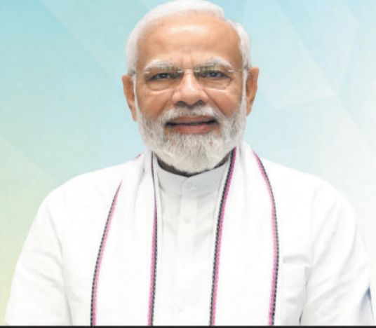
શ્રી નરેન્દ્ર મોદી માનનીય પ્રધાનમંત્રી

पूर्णतः सहकारी स्वामित्व Wholly owned by Cooperatives