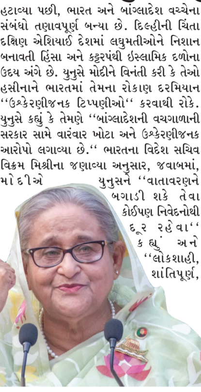
હસીના, ભારત અને બાંગ્લાદેશ વચ્ચેના સંબંધો તણાવપૂર્ણ બન્યા છે. દિલ્હીની ચિંતા દક્ષિણ એશિયાઈ દેશોમાં લઘુમતીઓને નિશાન બનાવતી હિંસા અને કટ્ટરપંથી ઇસ્લામિક દળોના ઉદય અંગે છે. યુનુસે મોદીને વિનંતી કરી કે તેઓ હસીનાને ભારતમાં તેમના રોકાણ દરમિયાન "ઉશ્કેરણીજનક ટિપ્પણીઓ" કરવાથી રોકે. યુનુસે કહ્યું કે તેમણે "બાંગ્લાદેશની વચગાળાની સરકાર સામે વારંવાર ખોટા અને ઉશ્કેરણીજનક આરોપો લગાવ્યા છે." ભારતના વિદેશ સચિવ વિક્રમ મિશ્રીના જણાવ્યા અનુસાર, જવાબમાં, મોદીએ યુનુસને "વાતાવરણને બગાડી શકે તેવા કોઈપણ નિવેદનોથી દૂર રહેવા" અને "લોકશાહી, શાંતિપૂર્ણ,

આ બેઠકમાં વિદેશ મંત્રી એસ જયશંકર અને રાષ્ટ્રીય સુરક્ષા સલાહકાર (NSA) અજિત ડોભાલ પણ હાજર રહ્યા હતા. ગુરુવારે પણ, બંને નેતાઓ BIMSTEC બેલોકના અન્ય નેતાઓ સાથે બેંગકોકમાં જોવા મળ્યા હતા, પરંતુ પોર્ટગીઝ દેશો વચ્ચેના સંબંધોમાં ખટાશ આવ્યા પછી દ્વિપક્ષીય બેઠક પહેલીવાર થઈ હતી. હસીનાને ભારતની વિશ્વસનીય અને વિશ્વસનીય મિત્ર માનવામાં આવતી હતી, પરંતુ તેમને પદ પરથી