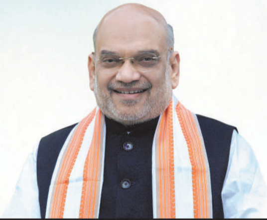
શ્રી અમિત શાહ માનનીય કેન્દ્રીય ગૃહ અને સહકાર મંત્રી