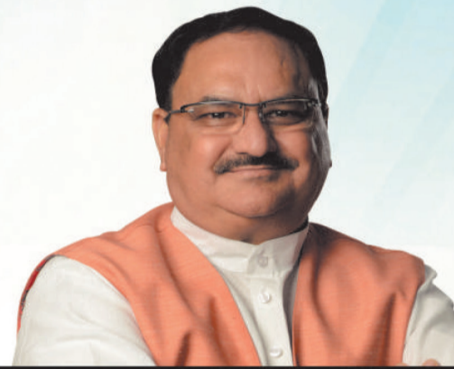
શ્રી જે પી નડ્ડા આરોગ્ય અને પરિવાર કલ્યાણ મંત્રી અને રસાયણ અને ખાતર મંત્રી