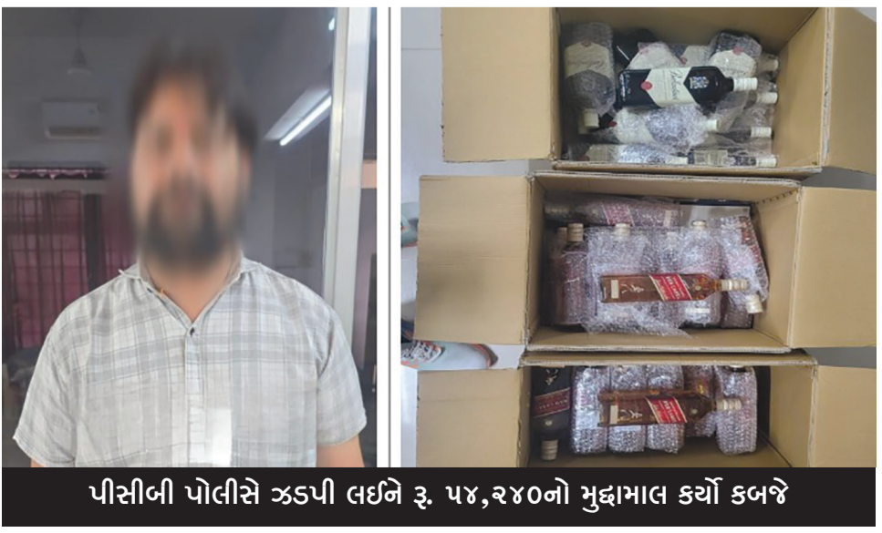
પીસીબી પોલીસે ઝડપી લઈને ૩.૫૪,૨૪૦નો મુદ્દામાલ કર્યો કબજે