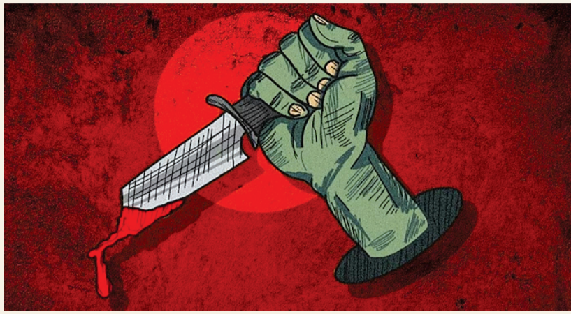
પ્રેમાંધ અક્ષયે પારકી પત્નિને પામવા પોતાની પત્નિને આપી દીધા હતાં છુટાછેડા: પતિ ઘરેથી નીકળતાં રીન્કલે પ્રેમી અક્ષયને ફોન કરી લોકેશન આપ્યું અને અક્ષયે કાપત્રાને અંજામ આપ્યો

ચોકાવનારી આ ઘટના જામનગર પંથકની છે. અહિ જામનગર-કાલાવડ ધોરી માર્ગ પર વિજરખી ગામ પાસે એક કાર અને બૂલેટ મોટરસાયકલ વચ્ચે અકસ્માત સર્જાયો હતો જેમાં બૂલેટ ચાલક યુવાનનું મૃત્યુ નીપજ્યું હતું. પોલીસની ડાણપૂર્વકની તપાસમાં કાર ચાલકે ઈરાદાપૂર્વક બૂલેટ ચાલકને કચડી નાખ્યો હોવાનું અને તેમાં પ્રમ -કરણ કારણભૂત હોવાનું તેમજ પ્રેમમાં અંધ બનેલી પત્નિએ જ પોતાના પ્રેમી મારફત પતિની હત્યા કરાવ્યાનો પદક્રમ થતાં પોલીસ પણ ચોકી ગઈ હતી. પત્નિ અને તેના પ્રેમી સામે કાવત્રુ હત્યા સહિતની કલમો હેઠળ ગુનો નોંધ્યો હતો. પોતાના પ્રેમી મારફત પતિનું કાસળ કઢાવી નાખ્યાનું સામે આવતાં પોલીસ તંત્ર ચોકી ઉઠ્યું છે, અને પતિની હત્યા અંગે પત્ની અને પ્રેમી સામે ગુનો નોંધ્યો છે.