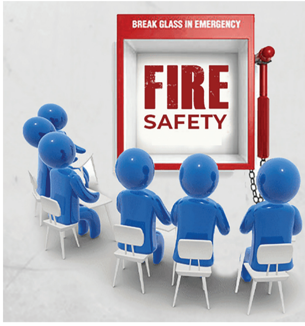
ઉપરાંત તેમણે આરોગ્ય સંસ્થાઓમાં દર મહિનાની કઠ્ઠી તારીખે ફાયર મોકડ્ડીલ અચૂક કરવા સૂચવ્યું હતું. આ મોકડ્ડીલમાં આરોગ્ય સંસ્થાના તમામ