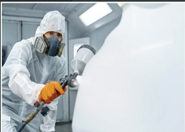
Full Body Paint & Modification