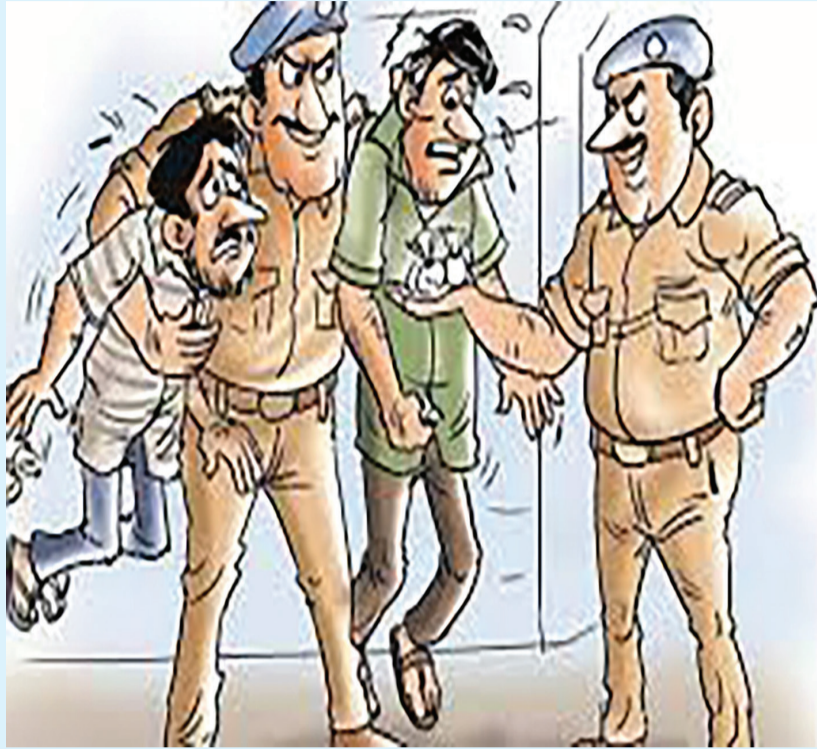
બીજી ઘટનામાં મોબાઈલ ફોનની લૂંટ કરી ભાગી રહેલાને લોકોએ જ પકડીને ઠમહોરી પોલીસને સોંપ્યો