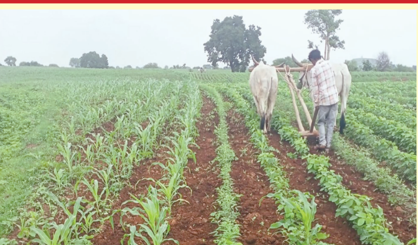
વહીવટી અનુકુળતા અને બિનખેતી પરવાનગી મેળવવાની કાર્ય પદ્ધતિમાં સરળીકરણના ભાગરૂપે લેવાયો નિર્ણય

રાજકોટ, તા. ૮ રાજ્ય સરકારના મહેસુલ વિભાગ દ્વારા બિનખેતીની પરવાનગી તથા પ્રિમીયમ સાથે બિનખેતી પરવાનગી મેળવવાની કાર્યપદ્ધતિમાં સરળીકરણ કરવા બાબતે હાલ સરકાર વિચાર કરી રહી છે. જેને ધ્યાને લઈ મહેસુલી પ્રક્રિયામાં વહીવટી સુધારણાના ભાગ રૂપે સરકારે ખેતીની જમીનોને બિનખેતીમાં રૂપાંતર કરવા તથા પ્રતિબંધિત સત્તા પ્રકાર અથવા નવી શરતની જમીનોને પ્રિમીયમ વસૂલી લઈ બિનખેતી પરવાનગી આપવા માટે મહેસુલી ટાઈટલ ઈસ્તુ કરવા જોગવાઈ કરવામાં આવી છે. જેમાં ખેતીની જમીન ધરાવતાર મરજીયાત રીતે પોતાની જમીન અંગે મહેસુલી ટાઈટલ અને કાયદેસર કબજેદાર પ્રમાણપત્ર મળી રહે તે માટે કલેક્ટરને અરજી કરી શકશે. જેની ચકાસણી અને નિર્ણય અરજદારે જે ફી ભરવાની રહેશે તે પરત નહીં અપાય. એવી જ રીતે કલેક્ટરને આ પ્રકારની અરજી મળીએ તેની ચકાસણી હક પત્રક સંબંધિત મહેસુલ કાયદા અને નિયમોની ચકાસણી પણ કરવાની રહેશે. એટલું જ નહીં જમીનના કોઈ ભાગનાં સંપાદન અંગે કાર્યવાહી ચાલે છે કે કેમ ? તેની પણ ચકાસણી કરવી પડશે. એટલું જ નહીં જે જમીનનું હકપત્રક સંબંધિત મહેસુલી ટાઈટલ અને કાયદેસર કબજેદાર પ્રમાણપત્ર માંગેલ હોય તેને લગતાં છેલ્લા ૨૫ વર્ષના તબદિલી, વારસાઈ, વહેંચણીના વ્યવહારો