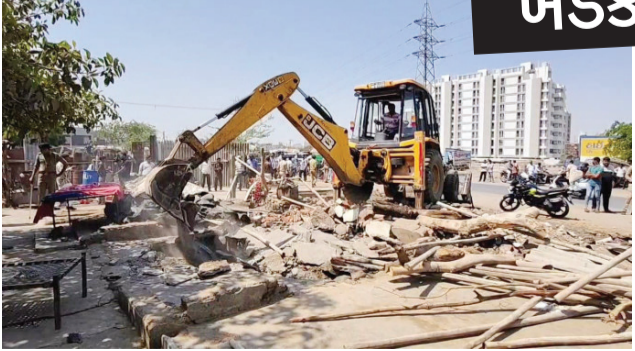
૬૦ જેટલા ગેરકાયદે દબાણો ઉપર બુલડોઝર ફેરવી દેવામાં આવ્યું હતું. રાજકોટ તાલુકા મામલતદાર કચેરીના સૂત્રોના જણાવ્યા અનુસાર અંદાજે ૩૦ કરોડની બજાર કિંમતની ૫૦૦૦ ચોરસ મીટર કેટલી સરકારી જગ્યા ઉપર દબાણ કરતા હોય કોમર્શિયલ સહિત અન્ય ગેર વ્યાજબી પ્રવૃત્તિઓ શરૂ કરી દીધી હતી અને આ જગ્યા પર ઝૂંપડા સહિતના ૬૦ જેટલા દબાણો પણ ખડકી દીધા હતા.

રાજકોટ, તા. ૮ રાજ્ય સરકારના આદેશથી હાલ સમગ્ર રાજ્યમાં ડિમોલિશનની કામગીરી ચાલી રહી છે ત્યારે રાજકોટ જિલ્લામાં પણ રાજકોટ કલેક્ટર પ્રભાવ જોશીના આદેશ ને અનુરૂપ કીમતી સરકારી જમીન ઉપર ગેરકાયદે ખડકાયેલા જે દબાણ છે તેને તોડી પાડવામાં આવી રહ્યા છે. આ ઝુંબેશના ભાગરૂપે મામલતદારો દ્વારા ઘડાઈડ ગેરકાયદેસર દબાણો તોડી પાડવામાં આવે છે ત્યારે ગઈકાલે જિલ્લા કલેક્ટરના આદેશ થી રાજકોટ તાલુકા મામલતદાર અને તેની ટીમ દ્વારા વાવડીમાં