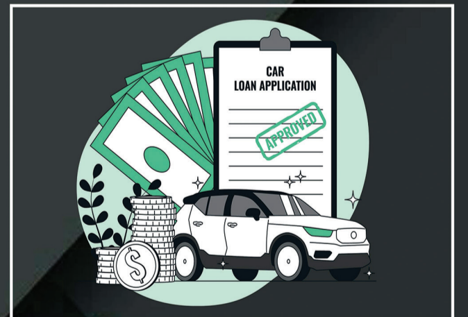
Loan & Insurance