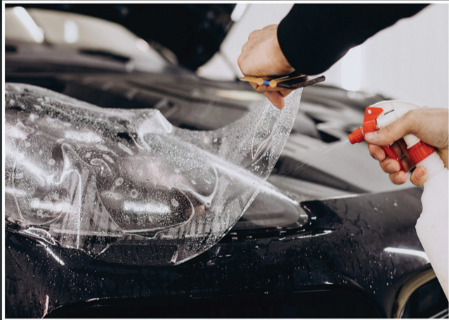
Paint Protection Film