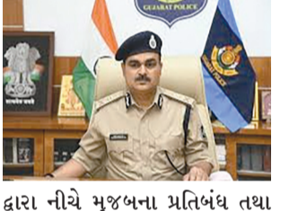
દ્વારા નીચે મુજબના પ્રતિબંધ તથા વૈકલ્પિક વ્યવસ્થાઓ જાહેર કરવામાં આવી છે. આ માટે સર્વેશ્વર ચોક ખાતે આવેલ બંને સાઈડના રસ્તા ૫૦-૫૦ મીટર બંધ કરવામાં આવશે. સર્વેશ્વર ચોકની આસપાસની દુકાન/ઓફિસની પાર્કિંગની અલાયદી વ્યવસ્થા કરવામાં આવશે અને વ્યાપારી-ગ્રાહકોની અવર-જવર માટે રસ્તો ચાલુ રહેશે જ્યાં ગાડીઓ પાર્કિંગ કરી શકાશે.

રાજકોટ મિરર, તા.૮ રાજકોટ શહેર વોર્ડ નં.૭માં આવેલા સર્વેશ્વર ચોકથી ડી.યાજ્ઞિક રોડને જોડતા હૈયાત વોકળાને ડાયવર્ઝન કરી નવું બોક્સ કલ્વર્ટ બનાવવાનું કામ સર્વેશ્વર ચોકમાં પૂર્ણતાની નજીક હોય, રાજકોટ નાગરિક બેંક પાસે ડી. યાજ્ઞિક રોડ પર કામ શરૂ થશે. જે અન્વયે ડી. યાજ્ઞિક રોડ પર સરદારનગર મેઈન રોડથી ન્યુ જાગનાથ શેરી નં-૨૦ સુધીના રોડ પર વાહનોની અવર જવર આગામી ૪ માસ સુધી બંધ કરવામાં આવશે. આથી ડી. યાજ્ઞિક રોડ પર ધી માલવીયા ચોકથી રેસકોર્સ તરફ અવર-જવર માટે સર્વેશ્વર ચોક ખાતે પોલીસ કમિશનર જિજ્ઞેશ કુમાર ઝા