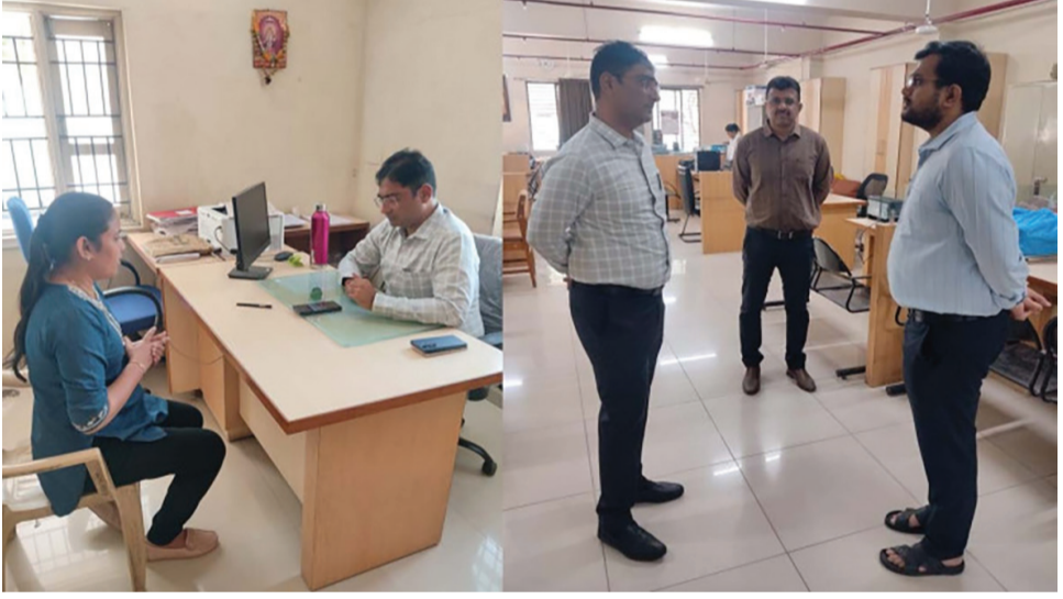
વેસ્ટ ઝોનમાં ફરજ સમયે હાજર ન રહેલ બે કર્મચારીઓને પાઠવવામાં આવી નોટીસ

રાજકોટ, તા. ૮ છેલ્લા ઘણા સમયથી રાજકોટ મહાનગરપાલિકાના વોર્ડ ઓફિસોની અનેક ફરિયાદો ઉઠવા પામી રહી છે જેમાં એ વાતની સ્પષ્ટતા કરવામાં આવી છે કે હાલ જે પગલાંઓ લેવામાં આવી રહ્યા છે અથવા તો જે લોકોને સહાનુભૂતિ અને યોગ્ય વ્યવસ્થા કામગીરીમાં થવી જોઈએ તે મનપાના કર્મચારીઓ અધિકારીઓ દ્વારા પૂરી કરવામાં આવી નથી અને પરિણામ સ્વરૂપે હાલ તેઓને ઘણી હેરાનગતિનો સામનો કરવો પડે છે જે ન થાય તે માટે ખરી વાર્તાવિક સ્થિતિ ની ચકાસણી કરવા મુદ્દા મ્યુનિસિપલ કમિશનર મેદાને ઉતાર્યા હતા. ઘણી ખરી સરકારી કચેરીઓ એવી છે કે જ્યાં કર્મચારીઓની લાલિયા વાડી ચાલતી હોય ત્યારે મહાનગરપાલિકામાં પણ શું આ સ્થિતિ છે કે કેમ તે અંગે મ્યુનિસિપલ કમિશનર તુષાર સુમેરા દ્વારા સરપ્રાઈઝ ચેકિંગ કરવામાં આવ્યું હતું. સૂત્રો દ્વારા મળતી માહિતી મુજબ કચેરીમાં કર્મચારીઓ નિયમિતપણે હાજર રહે છે કે કેમ