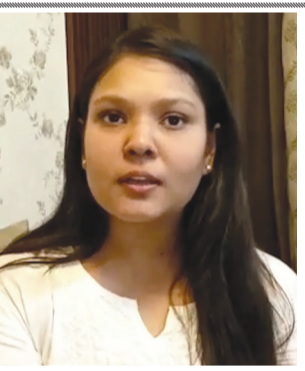
શ્રી સરકાર સીટી પ્રાંત અધિકારી મહેક જેને દ્વારા શરત ભંગનો કેસ ચલાવી જમીન ફરી સરકાર હસ્તક લેવા આદેશ કર્યો છે.

રાજ્યના કોઈપણ જિલ્લાના જિલ્લા કલેક્ટર કોઈ એવી જગ્યા હોય કે જેનો યોગ્ય રીતે ઉપયોગ કરી શકાતો હોય તે માટે તે અધિક્ષક સ્થાનેથી હુકમ કરી ફળ ઝાડ અને બગીચા બનાવવાના હેતુ માટે જે તે સરકારી જગ્યાને ફાળવવામાં આવે છે પરંતુ ઘણી ખરી વખત જે હેતુથી જગ્યા ફાળવવામાં આવી હોય તેમાં શરત ભંગ પણ થતી હોય છે અને તે જગ્યા અંતે શ્રી સરકાર થઈ જાય છે. આવી જે ઘટના ગઈકાલે ઘટી જેમાં રાજકોટ તાલુકાના ફાળદંગ ગામે કલેક્ટર તંત્ર દ્વારા ફળ ઝાડ અને બગીચા બનાવવાના હેતુથી જમીન ફાળવવામાં આવી હતી ત્યારે આ જમીન પર શરતભંગ