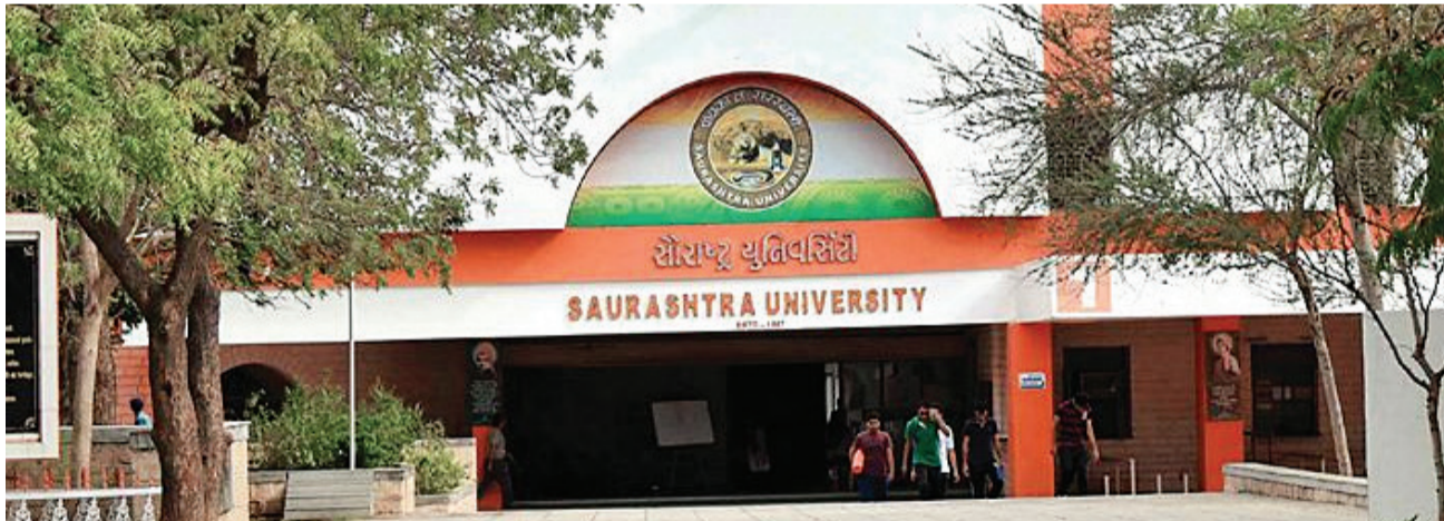
રાજકોટ, તા. ૧૦ જીકાસ પોર્ટલ પર કામગીરી ઝડપભેર આટોપી લેવા શિક્ષણ વિભાગ દ્વારા તાકીદે કરવામાં આવી છે ત્યારે વિદ્યાર્થીઓને કોઈપણ પ્રકારની અગવડતા નો સામનો ન કરવો પડે તે માટે હાલ તમામ પગલાંઓ લેવામાં આવી રહ્યા છે ત્યારે સોરઠા યુનિવર્સિટીના ભવન તથા સંલગ્ન કોલેજોમાં પ્રવેશ માટે પરિણામ પૂર્વે જીકાસ પોર્ટલ પર તાકીદે રજિસ્ટ્રેશન ની પ્રક્રિયા શરૂ કરી દેવામાં આવી છે એટલું જ નહીં આ કામગીરી માટે અડીસોથી વધુ સેન્ટરો પણ શરૂ કરી દેવાયા છે . પરંતુ વિદ્યાર્થીઓના એડમીશન કોર્ષવાઈઝ સેન્ટ્રલ એડમીશન લીસ્ટ જો બહાર પાડવામાં આવે તો જ ખરા અર્થમાં આ યોજના સિદ્ધ થઈ શકે તેમ છે. ગત વર્ષે સોરઠા યુનિવર્સિટી દ્વારા સેન્ટ્રલ એડમીશનની કોઈ કાર્યવાહી કરવામાં

૨૫૦થી વધુ સેન્ટરો શરૂ : વિદ્યાર્થીઓના નામ ઈ-મેઈલ અને મોબાઈલ નંબર સાથે વિદ્યાર્થીઓના કિવક રજિસ્ટ્રેશન કરવામાં આવ્યા શરૂ