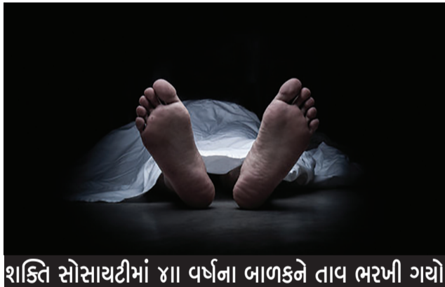
શક્તિ સોસાયટીમાં ૪૫ વર્ષના બાળકને તાવ ભરખી ગયો

રાજકોટ: જામનગર રોડ પર મનહરપુર ઢોળાના મહતીયાપરામાં રહેતાં યુવાનની કોહવાયેલી અને દુર્ગધ યુક્ત લાશ તેના જ ઘરમાંથી મળી આવતાં અરેરાટી વ્યાપી ગઈ હતી. આ યુવાનનો મોટો ભાઈ પાંચ દિવસથી બહારગામ હોઈ પોતે ઘરે એકલો જ હતો. મોતનું કારણ જાણવા ફોરેન્સિક પોસ્ટમોર્ટમ કરાવાયું છે. વિગતો પર નજર કરીએ તો નવી કોર્ટ સામે મનહરપુર ઢાળમાં આવેલા એક મકાનમાંથી અત્યંત દુર્ગધ આવતી હોઈ અને ઘરનો દરવાજો અંદરથી બંધ હોઈ આસપાસના લોકોએ પોલીસને જાણ કરતાં યુનિવર્સિટી પોલીસની