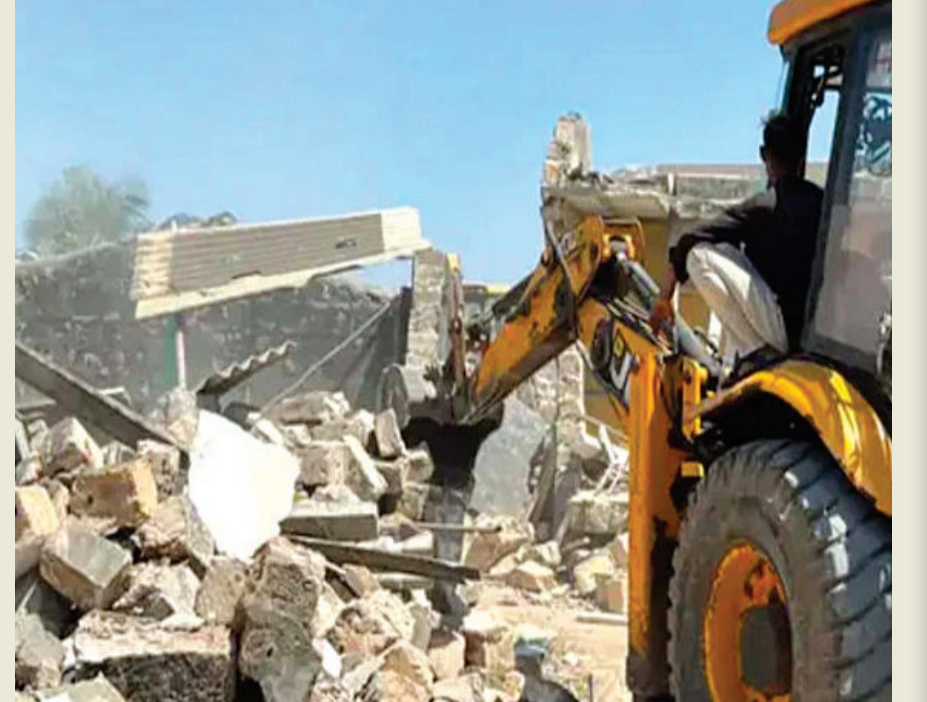
રાજકોટ, તા. ૧૧

૨૦૦ મીટર જગ્યામાં દબાણ ખડકી દેતા અનેક વખત આપવામાં આવી હતી નોટિસ અંતે મામલતદારે ફેરવ્યું બુલડોઝર