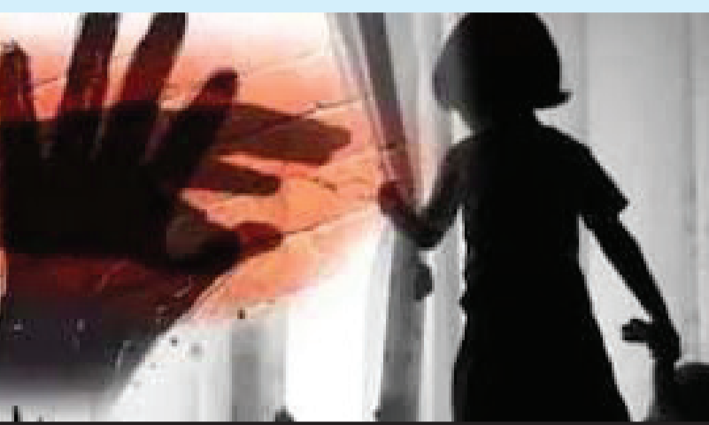
વિફૂતિની ત્રીજી ઘટનામાં ગાય સાથે દૂષ્કર્મ આચરનારો સીસીટીવીમાં કેદ થયો: જામનગર પોલીસે દબોચી લીધી

પીંખી નાંખી હતી. સાત વર્ષની બાળકી પાસેની દૂકાનમાં સામાન ખરીદવા ગઈ હતી. દૂકાને સાંઈઠ વર્ષીય વૃદ્ધ વેપારી બેઠો હતો, જે સાત વર્ષની બાળકીને કોકા કોલા આપવાના બહાને ઘરમાં લઈ ગયો અને બાદમાં તેની ઉપર દુષ્કર્મ આચર્યું હતું. બાળકી જ્યારે ઘરે આવી ત્યારે માતા-પિતાએ પૂછ્યું તો તેણે સમગ્ર ઘટના જણાવી. બાદમાં માતા-પિતાએ આ મામલે પોલીસ સ્ટેશનમાં ફરિયાદ નોંધાવી હતી. સમગ્ર મામલે પોલીસે દુષ્કર્મ અને પોક્સો હેકળ ગુનો નોંધી આરોપીની ધરપકડ કરી લીધી છે. રાજ્યમાં સતત બનતી આવી ઘટનાના કારણે હવે ગુજરાતમાં મહિલા અને દીકરીઓની સુરક્ષિત હોવાના પોકળ સાબિત થઈ રહ્યા છે. મહિલા અને દીકરીઓ ઘરની પાસેની દૂકાનમાં વસ્તુ લેવા જતા દરમિયાન પણ સુરક્ષિત નથી. એવામાં ગુજરાતની સુરક્ષા અને વ્યવસ્થા પર મોટો પ્રે ભો થાય છે. બીજી આવી ઘટના સુરત શહેરમાં બની છે. જેમાં નરાધમ દ્વારા એક બાળકી સાથે હલકટ યાળા કરાયા હતાં. આ બાળકી પણ સાત વર્ષની છે. બાળકીને નિર્વસ્ત્ર કરીને તેની