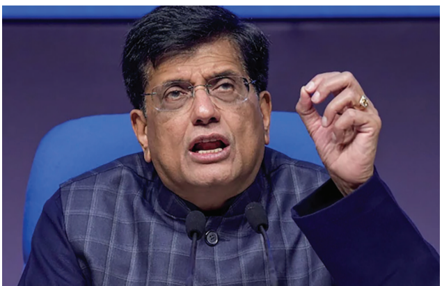
બિલિયનથી US500 બિલિયન સુધી. વિદેશ મંત્રી એસ જયશંકરે પણ આ વિકાસ પર ટિપ્પણી કરતા કહ્યું કે ભારત

હતી, પરંતુ તેને ૯૦ દિવસની રાહત મળી છે. ગોયલે કહ્યું કે ભારત અને અમેરિકા વચ્ચે ચર્ચાઓ 'ઈન્ડિયા ફર્સ્ટ' ના સિદ્ધાંત પર આગળ વધી રહી છે, જે દેશના વિકસિત ભારત ૨૦૪૭ ના વિઝન સાથે સુસંગત છે. ભારત અને અમેરિકા ૨૦૨૫ ના પાનખર (સપ્ટેમ્બર-ઓક્ટોબર) સુધીમાં તેમના વેપાર સોદાના પ્રથમ તબક્કાને પૂર્ણ કરવાનું લક્ષ્ય ધરાવે છે, જેમાં દ્વિપક્ષીય વેપારને બમણાથી વધુ વધારવાનો લાંબા ગાળાનો દ્યેય છે - વર્તમાન ૪૫૯૧