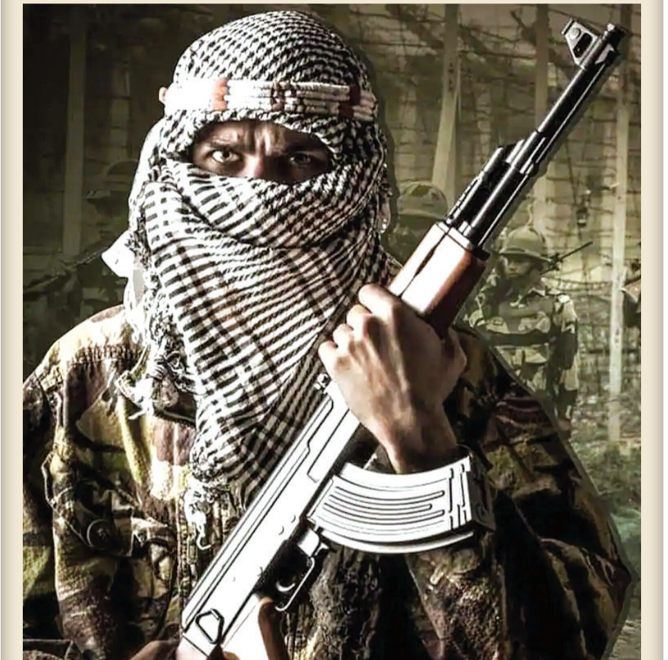
નવીદિલ્હી, તા. ૧૪

દિલ્હીની કોર્ટે પોતાના આદેશમાં આ વાતનો કર્યો ઉલ્લેખ, કહ્યું કાવતરું ફક્ત મુંબઈ પૂરતું મર્યાદિત ન હતું