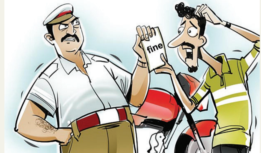
રાહદારી ન જ કરે તે વાત સો ટકા સાચી કારણકે તેને મનમાં એક વાતનો જ ડર હોય છે કે જો તેના દ્વારા કોઈ પણ પ્રકારની ગતિવિધિ કરવામાં આવશે તો તે દંડિત થશે અને આ તમામ

વિભાગના કર્મીઓ નાણા ઉસેડવામાં વ્યસ્ત હોય છે તો ક્યાંથી તે પ્રજાનું રક્ષણ કરે. આ તમામ મુદ્દે હવે ગંભીરતાપૂર્વક વિચાર કરવો ખૂબ જરૂરી છે આ માટે રાજ્ય સરકારની સાથોસાથ સ્થાનિક પ્રશાસને પણ ધ્યાન કેન્દ્રિત કરવું ખૂબ જરૂરી છે જો આ કરવામાં તંત્ર ક્યાંય સ્થાનિકો પર પડી શકે છે. હાલ જરૂરી એ છે કે, આ અંગે યોગ્ય ડિસિપ્લિન કેળવવામાં આવે માત્ર પોલીસ વિભાગ જ નહીં પરંતુ અન્ય તમામ વિભાગોની જો વાત કરવામાં આવે તો તેમના દ્વારા જે કામગીરી કરવામાં આવે છે તે ૧૦૦% નથી હોતી અને પરિણામ સ્વરૂપે લોકોએ ઘણી તકલીફ અને હેરાનગતિનો સામનો કરવો પડે છે. માત્ર ડિજિટલ સિગ્નલ રાખી દેવાથી ટ્રાફિકની સમસ્યા નો નિવેડો આવે તે જરૂરી નથી જો ત્યાં એક પણ ટ્રાફિક પોલીસનો કર્મચારી ઊભો હોય તો સિગ્નલ તોડવાની હિંમત કોઈપણ રાહચાલક