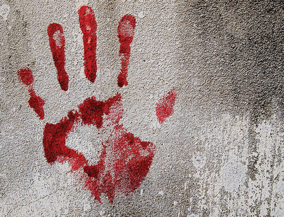
આવતા બંને શખ્સો ત્યાંથી ફરાર થઈ ગયા હતા. પોલીસે હત્યારા દિકરાને અને તેને મદદ કરનારને ગણતરીના સમયમાં ઝડપી લઈ કાર્યવાહી કરી હતી. હત્યાની બીજી ઘટના જોઈએ યાર સામે હત્યા સહીતની કલમ હેઠળ ગુનો નોંધીને ગણતરના કલાકમાં ચારેયની ધરપકડ કરીને