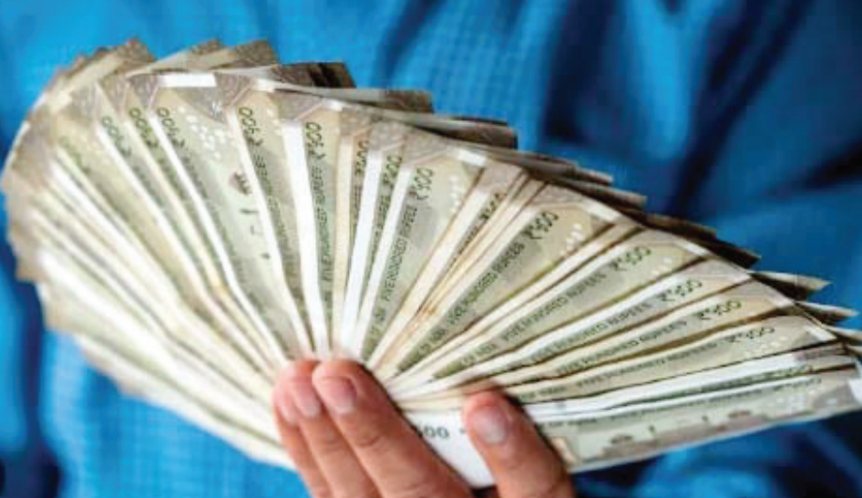
તેવા નિયમો હતા. જેથી આરોપીએ વૃદ્ધને જરૂરી સભ્યો લાવવા કહેતા સગા સંબંધી અને મિત્રવર્તુળમાં ફોની સ્કીમમાં સભ્યો થવા તેઓ કહેતા હતા. તેમજ ફરિયાદી પરિવારજનો અને અન્ય મિત્રવર્તુળ સહિતના સભ્યોના ફોન ક્રોડવાઈને કુલ રૂપિયા ૬.૦૬ લાખ આપ્યા હતા. ત્રીસ મહિના પહેલા સગા સંબંધી અને મિત્રવર્તુળમાં ફોની સ્કીમમાં સભ્યો થવા તેઓ કહેતા હતા. મારી આથક પરિસ્થિતિ સારી નથી હું સ્કીમ ચાલું કરી શકું તેમ નથી મારી પાસે સગવડ થશે એટલે તમામ

પિગતો પર નજર કરીએ તો અમરાઈવાડીમાં પાર્લરમાં નોકરી કરતા શખ્સે થોડા સમય પહેલા લોભામણી પોન્ઝી સ્કીમ શરૂ કરી હતી જેમાં દુકાને આવતા વૃદ્ધ સહિત અનેક લોકોને ટાર્ગેટ કરીને સ્કીમમાં રૂપિયા ભરાવીને ચૂનો લગાડ્યો હતો. જેમાં સભ્યો લાવવાનું કહીને ૨૫ જેટલા લોકો પાસેથી કુલ રૂપિયા ૩૬.૭૦ લાખ પડાવ્યા હતા અને અધવચ્ચે સ્કીમ બંધ કરીને રૂપિયા આપવાના બદલે બહાના બતાવતો હતો. રૂપિયાની ઉધરાણી કરતા પોતાનું નેટવર્ક બહુ મોટું છે રૂપિયા માગશો તો પત્તો પછા નહી