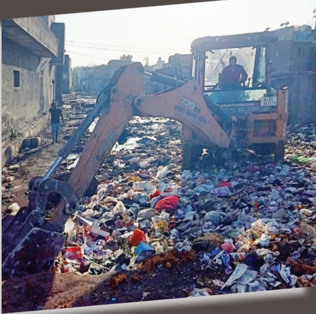
મહત્વનું એ છે કે ચોમાસા દરમિયાન ગટર ઉભરાવી તથા વોકળો ઉભરાવ સહિતની ઘણી સમસ્યાઓ જેવા મળતી હોય છે ત્યારે લોકોને કોઈપણ પ્રકારની હેરાનગતિનો સામનો ન કરવો પડે તે વાતની ગંભીરતાને ધ્યાને લઈને જ હાલ આ કામગીરી પ્રિમોન્સૂનના ભાગરૂપે શરૂ કરી દેવામાં આવી છે ત્યારે નદીનાળા ની પણ સફાઈ આગામી દિવસોમાં હાથ ધરાશે જેથી ચોમાસા દરમિયાન લોકોને હેરાનગતિનો સામનો ન કરવો પડે.

૬૮ ટન કચરાનો કરવામાં આવ્યો નિકાલ : ચોમાસામાં બ્લોકેજની સમસ્યા ન ઉઠ્ઠવે તે હેતુસર કામગીરી આરંભી