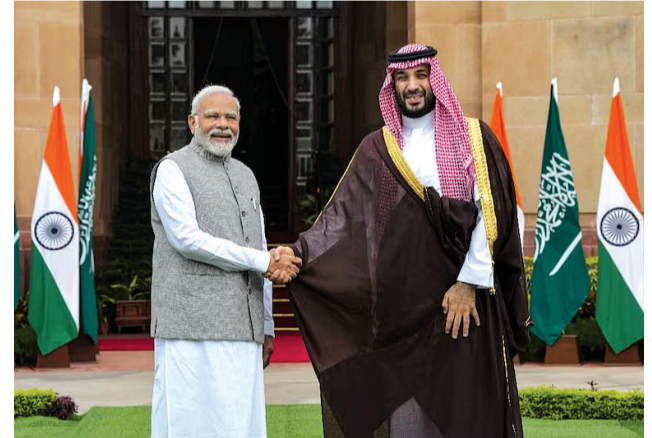
વિદેશ સચિવે એ પણ માહિતી આપી કે પીએમ મોદીની આ મુલાકાત સાઉદી અરેબિયાના કાઉન પ્રિન્સ અને વડા પ્રધાન પ્રિન્સ મોહમ્મદ બિન સલ્માનના આમંત્રણ પર થઈ રહી છે. તેમણે કહ્યું કે વડા પ્રધાન મોદી અને સાઉદી કાઉન પ્રિન્સ વચ્ચે ખૂબ જ આદરપૂર્ણ સંબંધ છે, જેનો સૌથી કાયદો ભારત-સાઉદી સંબંધોને થયો છે. આ મુલાકાત ઊર્જા, રોકાણ, સુરક્ષા અને પ્રાદેશિક સહયોગ

નવીદિલ્હી, તા. ૧૯ પ્રધાનમંત્રી નરેન્દ્ર મોદી આગામી સપ્તાહે ૨૨ અને ૨૩ એપ્રિલ ૨૦૨૫ ના રોજ સાઉદી અરેબિયાની મુલાકાત લેશે. આ માહિતી વિદેશ સચિવ વિક્રમ મિશ્રીએ આપી હતી. તેમણે આ મુલાકાતને ભારત માટે ખૂબ જ મહત્વપૂર્ણ ગણાવી છે. તેમણે કહ્યું કે આ મુલાકાત એટલા માટે પણ ખાસ છે કારણ કે સાઉદી અરેબિયા ભારતનો એક મહત્વપૂર્ણ વ્યૂહાત્મક ભાગીદાર છે.