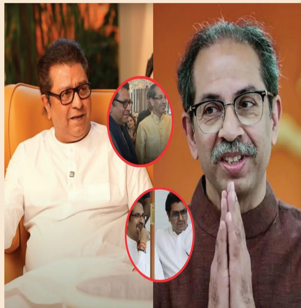
જાળવી રાખવામાં મદદ મળી, ખાસ કરીને મુંબઈમાં જ્યાં ૧૦ માંથી ૮ બેઠકો પર નજીકની સ્પર્ધા જોવા મળી. આ ૮ બેઠકો પર, મનસેએ એકનાથ શિંદેની શિવસેના પાસેથી મતો છીનવી લીધા અને તેનાથી ઉદ્ભવ ઠાકરેને મદદ મળી.

એ, તે ચાલો આપણે સમજવાનો પ્રયાસ કરીએ કે મહારાષ્ટ્રના રાજકારણમાં કેટલો બદલાવ આવશે. મહારાષ્ટ્ર વિધાનસભા ચૂંટણીમાં રાજ ઠાકરેના નેતૃત્વ હેઠળના મનસેનો દેખાવ નિરાશાજનક રહ્યો હતો. છેલ્લા દસ વર્ષમાં બરાબ પ્રદર્શન બાદ પાર્ટીને પુનરાગમનની આશા હતી પરંતુ તે તેના સૌથી નીચા સ્તરે પહોંચી ગઈ. ૨૦૦૬માં પાર્ટીની રચના થયા પછી ૨૦૨૪માં પહેલી વાર, પાર્ટીનો એક પણ ધારાસભ્ય મહારાષ્ટ્ર વિધાનસભામાં ચૂંટાઈ શક્યો નહીં, રાજ ઠાકરેનો પુત્ર પણ ચૂંટણી હારી ગયો. પાર્ટી એ રાજ્યભરમાં ૧૨૮ બેઠકો પર ચૂંટણી લડી હતી, જેમાંથી ૨૬ બેઠકો મુંબઈમાં હતી.