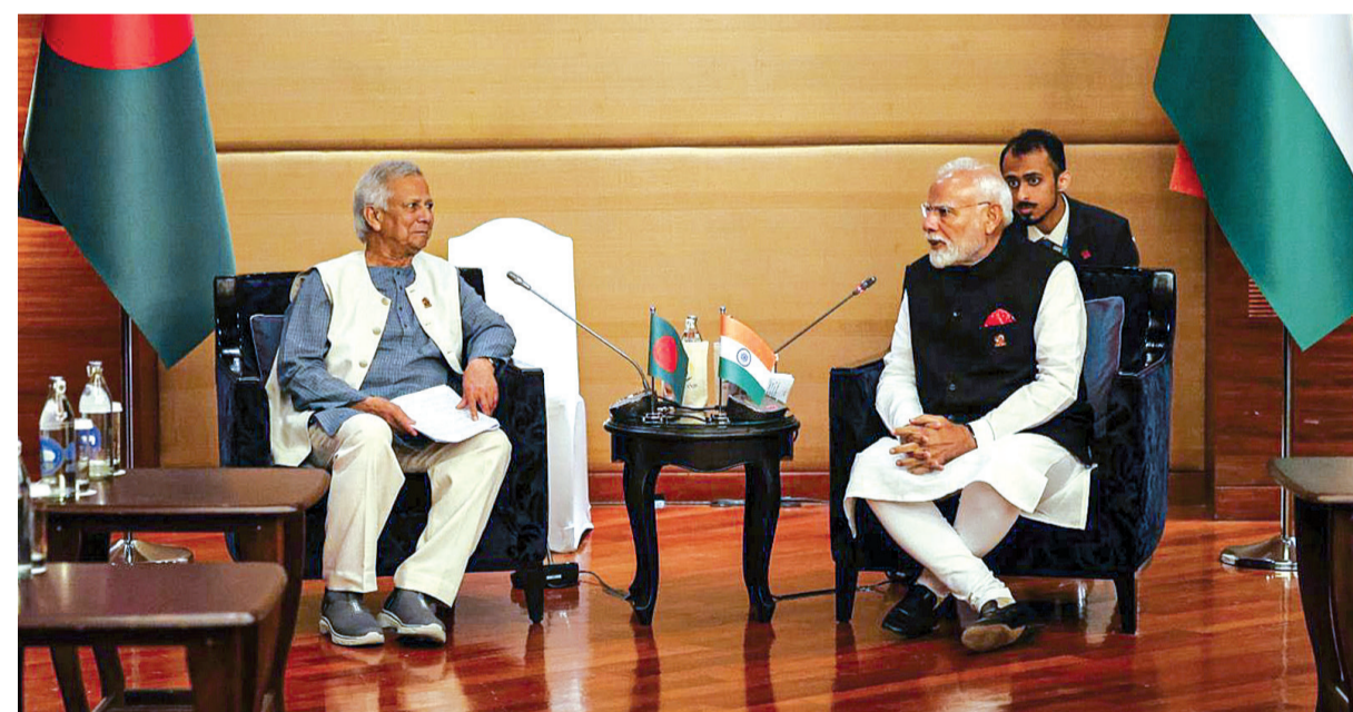
ભારત સરકારે સંસદમાં આપેલા જવાબ મુજબ, પાછલા બે મહિનામાં જ હિન્દુઓ પર ૭૬ હુમલા થયા હતા, જેમાં ૨૩ હિન્દુઓ માર્યા ગયા હતા. અન્ય ધાર્મિક લઘુમતીઓ પર પણ હુમલા ચાલુ છે. તાજેતરમાં, બાંગ્લાદેશના મુખ્ય સલાહકારે ભારતના ઉત્તર-પૂર્વીય રાજ્યો વિશે ખૂબ જ નિંદનીય અને નિરાશાજનક ટિપ્પણી કરી. બાંગ્લાદેશમાં ધાર્મિક લઘુમતીઓ પર થતા અત્યાચાર, માનવાધિકાર ઉલ્લંઘન અને ૧૯૭૧ના મુક્તિ યુદ્ધની યાદોને ભૂંસી