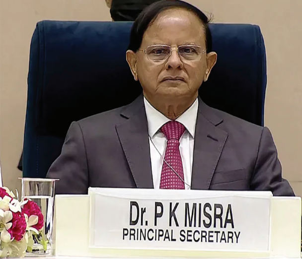
Dr. P. K. MISRA PRINCIPAL SECRETARY

નવીદિલ્હી, તા. ૨૦ પ્રધાનમંત્રીના મુખ્ય સચિવ પી કે મિશ્રાએ જણાવ્યું હતું કે ભારત વૈશ્વિક સ્તરે મજબૂત સ્થિતિમાં છે પરંતુ તેમણે વિશ્વ સામેના જટિલ પડકારોનો ઉદ્દેશ કર્યો છે, જેમાં વૈશ્વિક પુરવઠા શૃંખલાઓમાં વિક્ષેપો, સંરક્ષણવાદી નીતિઓ, વધતા ભૂ-રાજકીય તણાવ અને વૈશ્વિક વેપાર પેટર્નમાં ફેરફારનો સમાવેશ થાય છે. ઈઈપી સંબંધિત લાભ દીક્ષાંત સમારોહમાં બોલતા, મિશ્રાએ ભારતમાં વાર્ષિક ૮ થી ૧૦ મિલિયન નોકરીઓ બનાવવાની જરૂરિયાત પર પ્રકાશ પાડ્યો અને વિદ્યાર્થીઓને તકનીકી જ્ઞાન અને વ્યવહારુ કુશળતા બંનેથી સજ્ઞ થવા વિનંતી કરી. વાર્ષિક ૮ થી ૧૦ મિલિયન નોકરીઓ બનાવવાની જરૂર છે. તેથી, કેન્દ્ર સરકારે આ લક્ષ્યને પ્રાપ્ત કરવા માટે ડિજિટલ ઇન્ડિયા અને સ્કીલ ઇન્ડિયા જેવી પહેલ શરૂ કરી છે. “તમારે કૌશલ્યની સાથે સાથે ટેકનિકલ જ્ઞાનની પણ જરૂર છે,” તેમણે કહ્યું. આજે, ભારત વધતી જતી અર્થવ્યવસ્થા, યુવા વસ્તી અને વ્યૂહાત્મક ભાગીદારી સાથે એક મજબૂત વૈશ્વિક સ્થાન ધરાવે છે. દેશનો વધતો પ્રભાવ પ્રધાનમંત્રી દ્વારા કલ્પના કરાયેલ વિકસિત ભારતના લક્ષ્યને પ્રાપ્ત કરવામાં મદદ કરશે. ‘વર્તમાન ભૂરાજકીય અને આર્થિક સંદર્ભમાં તકો અને પડકારો’ વિષય પર બોલતા, મિશ્રાએ જણાવ્યું હતું કે ભારતનું ડિજિટલ ઇન્ફ્રાસ્ટ્રક્ચર દિવસેને દિવસે મજબૂત થઈ રહ્યું છે અને દેશમાં ૮,૦૦૦ મિલિયન ઇન્ટરનેટ વપરાશકર્તાઓ છે.