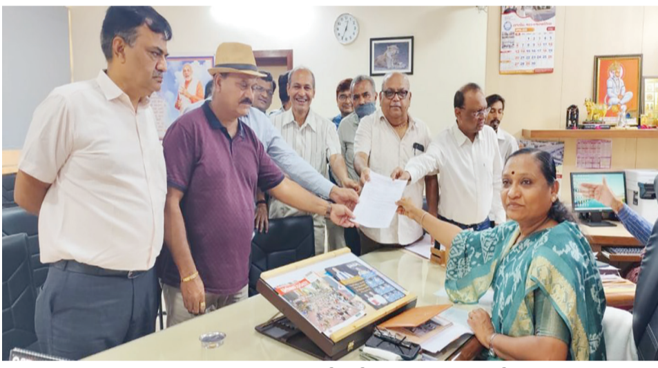
દ્વારા દબાણ કરવામાં આવ્યું છે અને આગળ ચા પાણી અને ગાંઠિયા બનાવી ૨૪ કલાક કામગીરી ચાલુ રહેતા કોમન જગ્યામાં દબાણ કરી લેવામાં આવ્યું છે. આ મામલે એકવાર નહીં અનેક વખત કેવા છતાં કોઈ

રાજકોટ, તા. ૨૧ રાજકોટ શહેરમાં દબાણોને લઈ ઘણા ખરા પ્રશ્નો ઊભા થઈ રહ્યા છે ત્યારે યુનિવર્સિટી રોડ ઉપર આવેલા સત્યમ શિવમ સુન્દરમ એટ પાર્ટમેન્ટના લોકો તેમના વિસ્તારમાં ખાણીપીણીના જે દબાણ થયેલા છે ને તેને દૂર કરવા માટે મનપાને અને ખાસતો મેયરને આવેદનપત્ર પાઠવવા આવી પહોંચ્યા હતા. મળતી માહિતી મુજબ તેઓ જણાવ્યું હતું કે તેમના એપાર્ટમેન્ટની આગળના ભાગમાં આવા જવા માટેનો રસ્તો છે જેની આગળ ખાવા પીવાની અનેક લારીઓ રાખી દેતા તેમની એન્ટ્રી બંધ થઈ ચૂકી છે અને દબાણ થઈ ગયેલું છે જેથી તે ફલેટમાં વસતા લોકોને આવવા જવામાં ઘણી તકલીફ પડે છે. એટલું જ નહીં તેઓએ માધવ યા નામની કેબિન પર આક્ષેપ લગાડ્યો હતો અને કહ્યું કે તમામ પાર્કિંગમાં તેમના