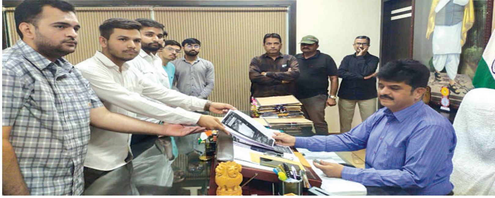
સૌરાષ્ટ્ર યુનિવર્સિટીની વિશ્વસનીયતા પર ફરી એક વખત લાગી “કાળી ટીલી”