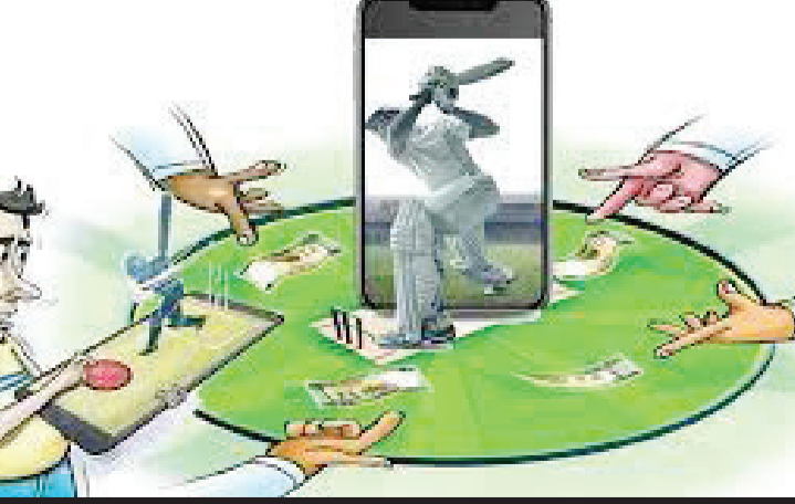
સહ્યાખોરી સદંતર બંધ થઈ ગઈ હોય તો તે સારી વાત, પણ આવુ થઈ શકે ખરું? એ સો મથાનો સવાલ

પણ રાજકોટનું નામ દેશ દુનિયામાં ગુંજતુ રહે છે. રનાઈપીએલની ફિક્કેટ લીગ શરૂ થઈ ત્યારથી લઈ આજ સુધીમાં રાજકોટ શહેર પોલીસે ગણ્યા ગાંઠ્યા આઈપીએલ સહ્યાના કેસ માંડ કર્યાં છે. તેમાં પણ કોઈ ક્વોલીટી કેસ જોવા મળ્યો નથી. એકલ દોઢલ મોબાઈલ એપ્લિકેશનથી સહો રમનારા જ મોટે ભાગે ઝપટમાં આવ્યા છે. મોટા જૂગારીઓ કાં તો ગામ મુકી ગયા છે અથવા તો પોલીસને તે ગોત્યા જડતાં નથી એવી ચર્ચા છે. સહ્યાખોરીના બજારમાં એવી પણ ચર્ચા છે કે બધુ પહેલેથી જ ગોટવાઈ ગયું હોઈ મસમોટા હવાલા સોદા પાડનારાઓનો વાળ વાંકો થઈ શકે તેમ નથી. પોલીસે સાવ સહ્યાખોરીના કેસ કર્યાં જ નહિ એવુ કોઈ કહી ન જાય એ માટે મોબાઈલ એપ્લિકેશન મોબાઈલ એપ પર આઈપીએલના મેચો પર સહો રમનારાઓને પકડી લેવામાં આવતાં હોય છે અને એકાદ નામ બીજુ ખોલાવી પોલીસ રાજી રહેતી હોય તેવી ભારે ચર્ચા છે. આ દરમિયાન શહેરમાં આઈપીએલના મેચો પર સહો રમતાં પન્ટરોને શોધી કાઢવા પીસીબી, ક્રાઇમ બ્રાંચ, જે તે ડીવીઝન કે એલસીબીની ટીમ સતત દરોડા પાડતી હોય છે. આ વચ્ચે શારદાબાગ