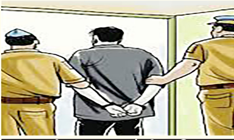
હત્યાની અન્ય ઘટનામાં ત્રીસ રૂપિયાના ભાડાના ડખ્ખામાં મુસાફરને રિક્ષાચાલકે રહેંસી નાંખ્યો: પોલીસે ભેદ ઉકેલી હત્યારાને દબોચ્યો

હત્યા નિપજાવનાર સેક્સ મેનિયાકને મધ્યપ્રદેશથી દબોચી લીધો હતો. બનાવના દિવસે આરોપીએ બંને વૃદ્ધા પાસે શરીરસુખની માંગણી કરી હતી. પરંતુ તેના તાબે ન થતાં પથ્થરોના ઘા મારી પંદર મિનિટના ગાળામાં બંનેની હત્યા નીપજાવી પોતાના વતન મધ્યપ્રદેશ ફરાર થઈ ગયો હતો. આરોપી પોતે ચાર દીકરાનો પિતા હોવાનું જાણવા મળ્યું છે. આરોપી યાંગોદરમાં આવેલી એક કંપનીમાં છેલ્લા ત્રણ મહિનાથી કામ કરતો હોવાનું જાણવા મળ્યું હતું.