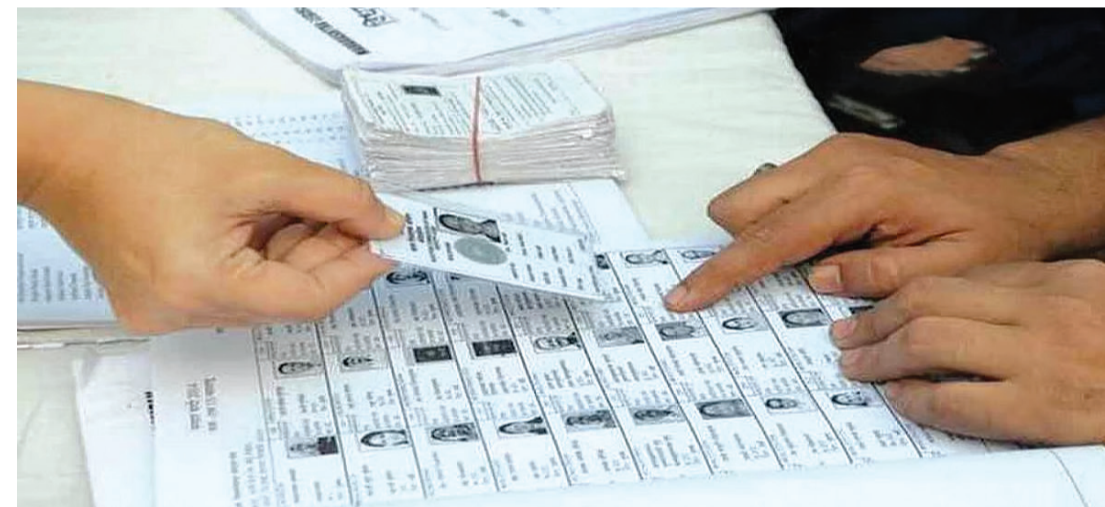
થતા સુધારા અને ફેરફાર માટે સહયોગ આપવામાં આવે છે. મતદાર યાદીમાં કરવામાં આવતા ફેરફારો સામે જરૂર જણાય ત્યાં કિસ્સાઓમાં લોકપ્રતિનિધિત્વ ધારો-૧૯૫૧ ની કલમ ૨૪ મુજબ જિલ્લા ચૂંટણી અધિકારી સમક્ષ પ્રથમ અપીલ કરી શકે છે.

સંશ્લિષ્ટ સુધારણા કાર્યક્રમો યોજવામાં આવે છે. જેમાં બુધ લેવલ ઓફિસર્સ અને મતદાર નોંધણી અધિકારીશ્રીઓ દ્વારા પૂરતી તપાસ બાદ લોકપ્રતિનિધિત્વ ધારો-૧૯૫૧ ની કલમ ૨૨ અને કલમ ૨૩ મુજબ મતદાર યાદીમાં નામ ઉમેરવા તથા કમી કરવા સહિતની કામગીરી હાથ ધરવામાં આવે છે. મતદાર નોંધણી પ્રક્રિયામાં રાજકીય પક્ષોની સહભાગીતા સુનિશ્ચિત થાય તે માટે મુખ્ય નિર્વાચન અધિકારીશ્રી દ્વારા રાજ્યમાં માન્યતા પ્રાપ્ત રાજકીય પક્ષોના સૌથી મોટી લોકશાહી વ્યવસ્થા જ નહીં પણ પારદર્શિતાનું પણ શ્રેષ્ઠ ઉદાહરણ છે. સતત થતા રહેતાં વસતી વિષયક ફેરફારોને અનુરૂપ થઈ ચૂંટણી વ્યવસ્થાની સૌથી પાયાની બાબત એવી મતદાર યાદી અદ્યતન અને ક્ષતિરહિત બને તે માટે ભારતના ચૂંટણી પંચ દ્વારા સમયાંતરે મતદાર યાદીની