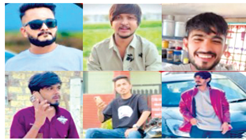
બાપલીયાવ, મારા વાલીડાવ હજુ પણ ચેતી જજો, આવા ધંધા બંધ કરી દેજો...પછી કે'તા નહિ કે અમે પકડાઈ ગ્યા!

રાજકોટ તા. ૨૨ રાજકોટમાં કે આસપાસમાં કલાણી ઢીકણી જગ્યાએ ચાલતા પંજાબી ચાઈનીઝના ધાબા, કાઠીયાવાડી ભોજનાલયો કે પછી બીજા વેપાર-ધંધાઓના સ્થળે પહોંચી તેમના વેપાર ધંધાની આગવી સ્ટાઈલમાં વિડીયો બનાવી જાહેરાત કરતાં સોશિયલ મિડીયા ઈન્ફલુએન્સર પોતાની આવડતથી નીતનવા વિડીયો બનાવી લોકોના વેપાર-ધંધામાં તેજ આવે તેવા પ્રયાસ કરે છે. આવા વિડીયો બનાવી પોતાની આઈડી પર વાયરલ કરવાના ચાઈ પણ તેઓ વસુલે છે અને સાચા રસ્તે કમાણી કરે છે. પરંતુ કેટલાક આવા ઈન્ફલુએન્સર જાહેરાતના નામે ઓનલાઈન જૂગારની એપનો પ્રચાર કરી તગડી કમાણી કરતાં હોવાનું ધ્યાને આવતાં શહેર સાયબર ક્રાઈમ પોલીસે ઝુંબેશ શરૂ કરી શરૂઆતમાં આવા બે ઈન્ફલુએન્સર સામે જૂગારધારાના બે ગુના નોંધી ધરપકડ કર્યા બાદ આવા વધુ છ જણાને પકડી જૂગારધારાનો ગુનો દાખલ કર્યો છે. ઈન્ફલુએન્સર તરીકે કામ કરતાં વધુ છ લોકોને જૂગારની લેબલ લાગી ગયાની કાર્યવાહીની વિગતો પર નજર કરીએ તો સાયબર ક્રાઈમ પોલીસે વધુ છ