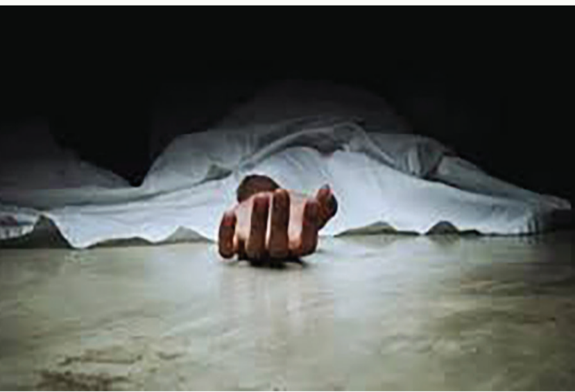
છઠ્ઠા બનાવમાં ૧ વર્ષની ઢબુકડી ગરમ પાણીમાં પડી જતાં જીવ ગયો: અરેરાટી