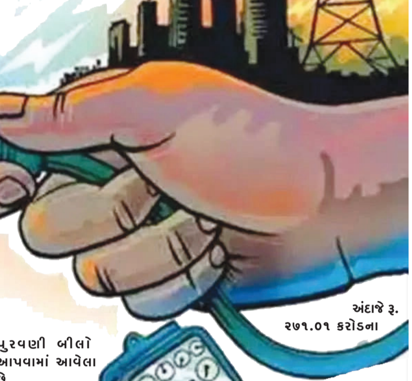
અંદાજે રૂ. ૨૭૧.૦૧ કરોડના પુરવણી બીલો આપવામાં આવેલા છે.

પશ્ચિમ ગુજરાત વીજ કોર્પોરેશન લિમિટેડ દ્વારા આ અંગે જાગૃતિ ઝુંબેશ પણ ચલાવવામાં આવી રહી છે. વધુને વધુ લોકો સોલાર ઉર્જા તરફ આગળ વધશે તો પાવર ચોરી કરવાનો વારો પણ નહીં આવે અને આ પ્રકારની જે જટિલ કાર્યવાહી કરવામાં આવતી હોય તે પણ નહીં થાય ત્યારે માત્ર લોકો વધુને વધુ સોલાર રૂફટોપ યોજના ની અમલવારી કરે તે ખૂબ જરૂરી છે. વિવિધ ટીમો દ્વારા એપ્રિલ-૨૦૨૪ થી માર્ચ-૨૦૨૫ માસ દરમિયાન સૌરાષ્ટ્ર-કચ્છમાં વીજ ચેકિંગ દરમિયાન કુલ ૪,૭૪,૩૪૭ વીજ જોડાણોની ચકાસણી કરવામાં આવેલી જેમાંથી કુલ ૬૩, ૧૯૮ કનેક્શનમાં ગેરરીતિ ઝડપાઈ હતી અને