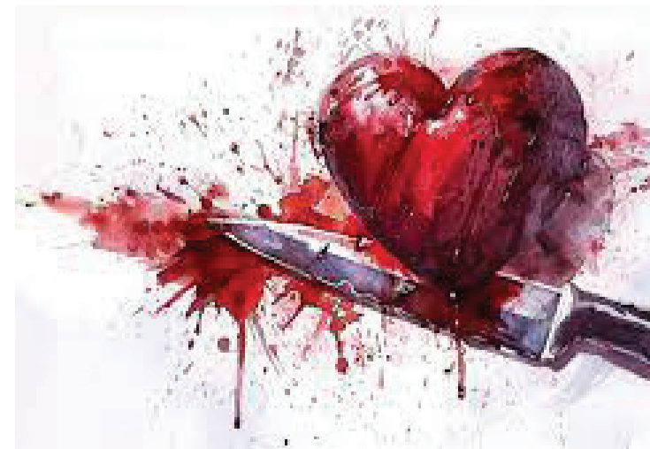
સોશિયલ મિડીયાથી પ્રેમ થયા બાદ લવમેરેજ કરનાર રાજકોટની યુવતિ માટે થોડા દિવસમાં જ પતિ બની ગયો ત્રાસરૂપ : લાલબત્તી સમાન ઘટના

રાજકોટ તા. ૨૬ અઢી અક્ષરના પ્રેમ પાછળ કેટલાયની જિંદગી ફના થઈ ગઈ છે. પ્રેમપ્રકરણમાં મારામારી, આત્મહત્યા, હત્યા સહિતની ઘટનાઓ બનતી રહે છે. હજુ પરમ દિવસે જ કચ્છ ભુજ પંથકમાં પ્રેમિકા સાથે માથાકુટ થતાં પ્રેમીએ તેને મોતને ઘાટ ઉતારી દીધા બાદ ચેણીનું મોત ખેંચ આવવાથી થયાની સ્ટોરી ઉભી કરી હતી. પરંતુ પોલીસ તપાસમાં ભેદ ઉકેલાઈ જતાં હત્યારા પ્રેમી જેલભેગો થયો હતો. આવી જ વધુ એક ઘટના સામે આવી છે જેમાં એક યુવતીની હત્યાનું રહસ્ય ખુલવા સાથે ચોંકાવનારી વિગતો ખુલી છે. આ યુવતીને તેના જ પ્રેમીએ મોતને ઘાટ ઉતારી લાશ ફેંકી દીધી હતી. સતત બ્લેકમેઈલિંગથી કંટાળી જતાં હત્યા કરી નાંખ્યાનું પ્રેમીએ પોલીસ સમક્ષ જણાવતાં પોલીસે પણ ચોંકી ગઈ હતી. બીજી એક પ્રેમિકાની મા સોશિયલ મિડીયાથી સંપર્ક થયા બાદ માવતરની ઈચ્છા વિરુદ્ધ લવમેરેજ કરનાર રાજકોટની યુવતિ માટે થોડા સમયમાં પતિ ત્રાસરૂપ બની જતાં સંસ્થા પાસે મદદ માંગવી પડી હતી. હત્યાની ઘટના વિશે જોઈએ તો કરજણના જુના ઓ વર ત્રિજ પાસે આવેલી વલીનગરીમાં રહેતી પરિણીતાની હત્યા કરવામાં આવી હતી. જે ગુનાની તપાસ દરમિયાન એવી વિગતો બહાર આવી છે કે પરિણીતા દ્વારા પ્રેમીને બ્લેકમેઈલ કરીને રૂપિયાની માંગણી કરવામાં આવતો હતો. પરિણીતાના ત્રાસથી કંટાળીને પ્રેમીએ જ તેની હત્યા કરી લાશ ફેંકી દીધી હતી. કરજણ પોલીસે ગુનો ડિટેક્ટ કરી પ્રેમી અને તેના સાગરીતને બિહારથી ઝડપી પાડ્યા છે. કરજણ જુનાબજાર વિસ્તારમાં આવેલ વલીનગરીમાં ભાડાના મકાનમાં છેલ્લા ચારેક મહિનાથી મોહમ્મદઆરીફખાન ફતેહમોહમ્મદખાન કે જે મુળ નેવાદા મુસ્તરકાથાણા જઈવારા તા. લાલગંજ જી. પ્રતાપગઢ