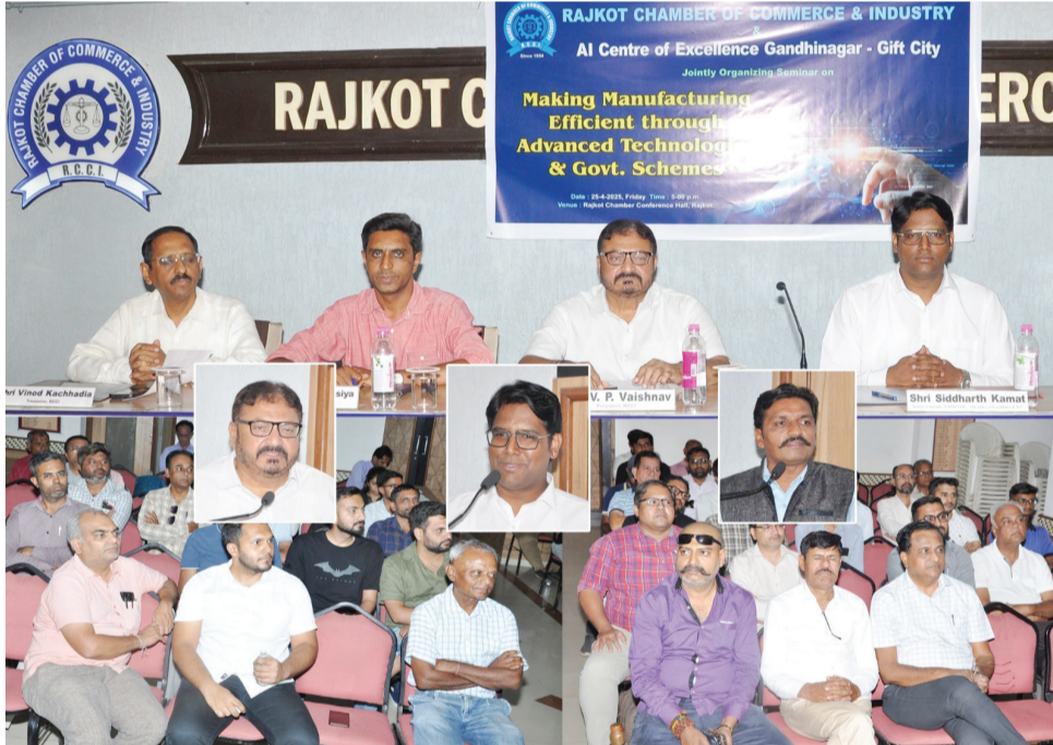
રાજકોટ, તા. ૨૬ રાજકોટ ચેમ્બર ઓફ કોમર્સ એન્ડ ઈન્ડસ્ટ્રીઝ તથા AI સેન્ટર ઓફ એક્સલન્સ ગાંધીનગરના સંયુક્ત ઉપક્રમે 'મેકિંગ મેન્યુફેક્ચરિંગ ઈફેક્ટિવ ઓ ડવાન્સ ટેકનોલોજીસ' અંગે સેમીનાર યોજાયો હતો.

રાજકોટએ ઉદ્યોગ જગતનું હબ ગણાય છે તેમજ દેશ તથા રાજ્યના સર્વાંગી વિકાસમાં મહત્વનો સિંહફાળો આપી રહ્યો છે. તેમજ સરકાર દ્વારા MSME ઉદ્યોગને ખુબ જ પ્રોત્સાહન આપવામાં આવી રહી હોય ત્યારે આવનારા દિવસોમાં નવીનતમ ટેકનોલોજી ઉદ્યોગોના વિકાસને વેગવંતુ બનાવવામાં ખુબ જ મદદરૂપ થઈ શકશે. સેમીનારના મુખ્ય વક્તા AI સેન્ટર ઓફ એક્સલન્સ ઈન્ટેલિજન્સ (AI), એનાલીટીક્સ અને ઈન્ટરનેટ ઓફ થિંગ્સ (IoT) જેવી આધુનિક ટેકનોલોજી આધારિત સ્માર્ટ સોલ્યુશન અપનાવવાને ઉદ્યોગોની કાર્યક્ષમતામાં નોંધપાત્ર વધારો કરી શકે છે. ખાસ કરીને પેપર ટુ ડિજીટલ સોલ્યુશન, પેપર પર લખવામાં આવતા ઓપરેશનલ રેકોર્ડ્સને ડિજીટલ ફોર્મેટમાં રૂપાંતરીત કરી શોપફલોરના મુખ્ય પાસાઓને (KPI) ડેશબોર્ડ પર રીઅલ ટાઈમ મોનીટરીંગ દર્શાવે છે, IoT આધારિત મશીનરી મોનીટરીંગ જે સેન્ટર અને ગેટવે ડિવાઈસની મદદથી મશીનના આઉટપુટને ટ્રેક કરે છે અને ડાઉનટાઈમ ઘટાડે છે, બારકોડ અને ચઇ કોડનો ઉપયોગ કરીને ઉત્પાદકોને કાર્યો માલ, વર્ક-ઈન-પ્રોગ્રેસ (WIP) અને તૈયાર પ્રોડક્ટ્સની ક્વાલિટીને શોપફલોર પર સરળતાથી ટ્રેક કરી શકે છે, વચ્ચે અલ રિયલિટી આધારિત ૩D પ્લાન્ટ વ્યુ-ટુર બેઠેલા ગ્રાહકોને ઉમાદન ક્ષમતા સમજવામાં તેમજ કર્મચારીઓની ટેનીંગમાં પણ મદદરૂપ થાય છે, વિડીયો એનાલિટિક્સનો ઉપયોગ કરીને ઉત્પાદકો કર્મચારીઓની કાર્યક્ષમતા મોનીટર કરી શકે છે તથા ઉત્પાદકોની ચોક્કસ ગુણવત્તી અને સુરક્ષા સંબંધિત નિયમોનું પાલન સુનિશ્ચિત કરી શકે છે જેવા વિવિધ મુદ્દાઓ ઉપર પાવર પોઈન્ટ પ્રેઝન્ટેશન દ્વારા માહિતિ આપવામાં આવેલ.