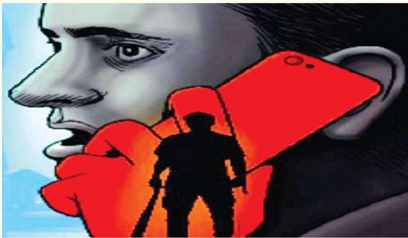
વિરૂધ્ધ એફઆઈઆર દાખલ કરી તપાસ હાથ જણાવ્યું છે કે હું પરિવાર સાથે રહે છું અને રિશાના હુડ બનાવવાની મજૂરી કરુ છું. હું ગત તા. ૧૩/૨/૨૫ના રોજ મેટોડા જીઆઈડીસી