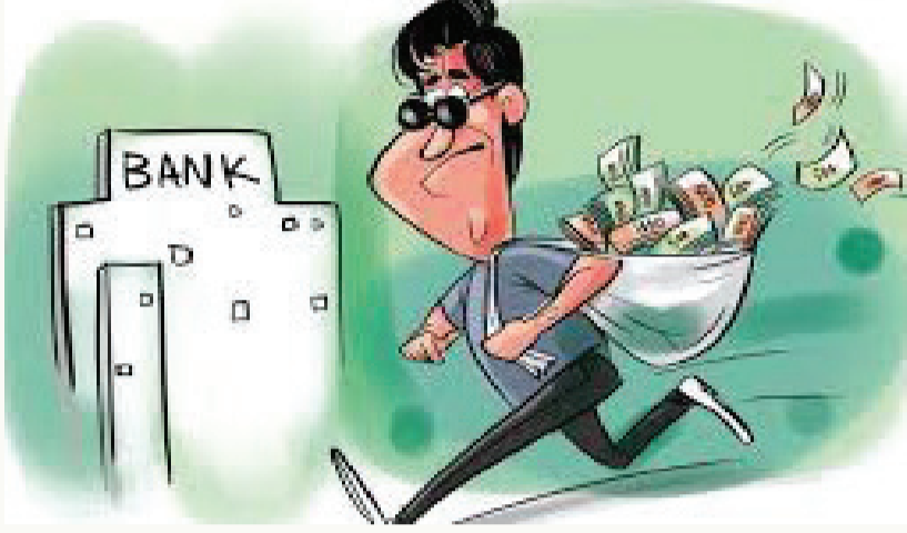
લાખની છેતરપીંડી આચરી છે. નોકરીના એક આપી બેન્કના સ્ટેમ્પનો ખોટી રીતે ઉપયોગ ખાસ ગાળામાં તેણે ખાતેદારોના નાણા નહીં કરી બનાવટી એફડીઆર સર્ટીફિકેટ બનાવ્યાં હતાં.