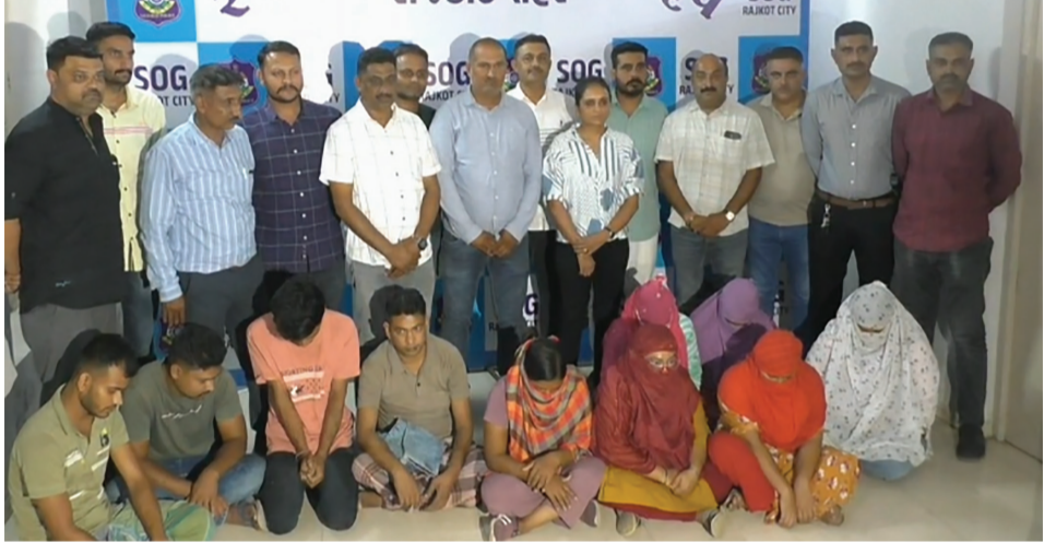
પાર્શ્વરાજસિંહ ગોહિલે જણાવ્યું હતું કે, તેઓ બાંગ્લાદેશ બોર્ડરથી ભારતમાં ઘૂસણખોરી કરેલી છે અને વિવિધ જગ્યાઓ પર રહીને તેઓ મજૂરી કામ કરે છે આ ઝુંબેશ આવનારા દિવસોમાં પણ યથાવત રીતે ચાલુ રાખવામાં આવશે તેમાં કોઈ શંકાને સ્થાન નથી સાથોસાથ તેઓએ લોકોને પણ અપીલ કરી હતી કે આ પ્રકારના કોઈપણ

એસઓએ ૧૦ લોકો શંકાસ્પદ લાગ્યા હતા અને તેમની પૂછપરછ કરતા માલુમ પડ્યું હતું કે તેઓ ગેરકાયદેસર રીતે રાજકોટમાં રહેતા હતા. સીટી પોલીસ દ્વારા ૮૦૦ થી વધુ લોકોનું ચેકિંગ કરવામાં આવ્યું હતું જેમાંથી આ તમામ લોકો પશ્ચિમ બંગાળમાંથી રાજકોટ આવ્યા હતા અને હવે આવનારા દિવસોમાં તેઓને ડિપોર્ટ પણ કરવામાં આવશે. આ પ્રસંગે ડીપીઓ ગોહિલે પત્રકાર પરિષદ સંબોધી હતી અને જણાવ્યું હતું કે અત્યારે જે પ્રશ્નો વિભાગ થયા છે તેના કારણે હાલ રાજ્યના ગૃહ વિભાગ માંથી વિશેષ ડ્રાઈવ યોજવા નો આદેશ મળ્યો છે જેના ભાગરૂપે હાલ સમગ્ર શહેરમાં આ ઝુંબેશ ચલાવવામાં આવી ૮૦૦ માંથી હાલ ૧૦ લોકોને ઓળખી પાડવામાં આવ્યા છે અને આવનારા દિવસોમાં હજુ વધુ લોકો જે ગેરકાયદે ઘોષણાઓ કરી લીધે તેઓને પણ પકડી પાડવામાં આવશે. વધુમાં