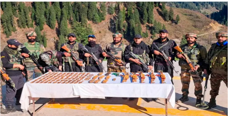
ઠેકાણા શોધી કાઢવામાં આવ્યા હતા અને તેનો આવેલા હથિયારોમાં ૫ AK-૪૭ રાઈફલ, નાશ કરવામાં આવ્યો હતો. અહીંથી મળી ૮ AK-૪૭ મેગેઝિન, એક પિસ્તોલ, એક

નવીદિલ્હી, તા. ૨૬ જમ્મુ અને કાશ્મીરના પહેલગામમાં થયેલા આતંકવાદી હુમલા બાદ ભારતીય સેના દ્વારા કાર્યવાહી શરૂ કરી દેવામાં આવી હતી. તેમાં કુપવાડા જિલ્લામાં સેના દ્વારા શનિવારે આતંકવાદી ઠેકાણાને તોડી પાડવામાં આવ્યા હતા. આ દરમિયાન ભારતીય સેનાએ મોટી માત્રામાં હથિયારો અને દાડગોળાનો જથ્થો જમ કર્યો છે. આ મામલે વિગતો આપતા એક પોલીસ અધિકારીએ જણાવ્યું હતું કે, ગૃમ માહિતીના આધારે આ કાર્યવાહી કરવામાં આવી હતી. ભારતીય સેના દ્વારા ઉત્તર કાશ્મીરના મુસ્તકાબાદ માછીલાના સેદોરીના જંગલો વિસ્તારમાં સર્ચ ઓપરેશન શરૂ કરવામાં આવ્યું હતું. ઓપરેશન દરમિયાન આતંકવાદીઓના