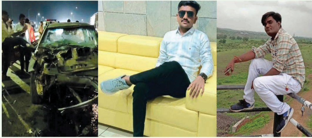
૭૪૫૧માં બેસી વાંકાનેર ટોલનાકે આવેલા વ્હાઈટ હાઉસ નામના કારખાનેથી રાજકોટના સાત હનુમાન પાસે આવેલા મામા સાહેબના મંદિરે યોજાયેલા માતાજીના માંડવામાં જવા નીકળ્યા હતાં. ચારેય મિત્રો રાતે સાડા દસેક વાગ્યે બધા કુચીયાદળ નજીક બ્રીજ ચડતાં હતાં ત્યાં જ આગળ ડમ્પર જતું હોઈ તેને ઓવરટેકઈ કરવા જતાં ડમ્પર ચાલકે કોઈપણ પ્રકારની સાડ આપવા વગર સિગ્નલ બતાવ્યા વગર જે ટ્રક પર હતી તે ટ્રેક પર પોતાનું ડમ્પર લઈ અચાનક બ્રેક મારતાં ડમ્પર પાછળ કાર ઘડાકાભેર અથડાઈ પડી હતી. એ સાથે

રાજકોટ તા. ૨૯ જિંદગી તો બેવડા હે એક દિન કુકરાયેગી, મોત મહેબુબા હૈ અપને સાથ લેકર જાએગી...ફિલ્મના ગીતની આ પંક્તિ અનુસાર ઘણીવાર એવી ઘટના બની જતી હોય છે જે આ પંક્તિને અનુરૂપ હોય છે. એક કડ્ડણ બનાવમાં કારમાં બેસી ચાર મિત્રો વાંકાનેર ટોલનાકા નજીકની ફેક્ટરીથી રાજકોટ નવાગામ મામા સાહેબના મંદિરે માતાજીના માંડવામાં દર્શન કરવા જવા નીકળ્યા હતાં. પરંતુ કુચીયાદળ બ્રીજ પાસે ડમ્પર કાળ બનીને ટ્રાકટકું હતું. ડમ્પર પાછળ અથડાઈને કાર બૂકડો વળી જતાં બે મિત્રોના કમકમાટી ભયાં મોત થયા હતાં. જ્યારે બે મિત્રોનો ગંભીર ઈજા સાથે બચાવ થયો હતો. કડ્ડણ ઘટનાની વિગતો પર નજર કરીએ તો રાજકોટ-અમદાવાદ હાઈવે પર કુચીયાદળ ગામ પાસે બ્રીજ ઉપર