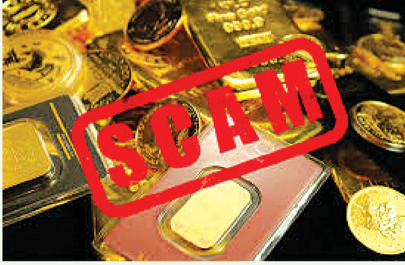
બસ્સો રૂપિયામાં ઓનલાઈન ટ્રેસ ખરીદવા જતાં યુવતિએ અડધો લાખ ગુમાવી દીધા!