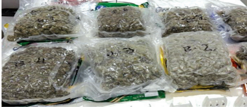
અમદાવાદ, તા. ૨૯ ચોક્કસ માત્રામાં આધારે કાર્યવાહી કરતાં ડીઆરઆઈના અધિકારીઓએ અમદાવાદ કસ્ટમ્સના સહયોગથી બેંગલોકથી આવી રહેલા ચાર ભારતીય નાગરિકોને અટકાવ્યા હતા. તેમની છ ટ્રોલી બેગના નિરીક્ષણ દરમિયાન, અધિકારીઓને રિટ્ઝ અને ચીટલ્સ જેવી બ્રાન્ડેડ ખાદ્ય ચીજોમાં હોશિયારીથી છુપાવવામાં આવેલા લીલા, ગદ્દા જેવા પદાર્થના પેકેટો મળી આવ્યા હતા. રાસાયણિક વિશ્લેષણમાં આ પદાર્થ

અમદાવાદ એરપોર્ટ પરથી ચારની ઘરપકડ : ૧૦ દિવસની અંદર બીજી મોટી સફળતા, કુલ જથ્થો ૫૫ કિલોગ્રામ