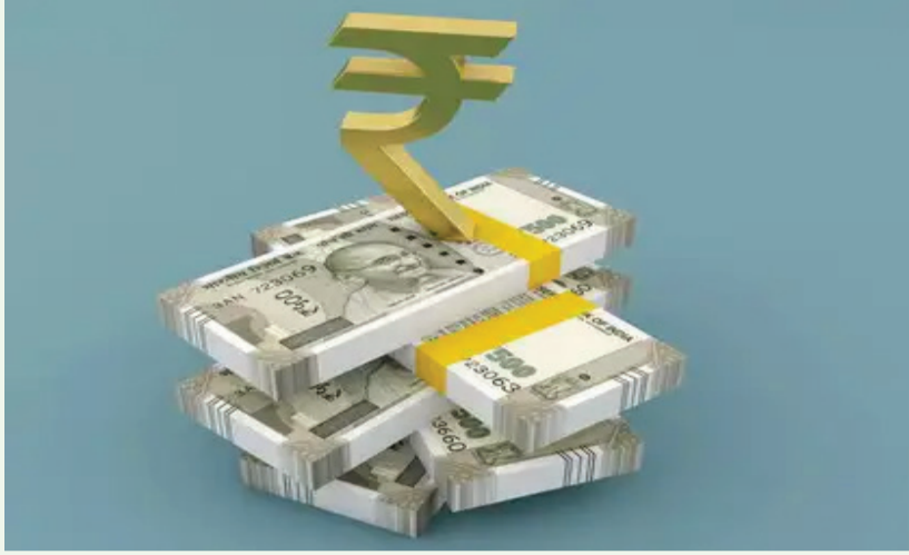
મિત્ર અમદાવાદ પહોંચ્યા ત્યારે આરોપીઓએ ફરિયાદીને માંડવી બોલાવ્યા બાદ ભુજ બોલાવી કસ્ટમ અને પોર્ટના કામમાં રોકાયેલા હોવાનું કહી ગાંધીનગરમાં આવેલી ઓફિસ પર મુલાકાત કરી

પરંતુ ફરિયાદીએ ન્યુ દિલ્હી અથવા અમદાવાદમાં મીટિંગ કરવાનું કહેતા અંતે એકવીસમી જાન્યુઆરીના અમદાવાદ ખાતે મીટિંગ કરવાનું નક્કી થયું હતું. પરંતુ ફરિયાદી અને તેનો