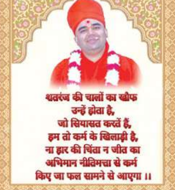
શતરંજ કી ચાલોં કા ચીફ ઉઠેં હોવા હૈ, જો સિયાસત કરવેં હૈ, હમ તો કર્મ ન ચીલાઈ હૈ, ના હુકમ કી ચિંતા ન જીતાઈ હૈ અભિમાન નીચિમત્તા સે કર્મ કિયુ જા ફાલ સમને સે આણ્યા ॥

અલકાઝાનો વડ નીચીની ગયો. હાજીકા કરનારા અલોપ થઈ ગયા. કોઈ ઓળખાણ કામ ન આવી. હવે માર ન મારવા ધોરાજી સમક્ષ આજીકા કરતો હતો. તહ્ફુર અને અલકાઝાનો જેમ વાલો લોકો હતામાં ઉડી રવા છે. આવા તત્વા ધજગર ત્યારે હિંદુશા કરવાની નેવડ પણ રહેતી નથી.