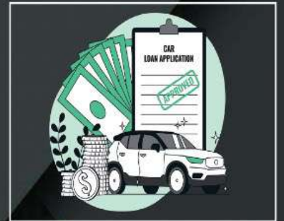
Loan & Insurance

nr. munjka chowk, opp. satadhar petrol pump, new ring road-2, Rajkot.