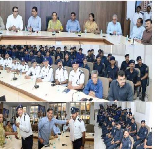
રાજકોટ, તા. ૯ રાજકોટ મહાનગરપાલિકાની ફાયર એન્ડ ઈમરજન્સી શાખાના કુલ-૧૧૬ અધિકારીઓ-કર્મચારીઓની બિરદાવી તેમણે સન્માનિત કરવાનો કાર્યક્રમ કરતાં સિદ્ધુ કલ્યાણ અને ખાલ ગ્રાંટે સંચાલિત યોજનાઓ અને અગ્નિશામક દળ સમિતિના વેરમેન કિલીપભાઈ લુણાગરિયાના અધ્યક્ષ તથાને કરવામાં આવ્યો હતો. જેમાં મહાનગરપાલિકાના સત્તાધીશો અને ટોચના અધિકારીઓ હાજર રવા હતા.

એટલાન્ટિસમાં આગની ઘટનાની ગણતરીની મિનિટોમાં જ ફાયર વિભાગની ટીમ તાકીદે પહોંચી અને મોટી દુર્ઘટના ટાળી : શહેરમાં ફાયર અંગે જાગૃતિ કેળવવામાં પણ વિભાગના કર્મચારીઓનો સિંહ ફાળો