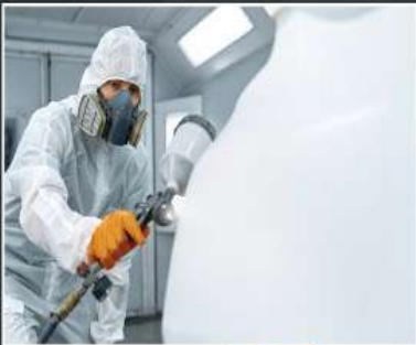
Full Body Paint & Modification