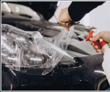
Paint Protection Film