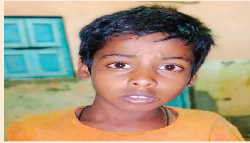
ઈન્સ્ટાગ્રામથી તેર વર્ષની સગીરાને ફેન્ડ બનાવી સગીર બગાડી ગયો: ગામો ગામ ડર્યા પછી પોલીસે શોધ્યા