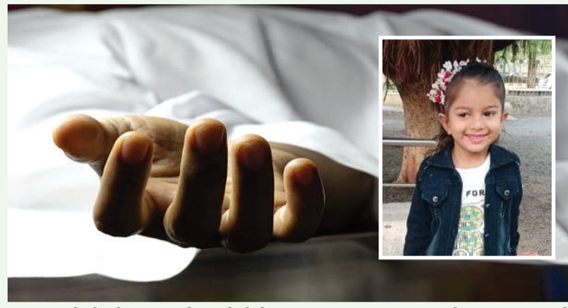
દિકરી યુવતીએ પોતાને પગમાં કાંટો લાગ્યો છે તેમ કહેતાં પિતાએ તપાસ કરી હતી. પણ આ નિશાન કોઈ જનાવર કરી ગયું હોય તેવું હોઈ તુરત જ સારવાર માટે ખસેડી હતી.