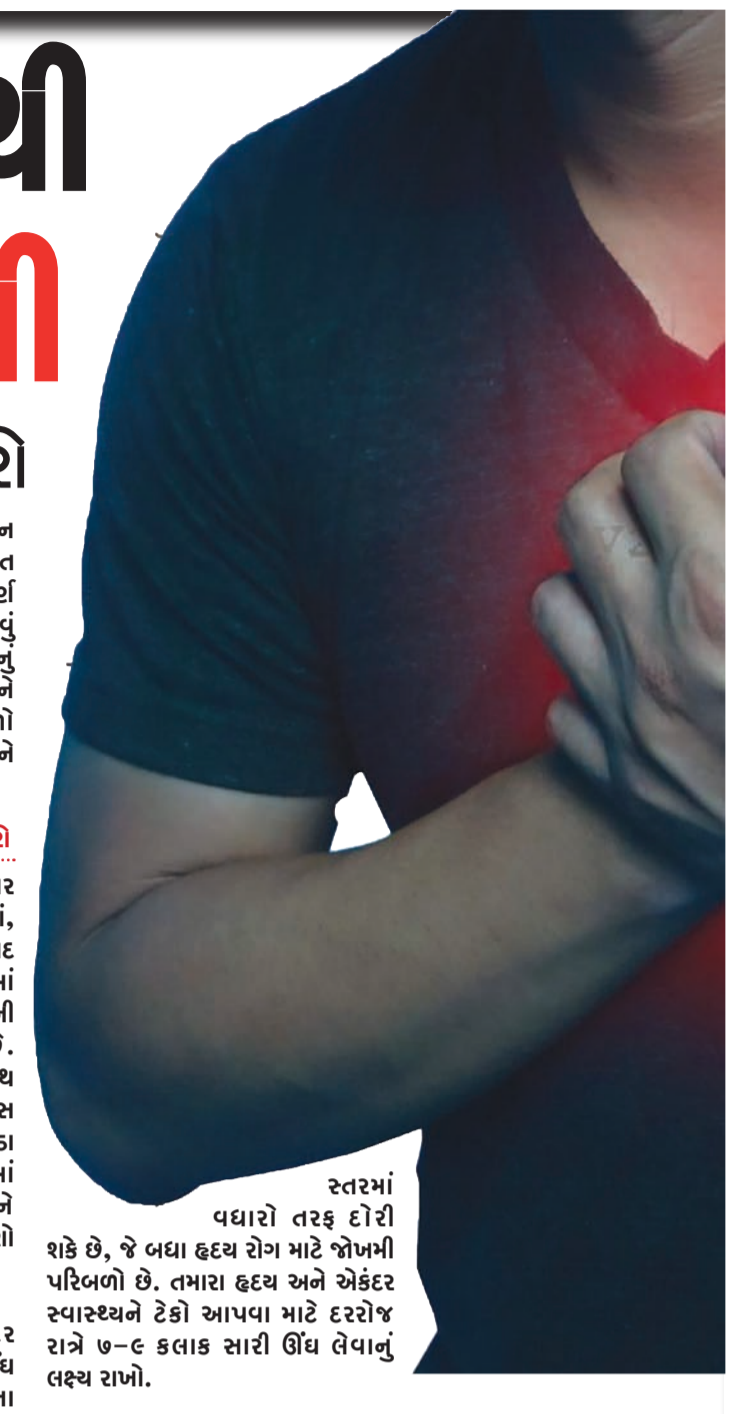
સ્તરમાં વધારો તરફ દોરી શકે છે, જે બધા હૃદય રોગ માટે જોખમી પરિબલો છે. તમારા હૃદય અને એકંદર સ્વાસ્થ્યને ટેકો આપવા માટે દરરોજ રાત્રે ૭-૯ કલાક સારી ઊંઘ લેવાનું લક્ષ્ય રાખો.

કારણોમાંનું એક છે. જો તમે ધૂમ્રપાન કરો છો, તો તમારા હૃદયને સુરક્ષિત રાખવા માટે તમે જે સૌથી મહત્વપૂર્ણ પગલાં લઈ શકો છો તેમાંનું એક છોડવું છે. વધુમાં, વધુ પડતું આલ્કોહોલનું સેવન બ્લડ પ્રેશર વધારી શકે છે અને હૃદય સંબંધિત સમસ્યાઓમાં ફાળો આપી શકે છે. તમારા ડાઝના સેવનને ભલામણ કરેલ મર્યાદામાં રાખો. તણાવનું અસરકારક રીતે સંચાલન કરો કોનિક તણાવ તમારા હૃદય પર ખરાબ અસર કરી શકે છે. સમય જતાં, આ હાઈ બ્લડ પ્રેશર, બિનઆરોગ્યપ્રદ ખાવાની આદતો અને નબળી ઊંઘમાં ફાળો આપી શકે છે, જે બધા હૃદયની નિષ્ફળતાનું જોખમ વધારી શકે છે. તણાવનું સંચાલન કરવા માટે સ્વસ્થ રીતો શોધો, જેમ કે: માર્બલકુલનેસ અથવા ધ્યાનનો અભ્યાસ કરવો, ઊંડા સ્વાસ લેવા જેવી આરામ તકનીકોમાં જોડાવું, તમારા મનપસંદ શોખને અનુસરવા, મજબૂત સામાજિક જોડાણો જાળવવા. પૂરતી ઊંઘ લો હૃદયના સ્વાસ્થ્ય સહિત એકંદર સ્વાસ્થ્ય માટે ઊંઘ જરૂરી છે. ઓછી ઊંઘ બ્લડ પ્રેશર, બળતરા અને તણાવના