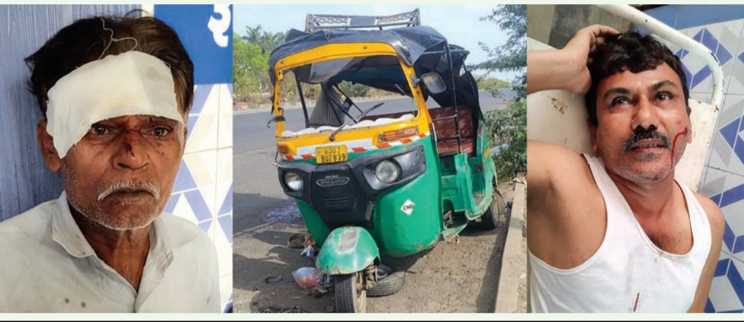
ગ્રીનલેન્ડ ચોકડીથી ગોંડલ રોડ ચોકડીએ જઈ રહેલી રિક્ષાને પાછળથી કારચાલક ઉલાળીને ભાગી ગયો

ત્યાંથી ગોંડલ રોડ ચોકડીએ જવા આ રિક્ષામાં બેઠો હતો. પાછળથી આવેલી કાર કાળ બનીને ત્રાટકી હતી અને આ યુવાન માતાની મૈથતમાં પહોંચે એ પહેલા મોતને ભેટી ગયો હતો. અરેરાટી ઉપજાવતા આ કડ્ડા બનાવની વિગતો પર નજર કરીએ તો સવારે છએક વાગ્યે જીએઓ3બીયુ-૭૮૩૯ નંબરની રિક્ષાનો ચાલક ગ્રીનલેન્ડ ચોકડીએથી મુસાફરોને બેસાડીને ગોંડલ રોડ ચોકડી તરફ જવા રવાના થયો ત્યારે માર્કેટ ચાર્ડ પૂલથી આજોમ ચોકડી તરફ જતાં રસ્તે અચાનક પાછળથી બંધાટ ઝડપે એક કાર આવી હતી અને રિક્ષાને ઉલાળીને ભાગી ગઈ હતી. જોરદાર ટક્કર લાગતાં રિક્ષા ગોથા મારી ગઈ હતી. અંદર બેઠેલા મુસાફરો પૈકી એક યુવાનનું ઘટના સ્થળે જ કમકમાટી ભર્યું મોત થયું હતું. જ્યારે ત્રણેક મુસાફરોને ઈજાઓ થઈ હતી. આ બનાવને પગલે ઘાયલ થયેલા લોકોમાં ઠેકારો મચી ગયો હતો. લોકોના ટોળા ભેગા થઈ ગયા હતાં.