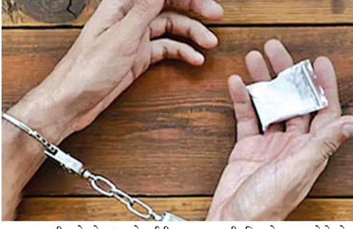
દ્વારા જાણકારી મળે તે વધુ સહેલાઈથી આપનારની વિગતો ગુપ્ત રહેશે તેમ તેઓના નેટવર્ક સુધી પહોંચી શકાય, આશ્વસ્ત કરી લોકોને નિર્ભીકપણે ૧૯૩૩ હેલ્પલાઈન નંબર કે કેન્દ્ર