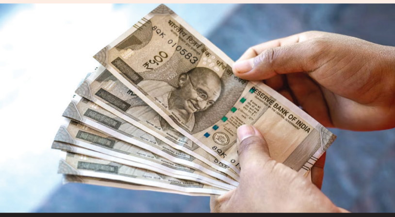
વેપારીએ પલ્ટમાં ઓનલાઈન બૂટ લીધા, ટુંકા પડતાં પાછા મોકવાના પ્રયાસમાં ખાતામાંથી ઉપડી ગયા ૯૫ હજાર!