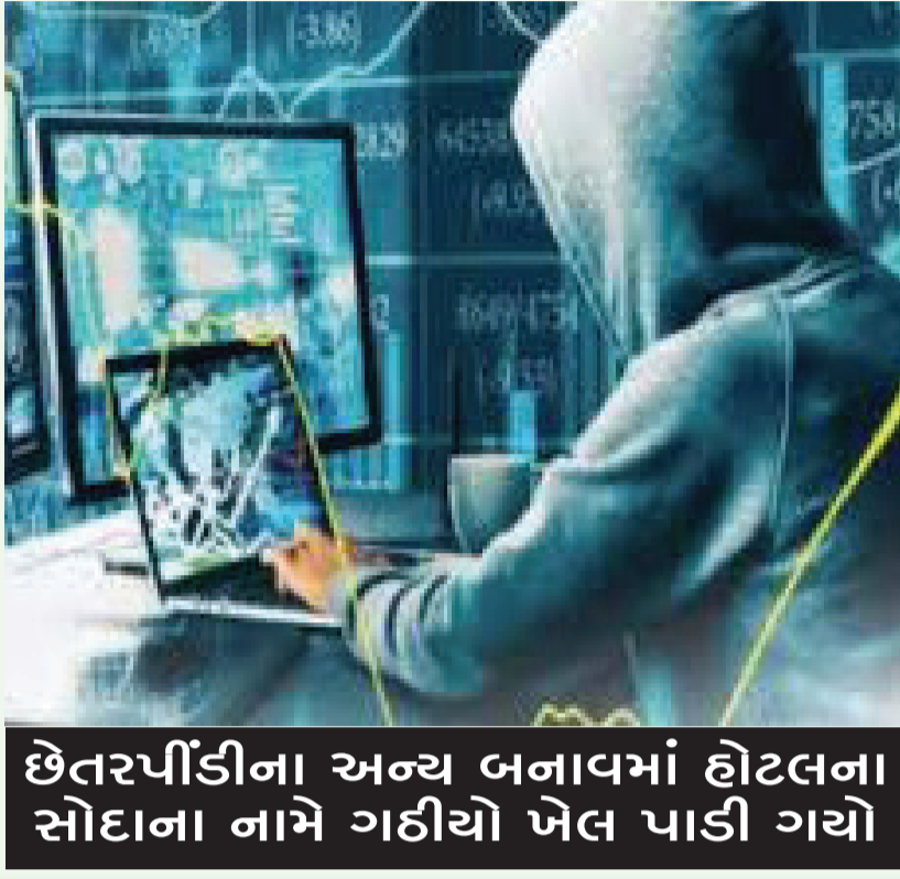
છેતરપીંડીના અન્ય બનાવમાં હોટલના સોદાના નામે ગઈયો ખેલ પાડી ગયો