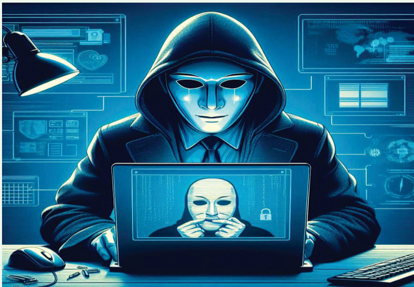
અન્ય બનાવમાં વૃદ્ધના નામે દસથી વધુ કેડીટ કાર્ડ લઈ પરિચીતે જ કરી સાડત્રીસ લાખની ઠગાઈ પાંચ બંગાળી કારીગરોનો સોનીને ચુનો: સોળ લાખનું સોનું લઈ રુક્યક્કર થઈ ગયા