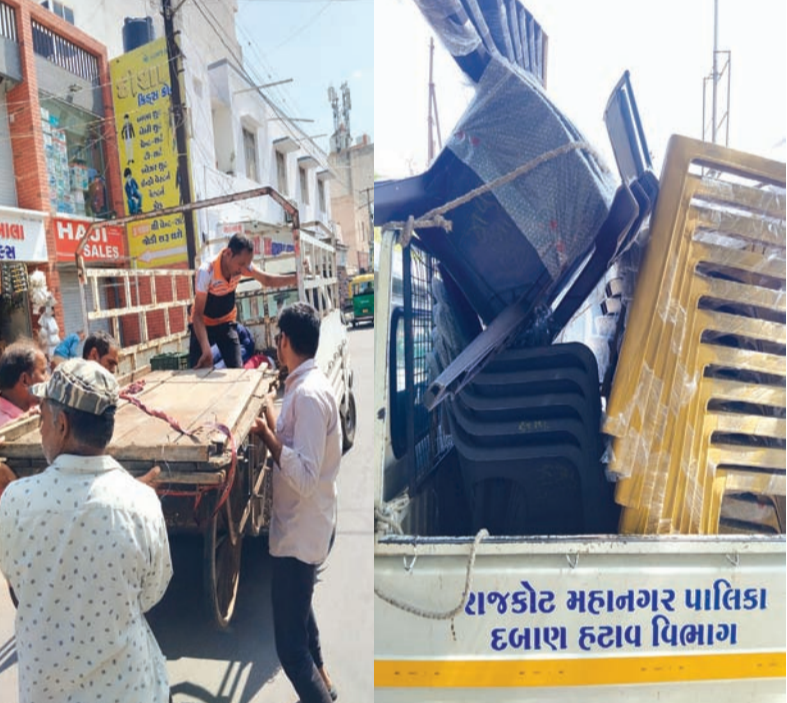
રાજકોટ મહાનગર પાલિકા દબાણ હટાવ વિભાગ

રાજકોટ, તા. ૧૬ રાજ્ય સરકારના માનવું છે કે રાજ્યમાં એક પણ પ્રકારે દબાણ ન હોવું જોઈએ જેને લઈને જિલ્લામાં ખાસ આદેશ પણ પ્રસિદ્ધ કરી દેવામાં આવ્યા છે પરંતુ રાજકોટની જો વાત કરવામાં આવે તો મહાનગરપાલિકાની દબાણ હટાવ શાખા દ્વારા છેલ્લા ૧૫ દિવસમાં જે કામગીરી કરવામાં આવી તે અત્યંત યુક્તિ આધારિત છે કારણ કે ૧૭૬૮ જેટલા બોર્ડ બેનરોને ઉતારી લેવામાં આવ્યા છે. સાંપ્રત પરિસ્થિતિ એ છે કે આજે વિભાગ દ્વારા જો કોઈ કામગીરી કરવામાં આવે તો તે જ જગ્યા ઉપર યોગ્ય સમય પછી ફરી દબાણ કરી લેવામાં આવતું હોય છે પછી તે શાકભાજી વાળી લારી હોય કે ફળ ફૂટ વાળી લારી. આના માટે મહાનગરપાલિકાએ ગંભીરતાપૂર્વક વિચાર કરવો ખૂબ જરૂરી છે. રાજકોટ મહાનગરપાલિકાની દબાણ હટાવ શાખા દ્વારા છેલ્લા ૧૫ દિવસમાં શહેરમાં જુદી જુદી જગ્યાએ જાહેર માર્ગો પર દબાણ રૂપ એવા રેકડી-કેબીન, અન્ય ચીજવસ્તુઓ, શાકભાજી-ફળો જમી તેમજ પશુઓને આપવામાં આવતું લીફ્ટ, બોર્ડ-બેનરો વગેરે જમ કરવાની કામગીરી કરવામાં આવી હતી.