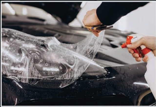
Paint Protection Film