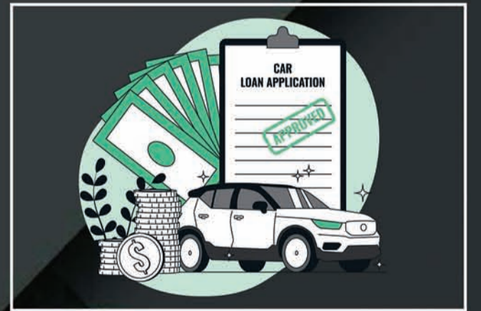
Loan & Insurance