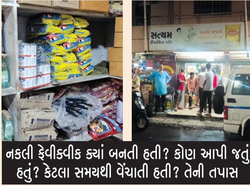
નકલી ફેવીકવીક ક્યાં બનતી હતી? કોણ આપી જતું હતું? કેટલા સમયથી વેંચાતી હતી? તેની તપાસ