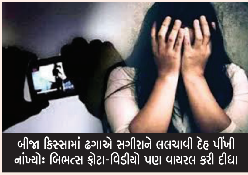
બીજા કિસ્સામાં ઢગાએ સગીરાને લલચાવી દેહ પીંખી નાંખ્યો: બિભત્સ ફોટા-વિડીયો પણ વાયરલ કરી દીધા