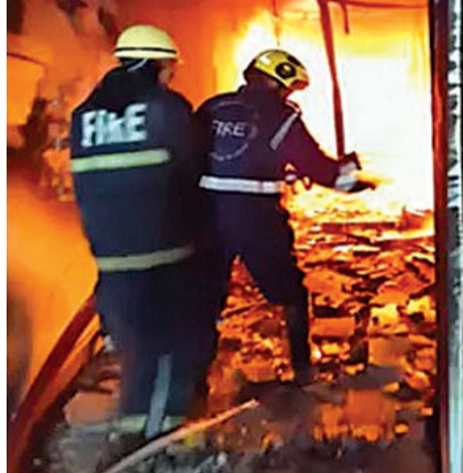
સ્કાયલિફ્ટ, ૩ વોટર ટેન્કર અને એક ફાયર કાર્ટઈંગ રોબોટની પણ મદદ લેવામાં આવી હતી.

નવીદિલ્હી, તા. ૧૮ હેદરાબાદના ઐતિહાસિક ચારમીનાર નજીક ગુલઝાર હોમ વિસ્તારમાં શનિવારે સવારે ભીષણ આગ લાગતાં ભારે તબાહી મચી ગઈ હતી. રહેણાંક અને વાણિજ્યિક ઉપયોગ ધરાવતી એક ઈમારતમાં આગ લાગવાથી ઓછામાં ઓછા ૧૭ લોકો માર્યા ગયા અને ૧૦ થી વધુ લોકો ઘાયલ થયા. મૃતકોમાં ઓછામાં ઓછા આઠ બાળકો અને પાંચ મહિલાઓનો પણ સમાવેશ થાય છે. આ અકસ્માતને તાજેતરના વર્ષોમાં હેદરાબાદમાં બનેલી સૌથી મોટી દુર્ઘટનાઓમાંની એક માનવામાં આવે છે. શરૂઆતના અહેવાલો અનુસાર, આગ સવારે ૫:૩૦ વાગ્યાની આસપાસ લાગી હતી જ્યારે મોટાભાગના રહેવાસીઓ ગાઢ નિદ્રામાં હતા. આગ બિલ્ડિંગના ગ્રાઉન્ડ ફ્લોરના કોમર્શિયલ ભાગમાં આવેલી મોટીની દુકાનમાં શરૂ થઈ હતી અને ધુમાડો ઝડપથી આખી બિલ્ડિંગમાં ફેલાઈ ગયો હતો. ધુમાડાને કારણે શ્વાસ રૂંધાવાથી ઘણા લોકોના મોત થયા.