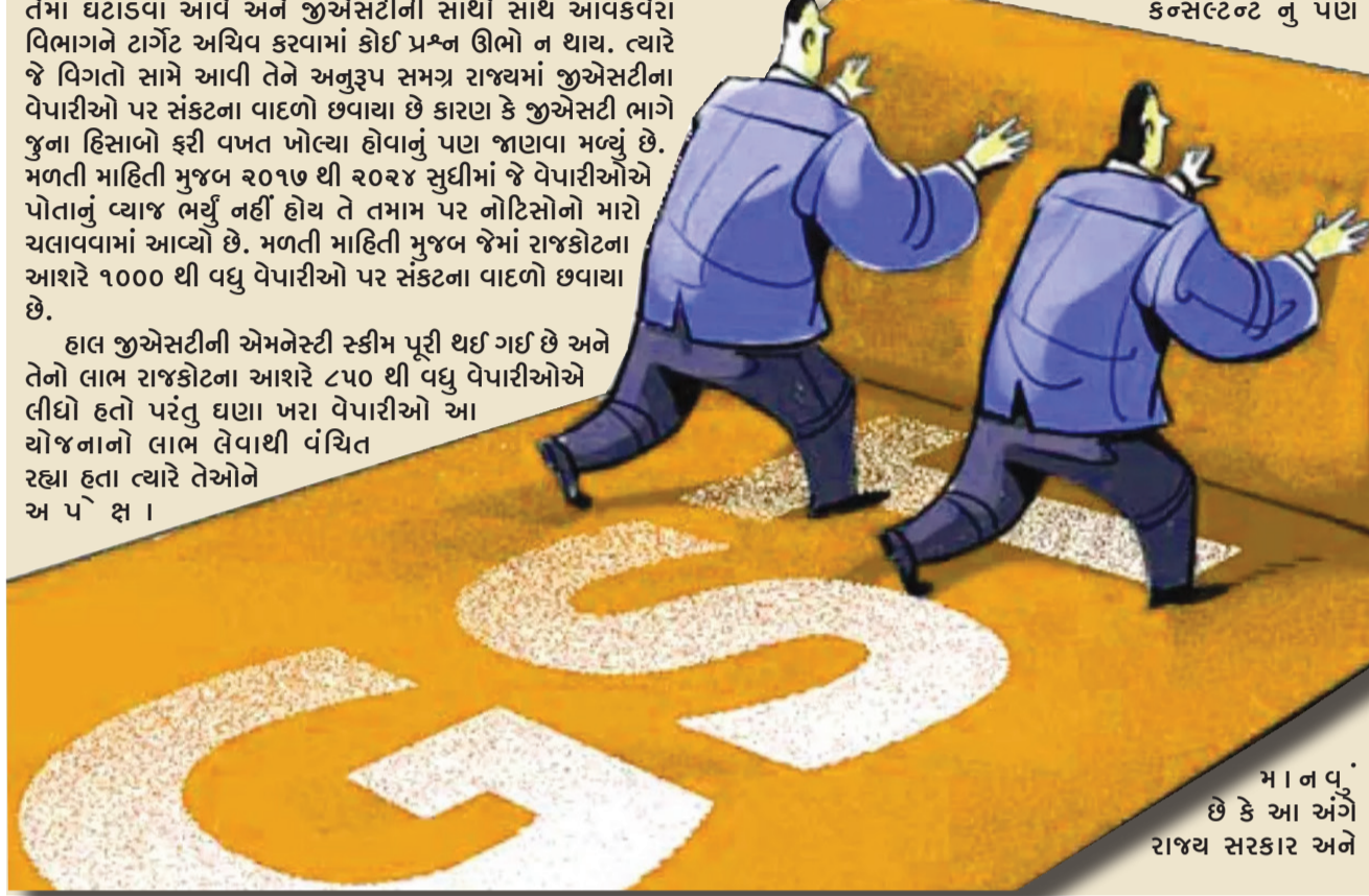
મા ન વુ... છે કે આ અંગે રાજ્ય સરકાર અને

અધિકારીઓ દ્વારા વ્યાજના ભરો તો બેંક એટેચમેન્ટ કરવાની ચીમકીઓ અપાઈ છે. કાયદાકીય જોગવાઈ મુજબ ઓર્ડર કર્યા વગર અધિકારીઓ કોઈપણ વ્યાપારીના માત્ર ઇન્ટેમ્પેશન દર્શાવે બેંક એટેચમેન્ટ મુકી શકે નહીં. વર્ષ ૧૭-૧૮, ૧૮-૧૯, અને ૧૯-૨૦ ના એસએસએન્ટો કમ્પ્લીટ થઈ ગયા હોવા છતાં પણ આવી વ્યાજ વસુલની નોટીસો ફટકારાઈ છે કે કેમ એસએસએન્ટો પૂરા થઈ ગયા બાદ વ્યાજ વસુલવાનું તંત્રને યાદ આવ્યું? સમાધાન યોજના પૂર્ણ થઈ ગયા બાદ વ્યાજ વસુલ કરવાનું યાદ આવ્યું તે વેપારીઓ કહે છે.