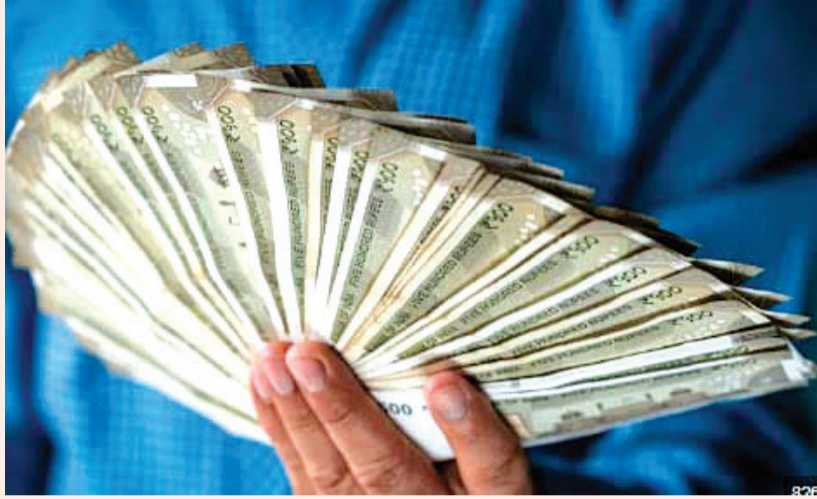
તેના પૈસા વિસ્તાલીસ દિવસમાં બેંક મારફતે વેપારીને આપવાનો વાયદો કર્યો હતો. એચીએકસી બેંકના ખાતામાં ૬૭ લાખ અને અંબા એન્ટરપ્રાઇઝના ખાતામાં ૭૫ લાખ પેમેન્ટ આપ્યું હતું.