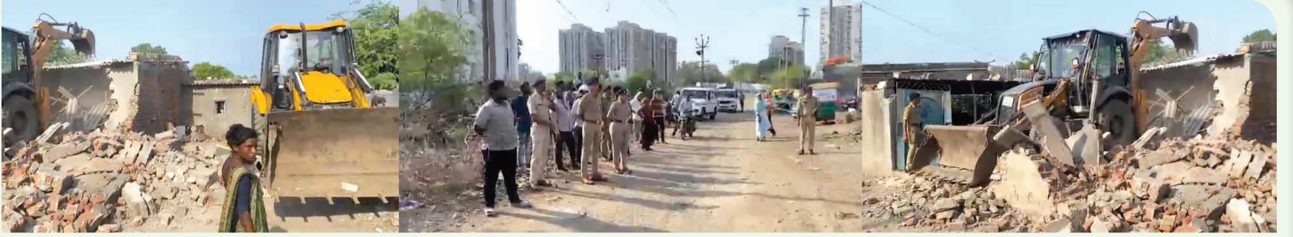
એકસામટી ઓર્ચીટી કાર્યવાહીથી ગુનાખોરી આચરતાં તત્વોમાં ફફડાટ ફેલાયો : ગૃહ વિભાગના આદેશ અંતર્ગત વધુ એક કાર્યવાહી