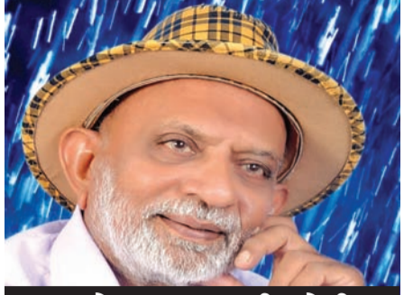
આલેખન : આર.પી. જોષી

કંઠકિત્રી દિવાળીબેન ભીલનો મધમીઠડો સ્વર ઈશ્વરમાં એકાકાર થયો એ ઘટનાને આજે નવ વર્ષ પૂરાં થયા