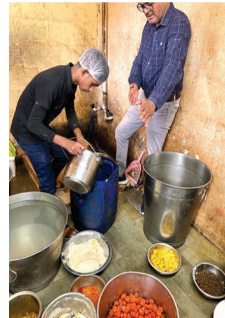
“મિલન ખમણ” પેઢીની તપાસ કરતા સ્થળ પર સંગ્રહ કરેલ રંધેલા પાત્રા તથા કાપેલા મરચાં પડતર વાસી થયેલ મળી આવતા કુલ મળીને ૦૫ કિ.ગ્રા. અખાધ જથ્થોનો સ્થળ પર નાશ કરવામાં આવેલ તેમજ પેઢીને સ્થળ પર હાઈજેનિક કન્ટેનર જાળવવા, યોગ્ય સ્ટોરેજ જાળવવા તથા લાયસન્સ બાબતે નોટીસ આપવામાં આવેલ. એવીજ રીતે અક્ષર માર્ગ, ઇન્ડીનિયમ એવન્યુ, રાજકોટ મુકામે આવેલ “સરાડા કાફે” પેઢીની તપાસ કરતા પેઢીને સ્થળ પર હાઈજેનિક કન્ટેનર

રાજકોટ, તા. ૨૩ રાજકોટ મહાનગરપાલિકાના દ્વારા સર્વેલન્સ ચેકિંગ દરમિયાન ભોમેશ્વર મેઈન રોડ, ભોમેશ્વર મંદિર સામે, રાજકોટ મુકામે આવેલ “બાલાજી પાન કોલ્ડ્રિંક્સ” પેઢીની તપાસ કરતા સ્થળ પર સંગ્રહ કરેલ વાસી લચ્છીની બોટલ (200 ml) તથા પાઈનેપલ સરખત (200 ml) મળીને કુલ ૧૬ લિટર (૮૦ નંગ બોટલ) અખાધ જથ્થોનો સ્થળ પર નાશ કરવામાં આવ્યો હતો. તેમજ પેઢીને સ્થળ પર હાઈજેનિક કન્ટેનર જાળવવા, યોગ્ય સ્ટોરેજ જાળવવા તથા લાયસન્સ બાબતે નોટીસ આપવામાં આવેલ. સર્વેલન્સ ચેકિંગ દરમિયાન એરપોર્ટ રોડ, રાજકોટ મુકામે આવેલ “સીમરન ટી બલે બલે રેસ્ટોરન્ટ” પેઢીની તપાસ કરતા સ્થળ પર સંગ્રહ કરેલ વાસી અખાધ મંચુરિયન, બાંધેલો લોટ તથા સજી વગેરે મળીને કુલ ૨૩ કિ.ગ્રા. અખાધ જથ્થોનો સ્થળ પર નાશ કરવામાં આવેલ તેમજ પેઢીને સ્થળ પર હાઈજેનિક કન્ટેનર જાળવવા, યોગ્ય સ્ટોરેજ જાળવવા તથા લાયસન્સ બાબતે નોટીસ આપવામાં આવેલ. સર્વેલન્સ ચેકિંગ દરમિયાન ભારત પાન સામે, ભગવતીપરા મેઈન રોડ, રાજકોટ મુકામે આવેલ “ગોશિયા કેટરર્સ” પેઢીની તપાસ કરતા સ્થળ પર સંગ્રહ કરેલ વાસી અખાધ નોનવેજ ડિપેર્ટ ફૂડ ઍન્ડલુચ્છત કુલ ૦૭ કિ.ગ્રા. વાસી અખાધ જથ્થોનો સ્થળ પર નાશ કરવામાં આવેલ તેમજ પેઢીને સ્થળ પર યોગ્ય સ્ટોરેજ કરવા, હાઈજેનિક કન્ટેનર જાળવવા બાબતે નોટીસ આપવામાં આવેલ. સર્વેલન્સ ચેકિંગ દરમિયાન ખોડલ યોડ, નંદનવન -૩ સામે, મવડી, રાજકોટ મુકામે આવેલ