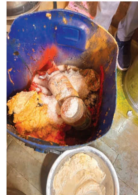
જાળવવા તથા યોગ્ય સ્ટોરેજ જાળવવા બાબતે નોટીસ આપવામાં આવેલ. દરમિયાન કાલાવડ રોડ, કોસ્મોપોલિટન સામે, રાજકોટ મુકામે આવેલ “સરાડા રેસ્ટોરન્ટ બેન્કવેટ” પેઢીની તપાસ કરતા પેઢીને સ્થળ પર હાઈજેનિક કન્ટેનર જાળવવા તથા યોગ્ય સ્ટોરેજ જાળવવા બાબતે નોટીસ આપવામાં આવેલ. ફૂડ વિભાગની ટીમ તથા FSW વાન સાથે શહેરના પુષ્કરધામ રોડ થી આકાશવાણી ચોક -યુનિવર્સિટી રોડ વિસ્તારમાં આવેલ ખાઘચીજોનું વેચાણ કરતાં કુલ ૩૮ ઘંઘાઈઓની ચકાસણી હાથ ધરવામાં આવેલ.

જેમાં ૦૮ ઘંઘાઈઓને લાઈસન્સ બાબતે સૂચના આપવામાં આવેલ. તેમજ પાઘ્ય ચીજોના કુલ ૩૫ નમૂનાની સ્થળ પર ચકાસણી કરેલ. ફૂડ વિભાગ દ્વારા ઓશો મેડિસિન્સ, શ્રી આઈસ્ક્રીમ પાર્લર, બાલાજી મેડિકલ, ગિરિરાજ એજન્સી, શુભમ પ્રોવિઝન સ્ટોર, અનુજ અમુલ પાર્લર, ખોડિયાર ડેરી ફાર્મ, અનામ વૃધરા, જશોદા ડેરી ફાર્મ, ગાંધી સોડા શોપ, બેસ્ટ બેકરી, અતુલ બેકરી, બર્ગર ભાઈ, હરબોલે ફરસાણ, જલારામ અલ્પાહાર, જોગમાયા રેસ્ટોરન્ટ, ટ્રિલાઈટ સોડા શોપ, જશચંદ્ર દાળ પકવાન, હરિફુલ દાળ પકવાન, રહેશ સેલ્સ એજન્સી, જય અંબે ગાંધિયા, શ્રી ગણેશ ખમણ, જલારામ ખમણ, નાસ્તા ઘર, ગોલીવાલા સોડા શોપ, મહાદેવ દેશી વધાર, ભાગ્યોદય ગાંધિયા, જય બજરંગ ડ્રીલક્સ રેસ્ટોરન્ટ, રામ વિજય ડેરી ફાર્મ, સનરાઈઝ પ્રોવિઝન સ્ટોરની ચકાસણી કરવામાં આવી.