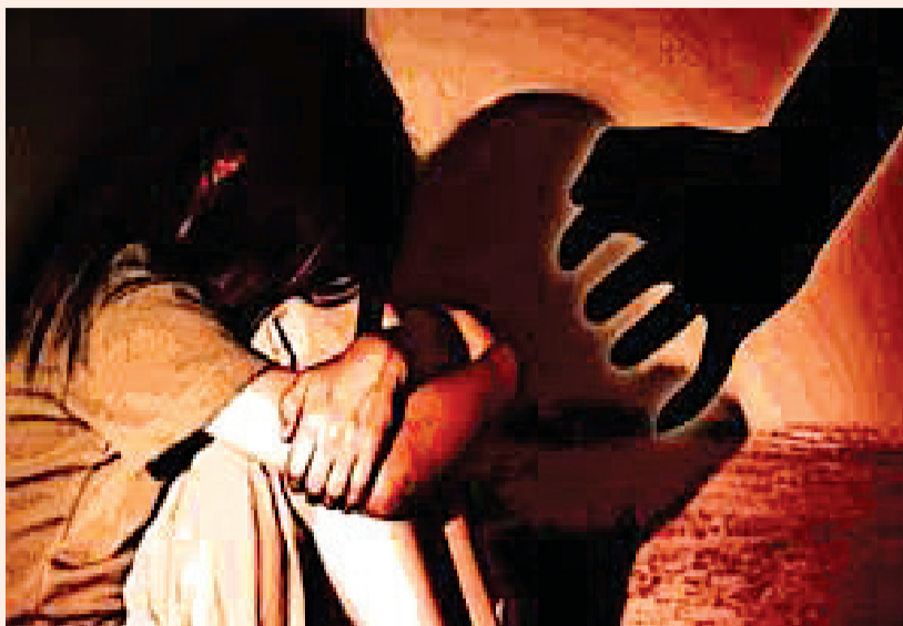
બીજા કિસ્સામાં ડોક્ટર સામેની દૂષ્કર્મની ફરિયાદ અદાલતે રદ કરી

દીકરી સાથે બળજબરીથી શારીરિક સંબંધ બાંધી બળાટકાર ગુજાર્યો હતો અને એનો વીડીયો પણ બનાવી લીધો હતો, જેકે ત્યાર બાદ છેલ્લાં બાર વર્ષના સમયગાળા દરમિયાન સાવકા પિતાએ ફોટા અને વીડીયોના આધારે બ્લેકમેઇલ કરી શારીરિક સંબંધ બાંધવાના અનેકવાર પ્રયાસો કર્યા, પરંતુ દીકરી તાબે થઈ ન હતી. ઉલ્લેખનીય છે કે બાર વર્ષથી સતત માનસિક રીતે દબાણ આપવાનું ચાલુ રાખતાં ભોગ બનનાર દીકરીએ સાવકા પિતા સામે પોલીસ ફરિયાદ નોંધાવતાં પોલીસે બળાટકારનો ગુનો દાખલ કરી વધુ તપાસ હાથ ધરી છે. ઘટનાની પોલીસ સુત્રોએ વધુ માહિતી આપતા કહ્યું કે શહેરના મોટા વરાછા વિસ્તારમાં રહેતી એક કિશોરીના પિતા નાની ઉંમરમાં અવસાન પામ્યા હતા. ત્યાર બાદ તેની માતાના સાસરિયાં પક્ષે સંબંધી યુવક સાથે લગ્ન કરાવી દીધા હતા, ત્યાર બાદ કિશોરી તેની માતા અને સાવકા પિતા સાથે મોટા વરાછા વિસ્તારમાં રહેતી હતી. બાર વર્ષ પહેલાં સાવકા પિતાએ ૧૫ વર્ષની દીકરી પર દાનત બગાડી હતી અને દીકરીની એકલાતો લાભ લઈ બળજબરીથી શારીરિક સંબંધ બાંધી બળાટકાર ગુજાર્યો હતો. આ સમયે સાવકા પિતાએ શારીરિક સંબંધ બાંધતો હોય એવા ફોટા અને વીડીયો પણ ઉતારી લીધો હતો. જેની જાણ દીકરીને પણ ન હતી. જેકે ત્યાર બાદ