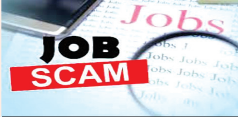
અન્ય ઘટનામાં ટ્રાન્સફરના પેકેજ ટૂંકા નામે નર્સ સાથે થઈ ગઈ ઠગાઈ