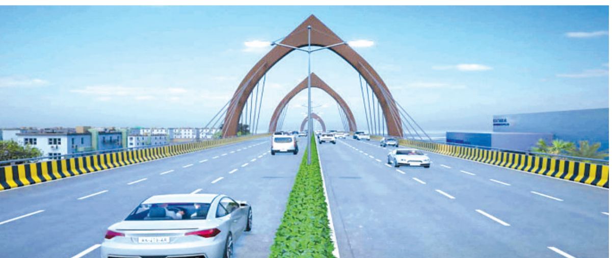
કરતા પૂર્વે બંને તરફ ડાઈવરજન માટેના રોડનું કામ ચાલુ છે. પરંતુ આ કામ ક્યારે પૂર્ણ થશે તે પણ સૌથી મોટો પ્રશ્ન છે. હાલ માવડું જે વરસ્યું તેના કારણે આ કામમાં ઘણો ખરો અવરોધ આવ્યો છે ત્યારે ચોમાસા પુરવા ડાઈવરજનના રોડનું કામ પૂરું થઈ જાય તો પણ સારું કહેવાય પરંતુ હાલની સ્થિતિએ આ કાર્ય પૂર્ણ ન થાય તો પણ નવાઈ નથી. કટારીયા ચોકડીએ જે સિક્સ લેન્ડ કેબલ બ્રિજ નો પ્રોજેક્ટ હાથ ધરવામાં આવ્યો છે તે ૭૪૪ મીટર લંબાઈ અને ૨૩.૧ મીટર ની પહોળાઈ વાળો આ બ્રિજ બનશે અને આ બ્રિજ હેઠળ અન્યરૂપાસનું પણ આયોજન કરવામાં આવ્યું છે.

રાજકોટ, તા. ૨૪ શહેરની માળખાગત સુવિધાઓ વધારવા માટે અને હાલ જે રીતે જન સંખ્યામાં વધારો થઈ રહ્યો છે ત્યારે ટ્રાફિક સમસ્યા ન સર્જાય તે માટે મહાનગરપાલિકા દ્વારા વિવિધ મુખ્ય માર્ગો પર બ્રિજ બનાવવાની કામગીરી શરૂ કરી છે ત્યારે કાલાવડ રોડ કટારીયા ચોકડી પાસે શહેરનો સર્વપ્રથમ કેબલ ફ્લાવર બ્રિજ બનાવવા માટેનો જે નિર્ણય લેવામાં આવ્યો તેનું ખાતમુહૂર્ત પણ મુખ્યમંત્રી દ્વારા કરવામાં આવ્યું હતું પરંતુ દર વખતની જેમ મહાનગરપાલિકાની ઢીલીતીના પગલે જે કામગીરી ઝડપભેર શરૂ થવી જોઈએ અને પૂર્ણ થવી જોઈએ તે થઈ શકતી નથી. હાલ આ કામગીરી માટે જે ખાતમુહૂર્ત કરવામાં આવ્યું હતું તેને બે મહિના થઈ ગયા છે છતાં પણ એક પણ પ્રકારનું કામ શરૂ કરવામાં આવ્યું નથી અને જાણે મહાનગરપાલિકા હજી પણ ગડમથલમાં હોય તેવું માનવામાં આવી રહ્યું છે.