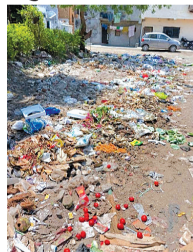
હાલ જે વિસ્તારનો પ્રશ્ન છે તે વિસ્તારમાં ડામર રોડ પણ બનાવવામાં આવ્યો નથી જેથી આ

રાજકોટ, તા. ૨૪ વરસાદ નો સમય આવે અને રાજકોટના અનેકવિધ વિસ્તારોમાં રહેવાસીઓને ઘણી ખરી તકલીફનો સામનો કરવો પડતો હોય છે કારણ કે યોગ્ય રીતે તેમના વિસ્તારની સાફ-સફાઈ કરવામાં ન આવતા કચરો એક જ જગ્યાએ એકત્રિત થતો હોય છે અને વરસાદી પાણી સાથે ભળી રોગચાળો વકરે છે આ પ્રકારની એક નહીં અનેકવિધ ફરિયાદો મહાનગરપાલિકાને કરવામાં આવતી હોય છે પરંતુ મહાનગરપાલિકાના સંબંધિત વિભાગ દ્વારા આ અંગે યોગ્ય પગલાં લેવામાં આવતા ન હોવાનું પણ માલુમ પડ્યું છે. હાલ રાજકોટ શહેર ખાતે આવેલા રોડમાં શિવમ પાર્ક ચાર ના રહેવાસીઓ દ્વારા અનેક વખત ફરિયાદો કરવામાં આવી રહી છે કે ભવનાથ મંદિર પાસે લોકો અવારનવાર કચરો નાખી જાય છે અને આ કચરાના કારણે ગંદકી સતત પ્રસરી રહી છે. કોર્પોરેશનને રજૂઆત કરવામાં આવી જતા કોઈપણ પ્રકારનું પગલું લેવામાં આવ્યું નથી અને પરિણામ સ્વરૂપે રહેવાસીઓને બીમારી ફેલાવવાનો ભય પણ લાગી રહ્યો છે. રહેવાસી હોય એવી પણ ફરિયાદ કરી હતી કે જેમ નિયમિત સાફ-સફાઈ વિસ્તારની થવી જોઈએ તે થતી નથી જેને લઈને મહાનગરપાલિકા ગંભીરતાપૂર્વક વિચાર કરે તે ખૂબ જરૂરી અને આવશ્યક છે. ત્યારે આગામી દિવસોમાં જો આ અંગે યોગ્ય નિર્ણય લેવામાં ન આવ્યો તો લોકોએ ચીમકી પણ ઉઠાવવી છે. આ ફરિયાદ માત્ર એક કે બે મહિનાથી નહીં પરંતુ સાતથી આઠ વર્ષ થી ચાલી રહી છે તેની વારંવાર ફરિયાદો કરવા છતાં તંત્ર દ્વારા મગનું નામ મરી પાડવામાં આવતું નથી ત્યારે આ સમસ્યાનું તાકીદે નિવારણ લાવવામાં આવે તે અંગે પણ હાલ માંગ કરવામાં આવી છે. કોઈપણ વિસ્તારનો વિકાસ ત્યારે જ શક્ય બને જ્યારે માળખાગત સુવિધા તેઓને મળતી હોય