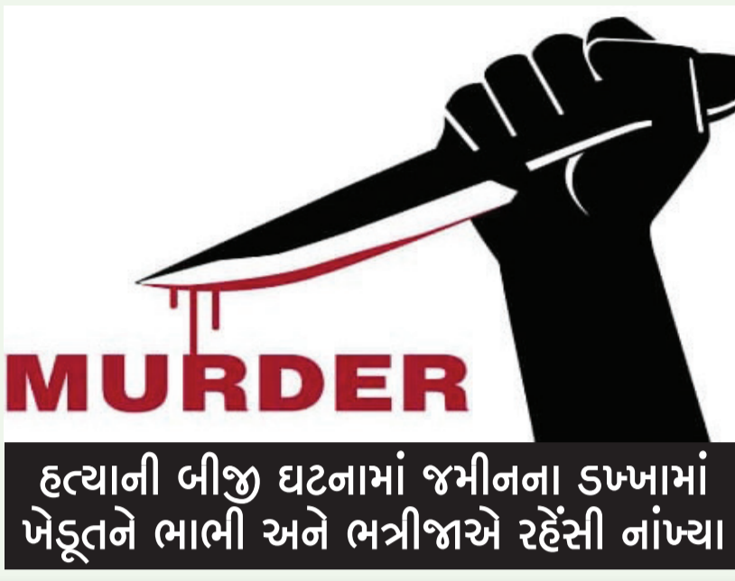
હત્યાની બીજી ઘટનામાં જમીનના ડખખામાં ખેડૂતને ભાભી અને ભત્રીજાએ રહેંસી નાંખ્યા