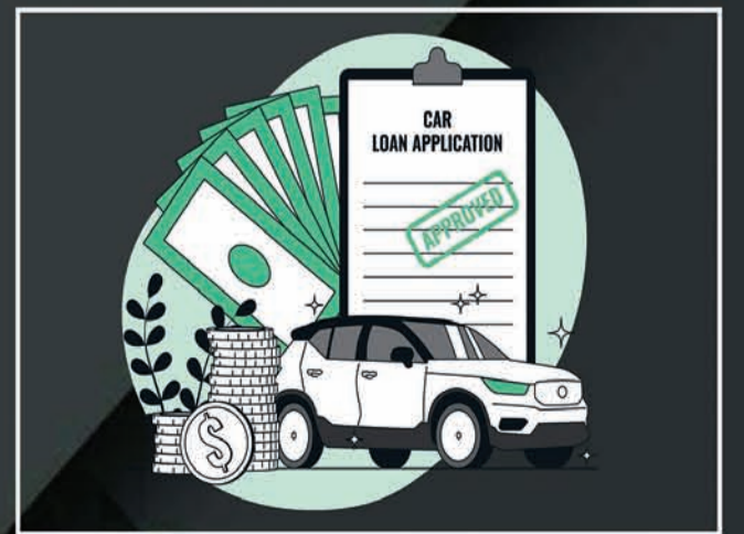
Loan & Insurance