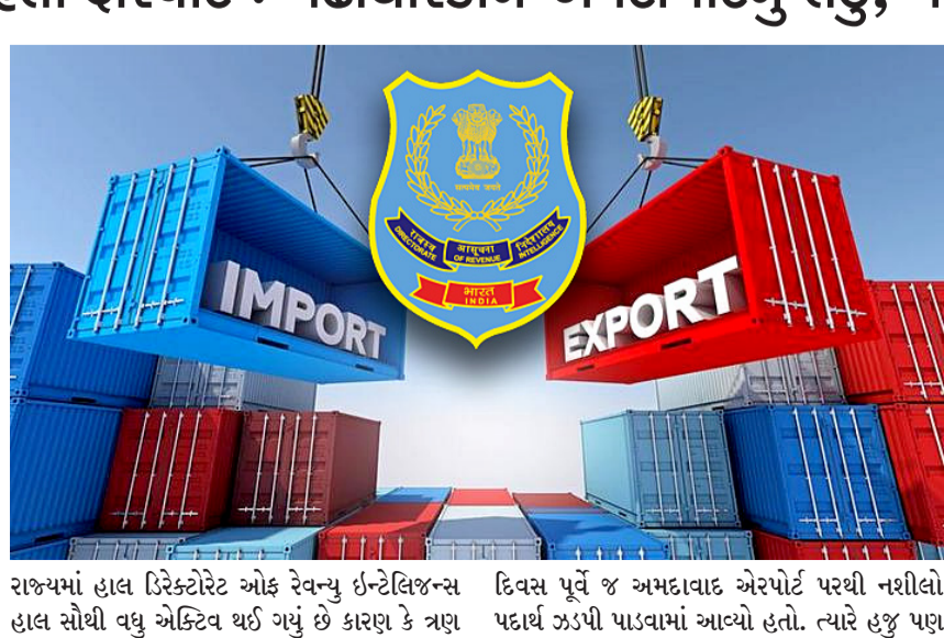
રાજ્યમાં હાલ ડિરેક્ટોરેટ ઓફ રેવન્યુ ઈન્ટેલિજન્સ દ્વારા પેઢી ધરાવતા વધુ એક્ટિવ થઈ ગયું છે કારણ કે ત્રણ દિવસ પૂર્વે જ અમદાવાદ એરપોર્ટ પરથી નશીલો પદાર્થ ઝડપી પાડવામાં આવ્યો હતો. ત્યારે હજુ પણ

ધ્યાને લઈ હાલ એક્સપોર્ટરને ટાર્ગેટ બનાવવામાં આવ્યા છે જેની પાછળનું બીજું સૌથી મોટું કારણ એ પણ છે કે આ અંગે એક નહીં અનેક વ્યાપક ફરિયાદો ઉઠવા પામી હતી. જેને ધ્યાને લઈ રાજકોટ ગોંડલ યાદમાં આવેલી દુકાન તથા ઓફિસ ધરાવતા ખેત એક્સપોર્ટર પર છેલ્લા બે દિવસથી અધિકારીઓનો કાફલો જોવા મળ્યો હતો અને તેપાસનો ધમધમાટ આગળ ધપાવવામાં આવ્યો હતો. બંને પેઢીમાં કરવામાં આવેલા હિસાબો અને પેઢીનું સાહિત્ય તથા તમામ વ્યવહારો પણ તપાસવામાં આવ્યા હતા એટલું જ નહીં શંકાસ્પદ લાગતા દસ્તાવેજો ને અધિકારીઓ તેમની સાથે લઈ ગયા હોવાનું પણ જાણવા મળી રહ્યું છે. બંને પેઢીઓ દ્વારા કોઈક ને કોઈ શંકાસ્પદ ગતિવિધિઓ કરતા હોવાનું માલુમ પડ્યું હતું અને તે આધારે જ હાલ એજન્સીની ટીમે ધામા નાખ્યા હતા આ કિસ્સામાં હવે ક્યા પ્રકારના પગલા લેવામાં આવે છે તે જોવાનું રહ્યું પરંતુ ગુજરાત