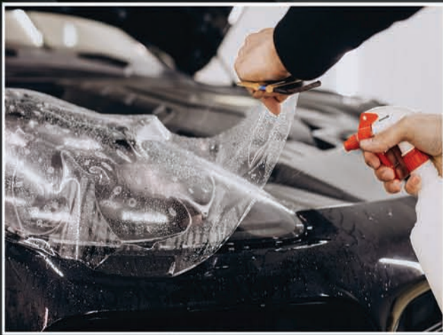
Paint Protection Film