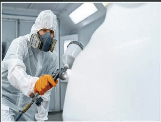
Full Body Paint & Modification