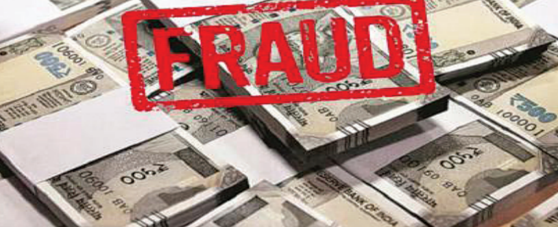
પેમેન્ટ કર્યું હતું. જ્યારે બાકીના ૨૯.૫૨ લાખની ચુકવણી કરી નહોતી. આ ઉપરાંત બીજા વખત ૨.૬૯ લાખનો માલ પણ ઉધાર લીધો હતો. જેનો એક રૂપિયો પણ ચુકવ્યો નહોતો. આમ