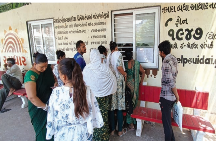
કરજિયાત મનપા તંત્રની સેન્ટ્રલ કચેરીએ આધાર કાર્ડ લગતની કામગીરી માટે આવું પડી રહ્યું છે.

અરજદારોનો ઘસારો રહેતો હતો. મનપા તંત્ર એ વૈકલ્પિક રસ્તો કાઢીને ઘસારાને હળવો કરવાની કામગીરી હાથ ધરી હતી. શહેરના ૧૮ વોર્ડના વોર્ડ ઓફિસમાં આધાર કાર્ડની કામગીરીને સક્રિય કરવામાં આવી છે. ત્યારે મનપાની ત્રણ ઝોન કચેરીમાં આધાર કાર્ડ ની કામગીરી હળવી થઈ. પરંતુ કુટી આધાર કાર્ડ માટે અરજદારોના ઘસારા રાજકોટ મહાનગરપાલિકાની સેન્ટ્રલ કચેરીએ જોવા મળે છે. પ્રામ વિગતો મુજબ, રાજકોટ જિલ્લાના અમુક તાલુકા અને તેના ગામડાના લોકો આધાર કાર્ડની પ્રક્રિયા કરાવવા મનપાની સેન્ટ્રલ ઝોન કચેરીએ પહોંચી રહ્યા છે. મનપાની સેન્ટ્રલ ઝોન કચેરીએ આધાર કાર્ડની પ્રક્રિયા માટે અરજદારોનો ઘસારો જોવા મળી રહ્યો છે. આ ઘસારામાં ગામડા અને તાલુકા માંથી આવતા અરજદારોની સંખ્યા વધારે જોવા મળી રહી છે. કારણ માત્ર જે તે તાલુકાઓમાં આધાર કાર્ડની કામગીરી શરૂ ન હોવાથી લોકોને