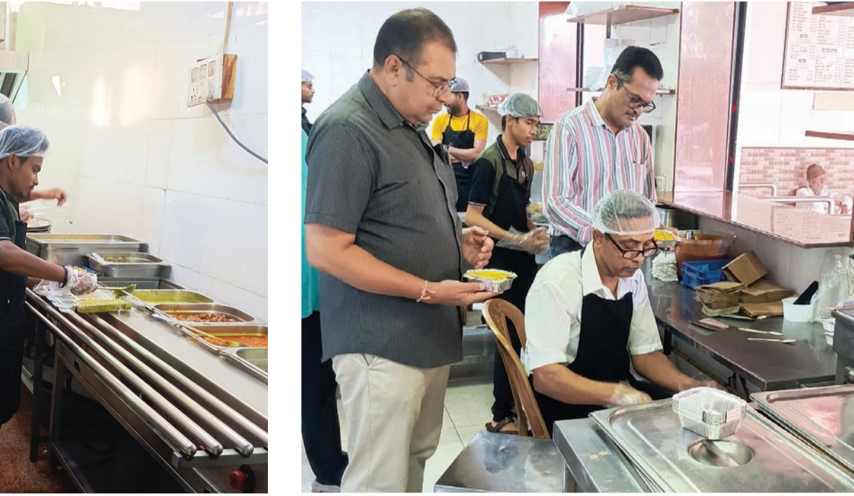
ફૂડ વિભાગની ટીમ તથા FSW વાન સાથે શહેરના હરિધવા રોડ વિસ્તારમાં આવેલ ખાદ્યચીજોનું વેચાણ કરતાં કુલ ૨૦ ધંધાર્થિઓની ચકાસણી હાથ ધરવામાં આવેલ. જેમાં ૯ ધંધાર્થિઓને લાઈસન્સ બાબતે સૂચના આપવામાં આવેલ. તેમજ ખાદ્ય ચીજોના કુલ ૧૫ નમૂનાની સ્થળ પર ચકાસણી કરેલ. બીજી તરફ લાઈસન્સ બાબતે ઓમ આયુર્વેદિક, કિષ્ના મારવાડી પાણીપુરી, એસએસ દ્વાળ પકવાન, જય શ્રી ભવાની કરસાણ, અજરંગ પ્રોવિઝન સ્ટોર, ગાંધી સોડા શોપ, સોનલ સુપર માર્કેટ, મયુર ભજ્યા અને મોમાઈ લક્ષ્મીને લાયસન્સ મેળવવા બાબતે નોટિસ પાઠવવામાં આવી હતી જ્યારે હરિ યોગી લાઈવ પક, જય મંદિર કોલ્ડડ્રિંક્સ, મિલન ખમણ, ગોતમ કરસાણ, મિલન ભેળ, શ્રીજી આઈસ્ક્રીમ, ધ કે ક સ્ટુડિયો, નીલકંઠ ડેરી ફાર્મ, ખોડિયાર સોડા શોપ, દરબાર ડાઈનિંગ હોલ, શિવ કરસાણની ચકાસણી કરવામાં આવી હતી.

રાજકોટ મહાનગરપાલિકાના ફૂડ વિભાગ દ્વારા 'ખોડિયાર ડેરી ફાર્મ', માધાપર, ઈસ્વરીયા મહાદેવ મંદિર મેઈન રોડ, જામનગર રોડ, રાજકોટ મુકામેથી લેવામાં આવેલ ખાદ્યચીજ "દહીં (લુઝ)" નો નમૂનો તપાસ બાદ પૃથક્કરણ રિપોર્ટમાં મિલક ક્રેટ તથા SNFનું પ્રમાણ ધારાધોરણ કરતાં ઓછું હોવાથી નમૂનો "સબસ્ટાન્ડન્ટ" (કેઈલ) જાહેર થયેલ છે. જે અંગે એજ્યુકેશન કાર્યવાહી કરવામાં આવશે. ફૂડ વિભાગ દ્વારા 'હરે રામ હરે કૃષ્ણ ડેરી ફાર્મ', મનહર સોસાયટી-૧ કોર્નર, પંડક રોડ, રાજકોટ મુકામેથી લેવામાં આવેલ ખાદ્યચીજ "શુદ્ધ ઘી (લુઝ)" નો નમૂનો તપાસ બાદ પૃથક્કરણ રિપોર્ટમાં ઈલ્ટ્રીસીંગ ધારાધોરણ કરતાં વધુ તથા ફોરેન ફેટ (વેજીટેબલ ફેટ) ની હાજરી હોવાથી નમૂનો "સબસ્ટાન્ડન્ટ" (કેઈલ) જાહેર થયેલ છે. જે અંગે એજ્યુકેશન કાર્યવાહી કરવામાં આવશે.