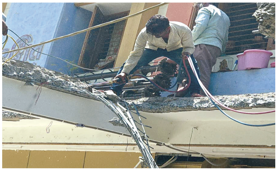
રાજકોટ, તા. ૩૦

રાજકોટ મહાનગરપાલિકા દ્વારા વિવિધ પ્રકારના કામો હાથ ધરાવતા હોય છે એટલું જ નહીં હાલ જે ગેરકાયદે બાંધકામો ની ઝુંબેશ ચાલી રહી છે તેને ધ્યાને લઈ વિભાગ દ્વારા શહેરના ત્રણેય ઝોન વિસ્તારમાં જે ગેરકાયદે બાંધકામો ખડકલો કર્યો હોય અથવા તો માર્જિનની જગ્યામાં બાંધકામ ઉભો કર્યું હોય તેને દૂર કરવા માટેની કામગીરી હાથ ધરવામાં આવી રહી છે. ત્રણેય ઝોનના સીટી એન્જિનિયર હાલ એક જ કામમાં લાગ્યા હોય તો તે છે ડિમોલિશન. પરંતુ મહાનગરપાલિકા ને જાણકાર વર્તુળો એક જ પ્રશ્ન પૂછી રહ્યા છે કે આ બધાય તો મહાનગરપાલિકાની નજરે આવી જાય છે અને તેમનું બાંધકામ તોડી પાડવામાં આવે છે પરંતુ ઘણા બરા એવી પરિસ્થિતિમાં જે સરકારી જગ્યા હોય તેમાં ઝુંપડા ઉભા કરી દે છે ત્યારે આ ઝુંપડાપટ્ટીઓને ક્યારે દૂર કરવામાં આવશે એ પણ દબાણ છે તે તો એ દબાણ ક્યારે દૂર થશે.