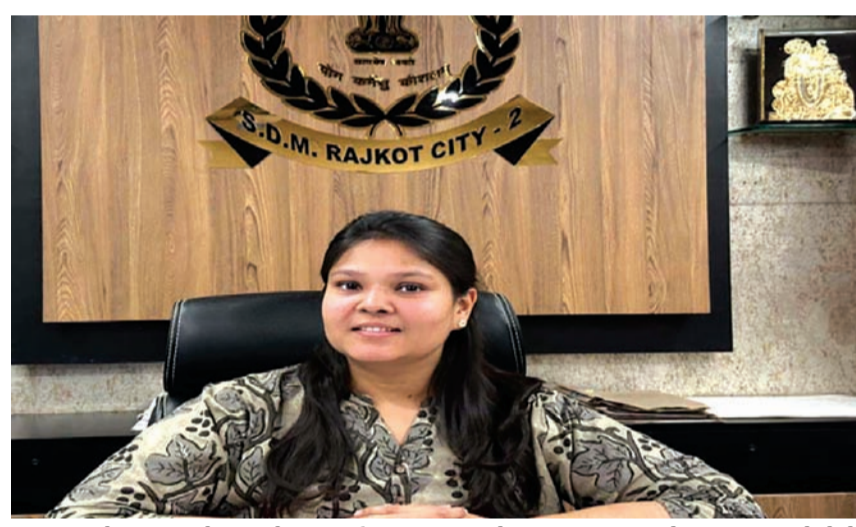
આવી હતી તે અધિકારી તેના બદલે અન્ય સર્વે નંબર વાળી જમીનમાં કબજો મેળવતા જે મૂળ હુકમની શરતનો ભંગ થયો હતો ત્યારે આ જમીન સરકાર હસ્તક લેવા માટેના હુકમ પણ કરવામાં આવ્યા. આગામી દિવસોમાં આ પ્રકારની ઘણી-ખરી જમીનોમાં શરત ભંગ થયેલી છે ત્યારે તેનો ચુકાદો પણ તાકીદે આપવામાં આવે તે પ્રકારનું આયોજન જિલ્લા વહીવટી તંત્ર દ્વારા કરવામાં આવી રહ્યું છે અત્યારે જિલ્લા વહીવટી તંત્ર માટે સૌથી મોટો પ્રશ્ન જો કોઈ હોય તો તે એ છે કે હાલ જે રીતે ગેરકાયદે

રાજકોટ, તા. ૨ રાજકોટ વહીવટી તંત્ર ઇલા સમયથી હાલ જે ગેરરીતીઓ આચરતા હોય તેમના પર પગલા લઈ રહ્યું છે એટલું જ નહીં મહેસુલ વિભાગની કામગીરી ઝડપભર હાથ ધરવામાં આવે તે માટે પણ તમામ ટકેદારીના પગલાંઓ લેવામાં આવી રહ્યા છે પરંતુ હાલ શરત ભંગ થઈ હોવાના એક નહીં અનેક કિસ્સાઓ સામે આવ્યા છે જેને ધ્યાને લઈ પ્રાંત અધિકારી મહેક જૈન દ્વારા રાજકોટ નજીક મકનસર ગામની પેસી લાખની જમીનમાં સરત ભંગ થતા સરકાર હસ્તક આ જમીન લેવા માટે આદેશ કરી દેવામાં આવ્યા છે. મળતી માહિતી મુજબ મકનસર ગામના સરવે નંબર ૨૪ પૈકીની જમીન જે ઘૂઘાભાઈ રબારીને ખેતી હેતુ માટે સાયણી આપવામાં આવી હતી તેમાં શરદ ભંગ થતાં આ નિર્ણય લેવામાં આવ્યો.