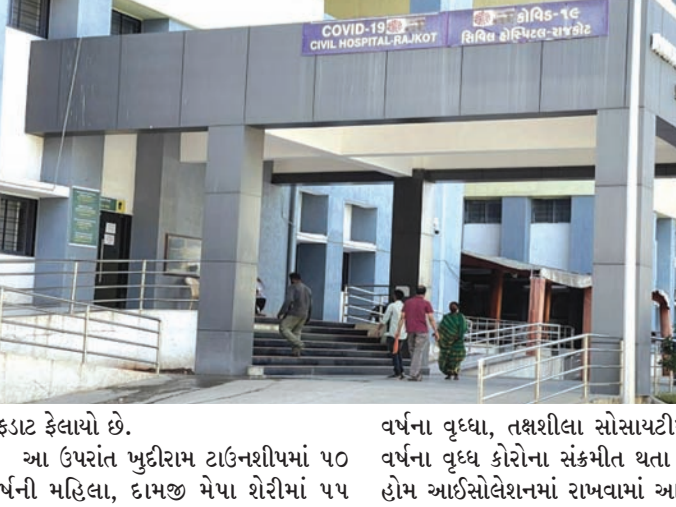
ફફડાટ ફેલાયો છે. આ ઉપરાંત જુદીરામ ટાઉનશીપમાં ૫૦ વર્ષની મહિલા, દામજી મેપા શેરીમાં ૫૫ વર્ષના વૃદ્ધ, તક્ષશીલા સોસાયટીમાં ૭૬ વર્ષના વૃદ્ધ કોરોના સંક્રમિત થતા તમામને હોમ આઈસોલેશનમાં રાખવામાં આવ્યા છે.

રાજકોટમાં નવા ૭ કેસ જાહેર થયા છે. જે તમામ દર્દી વેકસીન લીધેલા છે. માત્ર બે વ્યક્તિ જેતપુર અને મુંબઈ ગયા હતા. રામકૃષ્ણનગર, સ્પીડવેલ પાર્ટી પ્લોટ પાસે, સાધુ વાસવાણી રોડ, ચંદ્રેશનગર, અયોધ્યા ચોક અને હનુમાન મઢી વિસ્તારમાં આ કેસ હતા જે સાથે રાજકોટમાં કુલ દર્દીઓનો આંકડો ૪૪ પર પહોંચ્યો છે. આરોગ્ય વિભાગના સુત્રોના જણાવ્યા પ્રમાણે વોર્ડ નં.૮માં સુરજ પાર્કમાં ૨૬ વર્ષની યુવતિ, જય રેસીડન્સીમાં ૨૭ વર્ષનો યુવાન, જીવરાજ પાર્કમાં ૫૧ વર્ષના વૃદ્ધ, અંબિકા પાર્કમાં ૭૦ વર્ષના વૃદ્ધ અને વિદ્યાલેખ સોસાયટીમાં ૫૧ વર્ષના વૃદ્ધા સંક્રમિત થયા છે. અંબિકા પાર્કમાં બીજાં કેસ મળી આવ્યો છે જ્યારે છેલ્લા ૧૩ દિવસમાં નવ કેસ મળી આવતા