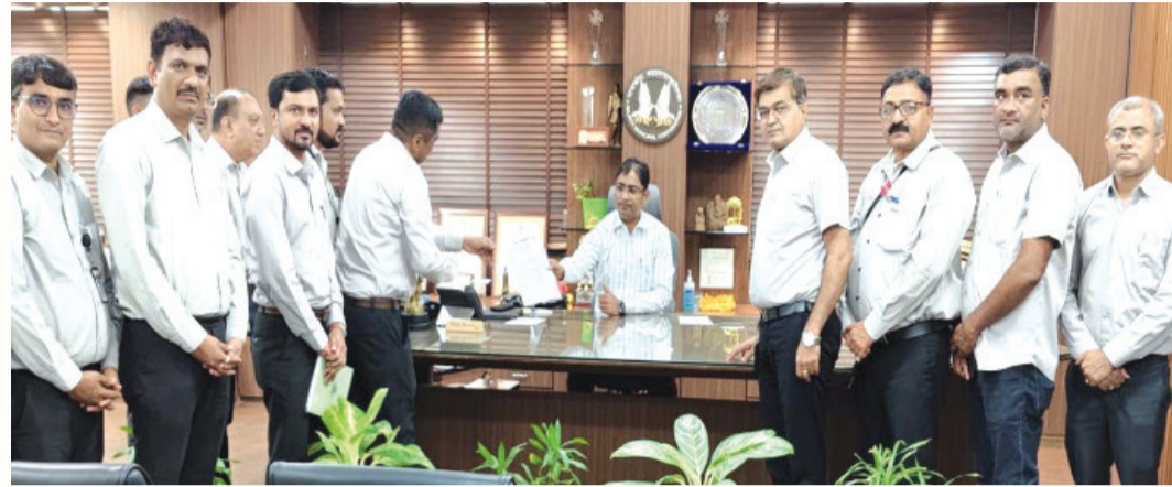
ફીડરમાં મેન લાઈનમાં અંડર ગ્રાઉન્ડ કેબલ ફોલ્ટ થતા અઢી કિલોમીટરના ભાગમાં પાવર બંધ થયો હતો જેને ઈમર્જન્સી પાવર માટે બે અલગ ફીડરમાં જોડીને ચાલુ કરવામાં આવ્યો. ૨૯ મેના રોજ ૧૧ કેવી ભુવનેશ્વર ફીડરમાં જમ્પર નો ફોલ્ટ થતાં વીજ પુરવઠો બંધ કરવામાં આવ્યો છે અને રીપેર કરી ચાલુ કરાયો હતો ત્યારે પીજીવીસીએલ દ્વારા જણાવવામાં આવ્યું હતું કે અધિકારીઓને કર્મચારીઓ રાત દિવસ આ બાબતે ખાસ એવી મહેનત

ટેકનિકલ પોર્ટના કારણોસર ૨૦ પુરવઠો ફોલ્ડવાતો હતો તે અંગે સ્ટેન્ડિંગ ચેરમેન દ્વારા બેકામ વાણી વિલાસ કરવામાં આવ્યો હોવાનું પણ માલુમ પડ્યું જે અંગે કર્મચારીઓ અધિકારીઓનું આત્મસ્માન પણ ગવાયું હતું. પીજીવીસીએલ દ્વારા પ્રથમનગર વોર્ડ નંબર ૨ નો વિસ્તાર છે તેમાં ૧૧ કેવી ભુવનેશ્વર ફીડર અને ૧૧ કેવી ઈન્કમટેક્સ સ્પીડરનો સમાવેશ થાય છે તારીખ ૨૭ થી ૨૯ દરમિયાન આ વિસ્તારમાં વીજકોલ્ટ સર્જાયો હતો. તારીખ ૨૭ મેના રોજ ૧૧ સદ ઈન્કમટેક્સ માં અંડર ગ્રાઉન્ડ કેબલમાં ફોલ્ટ થતાં જ વીજ પુરવઠો બંધ થઈ ગયો હતો જેને તાત્કાલિક અન્ય ફીડરમાં જોડીને પાવર શરૂ કરી દેવાયો અને ૨૮ મેના રોજ પણ ૧૧ કેવી ઈન્કમટેક્સ