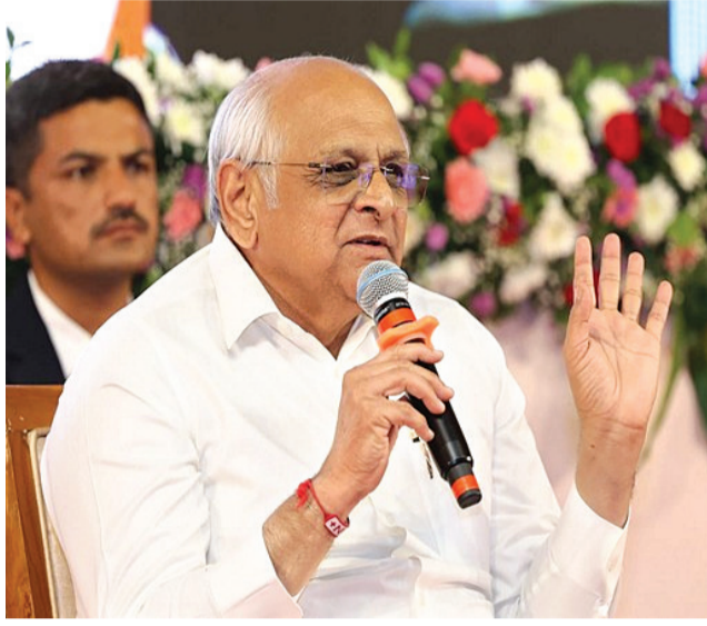
રાજકોટ, તા. ૫

૧૭ કામોના ખાતમુહૂર્તનું આયોજન : શ્યામાપ્રસાદ મુખર્જી આર્ટ ગેલેરીનો એક્ઝિબિશન હોલ પણ મૂકવામાં આવશે ખુદો