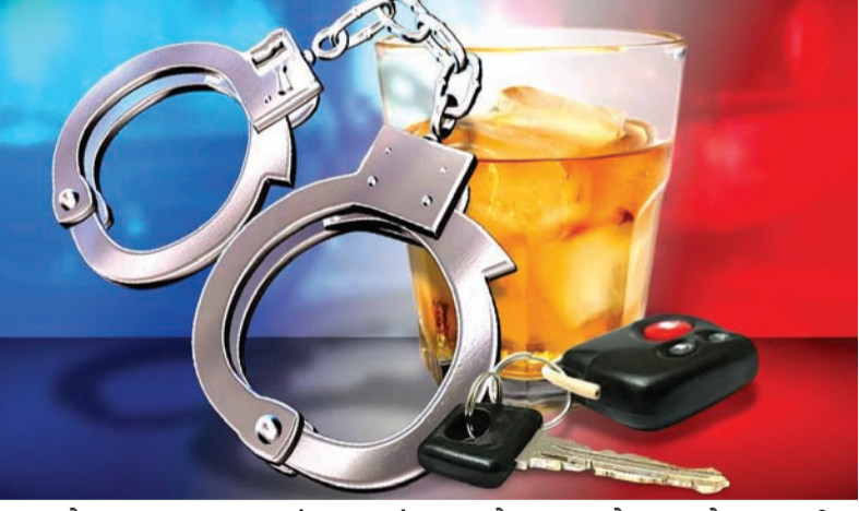
બામણાબોર ગામ તરફ તપાસમાં હતા ત્યાં કારનો આગળનો કાચ તેમજ ડ્રાઈવર ગામ તરફ જવાના જૂના રસ્તે એક વેન્ટો સાઈડનો કાચ તૂટેલ હાલતમાં પડેલ હતો.