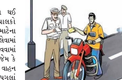
આર.ટી.ઓ. કચેરી રાજકોટ દ્વારા ગત મે માસ દરમિયાન અલગ-અલગ સ્થળોએ ટ્રાફિક નિયમોનો અમલના ભાગરૂપે યોજેલ ડ્રાઈવમાં

રાજકોટ, તા. ૬ આરટીઓના નિયમનો સરેઆમ ઉલાળ્યો થઈ રહ્યો છે ત્યારે આ પ્રકારના વાહન ચાલકો ઉપર આંકડા પગલાં લેવામાં આવે તે માટેના તમામ પગલાંઓ આરટીઓ કચેરી દ્વારા લેવામાં આવતા હોય છે અને ખાસ ઝુંબેશ ચલાવવામાં આવતી હોય છે જેમાં વિવિધ મુદ્દાઓ જેમ કે ઓવરલોડ, ઓવર સ્પીડ, ભયજનક રીતે વાહન ચલાવતા હોય તેમના ઉપર દંડાત્મક પગલાં લેવામાં આવતા હોય છે ત્યારે મે મહિનામાં ૧૦૫૬ કેસ કરવામાં આવ્યા હતા અને ૪૬.૮૭ લાખનો દંડ વસૂલવામાં આવ્યો હતો.