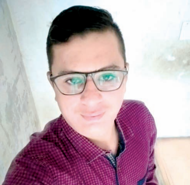
મારવાડી કોલેજના ડ્રાઈવરની જિંદગીની સફરનો હૃદયરોગના હુમલાને કારણે આપ્યો અંત

રાજકોટ, તા. ૯ ઘણીવાર એવી ઘટના બની જતી હોય છે કે તે જાણીને એમ બોલી જવાય કે જિંદગી તો બેવકા હૈ...આવી જ એક કરૂણ ઘટનામાં પરચીસ વર્ષના યુવાનનું હૃદય ધબકારા ચુકી જતાં મૃત્યુ થયું છે. કરૂણા એ છે કે હજુ તો પખવાડીયા પહેલા જ આ યુવાનની સગાઈ થઈ હતી. એક તરફ પરિવારજનોની ખુશી હજુ ખતમ થઈ નહોતી ત્યાં જ જની સગાઈ થઈ હતી એ જ ટિકરાના મરશીયા ગાવાની કપરી વેળા આવી ગઈ હતી. આ યુવાન સરકારી પ્રેસ પાસે આવેલી પ્રાદેશીક કમિશનર કચેરીમાં ફરજ બજાવતો હતો.