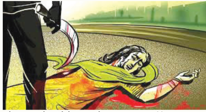
ગામે થયા હતા અને હાલ તેઓ પરિવાર સાથે મધ્યપ્રદેશના જંબુવા ખાતે રહેતા હતા. આ મામલે મળતાં પછી સીસીટીવી કેમેરા ચકાસવાનું શરૂ કર્યું હતું. જેમાં મધ્યપ્રદેશથી લઈને દાહોદ સુધીના ૧૦૦થી વધુ સીસીટીવી કેમેરાની તપાસ કરી

જેમાં મામીની ભાણેજે હત્યા કરી નાંખી છે. ગુજરાતમાં મારામારી, લૂંટ અને હત્યા સહિતના ગુનાહિત બનાવો સતત સામે આવી રહ્યા છે. ત્યાં હવે ચોકાવનારી ઘટના પ્રકાશમાં આવી છે. દાહોદ હાઇવે પર જૂની સેલટેશ નજીક એક અવાવરૂ જગ્યાએથી એક મહિલાનો મૃતદેહ મળી આવ્યો હતો. પોલીસે સીસીટીવી ફૂટેજના આધારે તપાસ હાથ ધરી હતી. જેમાં ખુલાસો થયો કે મહિલાનો હત્યારો બીજો કોઈ નહીં, પરંતુ તેનો જ ભાણેજ હતો. પોલીસની સુત્રોના જણાવ્યા અનુસાર, ઈન્દોર-દાહોદ હાઇવેની બાજુમાં આવેલી જૂની સેલટેશની અવાવરૂ ઓરડીમાંથી પ જૂને એક મહિલાનો મૃતદેહ મળી આવ્યો હતો.