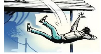
માહિતી અનુસાર લક્ષ્મીનગરમાં નાલા પાસે

રાજકોટ તા. ૧૦ જિંદગીની સફર ગમે ત્યારે પુરી થઈ જતી હોય છે. આવી જ એક ઘટનામાં કલર કામની મજૂરી કરવા ગયેલા યુવાનનું ટેબલ પરથી પડી જવાને કારણે મોત થતાં અરેરાટી વ્યાપી ગઈ હતી. પંચવટી રોડ પાર્લાકુટીર સોસાયટીમાં નવા બની રહેલા બંગલામાં કલર કામ કરતી વખતે મુજબ ઉત્તરપ્રદેશના યુવાન સાથે જીવલેણ દુર્ઘટના સર્જાઈ હતી.