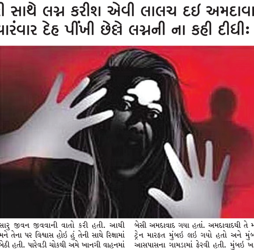
સારું જીવન જીવવાની વાતો કરી હતી. આથી મને તેના પર વિશ્વાસ હોઈ હું તેની સાથે રિશ્તામાં બેઠી હતી. પરિવેદી ચોકથી અમે ખાનગી વાહનમાં બેસી અમદાવાદ ગયા હતાં. અમદાવાદથી તે મને ટ્રેન મારફત મુંબઈ લઈ ગયો હતો અને મુંબઈ આસપાસના ગામડામાં ફેરવી હતી. મુંબઈ ખાતે

રાજકોટ, તા. ૧૧ દૂષ્કર્મની વધુ એક ચોકવાનારી અને ભાઈ-બહેનના સંબંધોને શર્મસાર કરતી ઘટના સામે આવી છે. જેમાં રાજકોટમાં રહેતી યુવતિને તેના જ સગા મોટા બાપુના દિકરાએ પ્રેમજાળમાં ફસાવી લગ્નના નામે અને સારી જિંદગી જીવવાના નામે તેણીને પોતાની સાથે અલગ અલગ ગામો શહેરોમાં લઈ જઈ વારંવાર શરીર સંબંધ બાંધી લઈ છેલ્લે હવે આપણા લગ્ન શક્ય નથી તેમ કહી તરછોડીને ભાગી જતાં યુવતિએ ફોન કરી ફરીથી લગ્નની વાત કરતાં મારી નાંખવાની ધમકી આપી દીધી હતી. અંતે યુવતિએ લવ સેક્સ અને ધોખા જેવી આ ઘટનામાં પોલીસની મદદ લીધી હતી. શહેરમાં ચક્રવાર જગાવતી અને ભાઈ-બહેનના સંબંધોને શર્મસાર કરતી ઘટના પર નજર કરીએ તો આ બનાવમાં પ્રધુમનનગર પોલીસે ભોગ બનનાર પરચીસ વર્ષની યુવતિની ફરિયાદ પરથી ભાવનગરના પંચકમાં રહેતાં તેણીના કોર્ટબીક મોડી વિરૂદ્ધ એફઆઈઆર દાખલ કરી છે. પોતાના જ કુટુંબી ભાઈની મોહજાળમાં ફસાઈ સર્વસ્વ ગુમાવી દેનારી યુવતિએ પોતાની