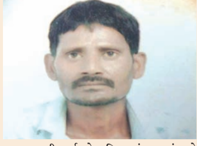
જ કમકમાટી ભર્યું મોત નિપજતાં ગામમાં અને

કમકમાટી ભર્યું મોત થયું હતું. વિગતો પર નજર કરીએ તો શહેરમાં અવાર-નવાર રખડતા પશુઓ રાહદારીઓ કે વાહનચાલકોને ઢીંક ચડાવી ઉલાળી દેતાં હોવાની ઘટના બને છે. વધુ એક વખત આવો બનાવ બન્યો છે. જેમાં નવાગામમાં રહેતાં આઘોડ ઘર નજીક કુવાડવા રોડ ઓડીના શો રૂમ પાસે ઝાડ નીચે બેઠા હતાં ત્યારે અચાનક બે ખૂંટીયા બાખડતાં બાખડતાં તેમની ઉપર આવી ગયા હતાં અને તેમને ખૂંટી નાખતાં ગંભીર ઈજા થતાં ઘટના સ્થળે