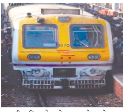
અપૂરતી સુવિધાઓ, સ્ટેશનના પ્રવેશદ્વારો પર સુરક્ષાનો અભાવ અને પાટા નજીક બેરિકેડિંગનો અભાવ એ કેટલાક પરિબળો છે જે સ્થાનિક ટ્રેન અકસ્માતો તરફ દોરી જાય છે

રાજકોટ, તા. ૧૧ મુંબઈની 'લાઈફલાઈન' કહેવાતી લોકલ ટ્રેનો હવે ડેથ ટ્રેક પર દોડી રહી છે. મુંબઈ સ્ટેશન પર અકસ્માત અંગે સવાલો ઉભા થઈ રહ્યાં છે. એક આરટીઆઈના સવાલ મુજબ, છેલ્લાં ત્રણ વર્ષમાં મુંબઈ લોકલમાં મુસાફરી કરી રહેલાં ૭,૫૬૦ મુસાફરોએ પોતાનો જીવ ગુમાવ્યો છે. જ્યારે ૭,૨૬૩ ગંભીર રીતે ઘાયલ થયાં છે. મુંબઈ રેલવે પોલીસ દ્વારા દાખલ કરવામાં આવેલી આરટીઆઈની પુછપરછમાં આ ખુલાસો થયો છે. સસ્તી, ઝડપી અને સુલભ સ્થાનિક મુસાફરી હવે જોખમી બની રહી છે. વધુ પડતી ભીડ, મર્યાદિત લોકલ ટ્રિસ,