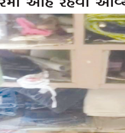
બજારમાં સાગર એન્ટરપ્રાઇઝ નામની સોની કામની દુકાન છે. મારા પતિ ગત ૭મી જુને કામ માટે બહારગામ