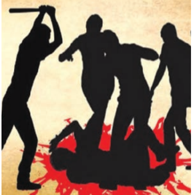
કરી કહ્યું હતું કે તારે જો એની સાથે કંઈ ન હોય તો તું તેના હાથે રાખડી બંધાવી લે. મેં આવું