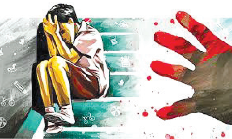
બીજા બનાવમાં પરણેલા શખ્સે કુંવારી યુવતિને લગ્નના નામે ફસાવી દેહ પીંખ્યો, પછી તરછોડી દીધી

બળાટકાર ગુજાર્યો હતો. પ્રથમ ચોંકાવનારી અને લાલબત્તી સમાન ઘટના જોઈએ તો બનાવ અમદાવાદના ખોખરાનો છે. ખોખરામાં રહેતા એક સગીરને છેલ્લા કેટલાય દિવસથી પેટમાં દુખાવાની તકલીફ હોઈ પરિવારે તેની દવા કરાવી હતી. જો કે તેમ છતાં તેની તબિયતમાં સુધારો થતો નહતો. દરમિયાન પરિવારે સગીરને વિશ્વાસમાં લઈને પૂછપરછ કરતા સગીર ભાંગી પડ્યો હતો અને કહ્યું હતું કે તેને પાડોશમાં રહેતો યુવક ઘાબા પર લઈ જઈ ધમકી આપીને સૃષ્ટિ વિરુદ્ધનું કૃત્ય આચરતો હતો. આ મામલે સગીરની માતાએ પરચીસ વર્ષીય પાડોશી યુવક સામે સૃષ્ટિ વિરુદ્ધનું કૃત્ય આચર્યાની ફરિયાદ નોંધાવી છે. ફરિયાદીને સંતાનમાં બે દિકરા છે. તેણીએ પોલીસ સ્ટેશનમાં ફરિયાદ નોંધાવી છે કે તેના એક સગીર દીકરાને થોડા દિવસો અગાઉ પેટમાં દુઃખાવો થયો હતો. નજીકમાં આવેલા ડોક્ટરની તથા મેડીકલ સ્ટોર પરથી દવા લઈને સારવાર કરાવી હતી. છતાં સગીર દીકરાની તબિયતમાં કોઈ સુધારો આવ્યો નહોતો. આ