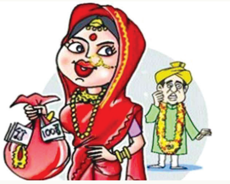
કેનેડાના વિજ્ઞાના નામે મામા-મામીનું ૨ કરોડ ૭૦ લાખનું કુલેક્ષ કરવાનો ભાણેજ ઝડપાયો