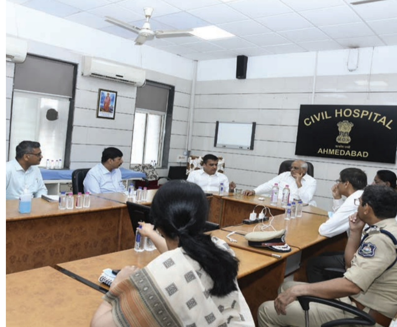
સ્વજનોને સાંત્વના પાઠવી હતી. મુખ્યમંત્રી ભૂપેન્દ્ર પટેલે DNA નમૂના મેપિંગની સમગ્ર પ્રક્રિયા અને તેની બારીકીઓથી માહિતગાર થયા હતા અને અધિકારીઓને ઇજાગ્રસ્તોને ઝડપી રાહત, સંપૂર્ણ તપાસ અને પીડિતો તથા તેમના પરિવારોને વ્યાપક સહાય સુનિશ્ચિત કરવા જરૂરી નિર્દેશો આપ્યા હતા. ત્યાર બાદ મુખ્યમંત્રીએ રાજ્યના મંત્રીઓ તથા ઉચ્ચ અધિકારીઓ સાથે બેઠક યોજી, રાહત-બચાવની સમગ્ર કામગીરીની સમીક્ષા કરી હતી. જ્યાં તેમણે તમામ ઇજાગ્રસ્તોને