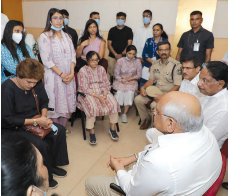
રાજકોટ, તા. ૧૬ મુખ્યમંત્રી ભૂપેન્દ્ર પટેલે ગઈકાલે અમદાવાદ સિવિલ હોસ્પિટલ ખાતે વિમાન દુર્ઘટનાના પીડિતોને મળી તેમના ખબરઅંતર પૂછ્યા હતા અને હતભાગીઓના ડીએનએ મેપિંગથી માંડીને તેમના નજર દેહ પરિજનોને સોંપવાની કામગીરી કરવામાં આવી રહી છે. દરમિયાન, મુખ્યમંત્રી ભૂપેન્દ્ર પટેલે અમદાવાદ સિવિલ હોસ્પિટલની મુલાકાત લીધી હતી. જ્યાં તેઓએ હોસ્પિટલના ઉર બ્લોક ખાતે કાર્યાલય કરાવેલા વેરિકેશન રૂમની મુલાકાત અને સૂચનાઓ આપ્યાં હતાં.

સ્વજનોને સાંત્વના પાઠવી હતી. મુખ્યમંત્રી ભૂપેન્દ્ર પટેલે DNA નમૂના મેપિંગની સમગ્ર પ્રક્રિયા અને તેની બારીકીઓથી માહિતગાર થયા હતા અને અધિકારીઓને ઇજાગ્રસ્તોને ઝડપી રાહત, સંપૂર્ણ તપાસ અને પીડિતો તથા તેમના પરિવારોને વ્યાપક સહાય સુનિશ્ચિત કરવા જરૂરી નિર્દેશો આપ્યા હતા. ત્યાર બાદ મુખ્યમંત્રીએ રાજ્યના મંત્રીઓ તથા ઉચ્ચ અધિકારીઓ સાથે બેઠક યોજી, રાહત-બચાવની સમગ્ર કામગીરીની સમીક્ષા કરી હતી. જ્યાં તેમણે તમામ ઇજાગ્રસ્તોને