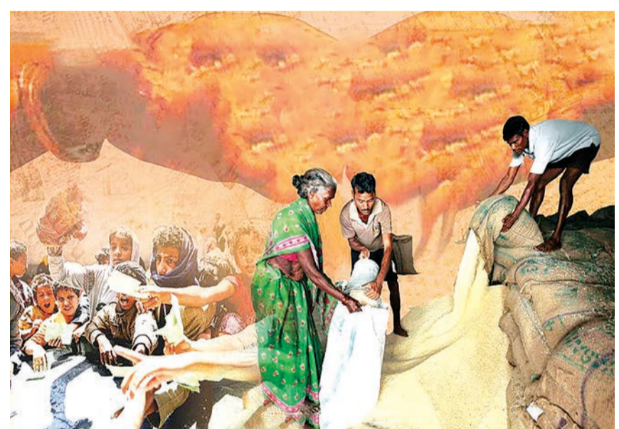
તેમને અનાજ ના બદલે નિરાશા મળશે છે. કારણ કે ગુજરાત સરકારના પુરવઠા વિભાગે મેં માસમા મેં તથા જૂનનુ વિતરણ તથા જૂન માસમાં જુલાઈ તથા ઓગસ્ટનુ વિતરણ કરવાનો પરિપત્ર કર્યો છે આમ આ ચાર માસનો જથ્થો જૂન અને જુલાઈ બે માસમાં આપવાનું નક્કી કર્યું છે. ગુજરાતના રેશનકાર્ડ ધારકોને વાજબી ભાવના દુકાનદારો જે તે મહિનો સિલેક્ટ કરીને ઉપરોક્ત પદ્ધતિ મુજબ અનાજ આપી શકે છે જ્યારે પરપ્રાંતિય રેશનકાર્ડ ધારકોને અનાજ આપવા માટે સોફ્ટવેરમા ઉપરોક્ત પદ્ધતિ લાગુ થતી નથી. ગુજરાત રાજ્યમા હાલમાં જૂન માસમાં જુલાઈ