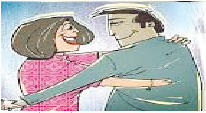
પતિ પણ ગાયબ હોવાની વાત સામે આવી હતી. પતિની કરતૂતોતો પત્નિએ જ ફોડી ઝઘડિયા પોલીસ મથકે અરજી આપી હતી. વિધવા મહિલા અને યુવકનું પ્રેમ પ્રકરણ ચર્ચાની એરણે ચઢ્યું હતું. વિવાદ વચ્ચે યુવકે દેવભૂમિ દ્વારકાથી એક એકીડીટ આવ્યું હતું. જેમાં મહિલાએ પોતે

જતાં અરજીને આધારે પોલીસે કાર્યવાહી કરી છે. અંકલેશ્વરનો પરણિત યુવાન ઝઘડિયાની વિધવા મહિલા સાથે ફરાર થઈ ગયો હોવાનો ચક્ર્યારી કિસ્સો સામે આવ્યો છે. બંને ઘણા સમયથી લાપતા હોવાથી આખરે ઝઘડિયા પોલીસ સ્ટેશનમાં અરજી આપવામાં આવી છે. દરમિયાન યુવાને દેવભૂમિ દ્વારકાથી મૈત્રીકરાર મોકલી કનડગત ન થાય તે જોવા માગણી કરી છે. આ યુવાને વિધવા સાથે મૈત્રીકરાર પણ કરી લીધા છે. વધુ માહિતી અનુસાર અંકલેશ્વર ખાતે રહેતો એક યુવક ઝઘડિયા જીઆઈડીસીમાં નોકરી કરતો હતો ત્યારે ઝઘડિયામાં નોકરી કરતી વિધવા મહિલાના સંપર્કમાં આવ્યો હતો જ્યાં બંને વચ્ચે પ્રેમ પાંગર્યું હતું. મહિલા અને યુવક સમાહ પૂર્વે ગાયબ થઈ ગયાં હતાં અને બંનેના ફોન પણ બંધ આવી રહ્યાં હતાં. મહિલાના પરિવારે શોધખોળ શરૂ કરતાં યુવકની પત્નિની પૂછપરછ કરતાં તેનો