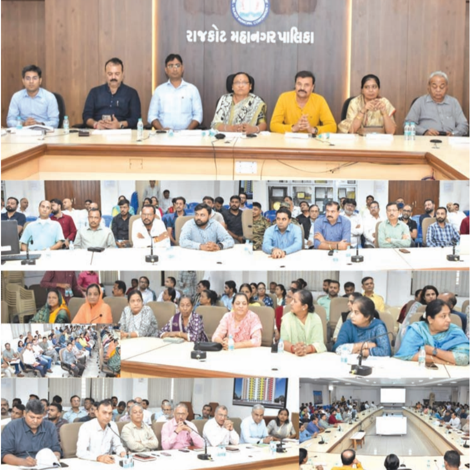
ટી.પી. પ્લોટ, નાના મૌવા સર્કલ પાસે, ૧૫૦ ફુટ રિંગ રોડ(૩) ઈસ્ટ ઝોન, સરદાર વલ્લભભાઈ પટેલ જીવન મંદિર પાસે, જવાહર શાળા ગ્રાઉન્ડ, સંત કબીર રોડ (૪) ખાસ કેટેગરીના વ્યક્તિઓમાટે મહાત્મા ગાંધી મ્યુઝિયમ કેમ્પસ, મહિલાસનાનાગર, સાધુવાસવાણી રોડ ખાતે યોગનું આયોજન કરવામાં આવેલ છે.