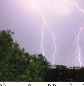
રીપેર કરવાની કામગીરી પૂરજોશમાં ચાલી રહી છે માત્ર કલેક્ટર કચેરી જ નહીં પરંતુ શહેરની અન્ય જગ્યાઓ પર હાલ ઘણી બરી ચીજ વસ્તુઓને નુકસાન પહોંચ્યું છે. રાજકોટ શહેરમાં સતત બે દિવસ પડેલા ભારે વરસાદના કારણે અનેક જગ્યાએ નુકસાનના સમાચાર સામે આવ્યા હતા ત્યારે શહેરની કલેક્ટર કચેરી ખાતે ભારે વરસાદના

રાજકોટ, તા. ૧૯ થોડા દિવસ પહેલાં ચોમાસાના આગમનની સાથે જ શહેરમાં કડાકા ભડાકા સાથે વીજળી થઈ હતી અને તેનાથી ઘણી બરી મિલકતોને પણ નુકસાન પહોંચ્યું હોવાના સમાચારો પ્રસિદ્ધ થયા હતા ત્યારે મળતી માહિતી મુજબ કલેક્ટર કચેરી ખાતે પણ વીજળીના કડાકાઓના પગલે કચેરીના ઘણા ભાગ ઉપકરણો બળી ગયા હોવાનું માલુમ પડ્યું એટલું જ નહીં શોર્ટ સર્કિટ થતા ટીવી સહિતના ઇલેક્ટ્રોનિક ઉપકરણો બળી ગયા હોવાનું પણ માલુમ પડ્યું છે. શનિવારે રજાનો દિવસ હોવાના કારણે કોઈ પણ વ્યક્તિ કચેરીમાં ન હતું અને સદનસીબે જાનહાનિ ટળી હતી. હાલ કલેક્ટર કચેરીમાં તાકીદે ઇલેક્ટ્રોનિક ઉપકરણો ને