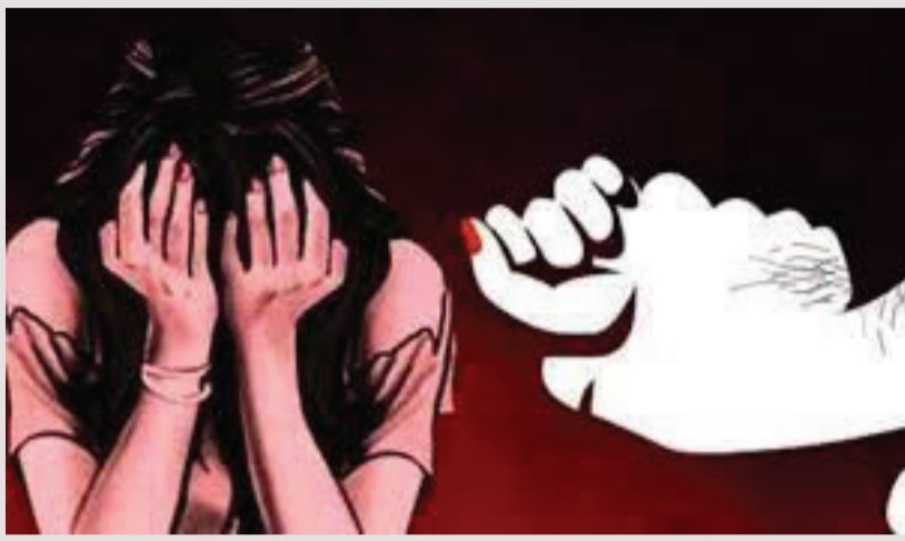
બીજી ઘટનામાં ભાઈ-બહેનના સંબંધ શર્મસાર થયા: તેર વર્ષની બાળા સાથે ત્રીસ વર્ષના માસીયાઈ ભાઈનો બળાત્કાર