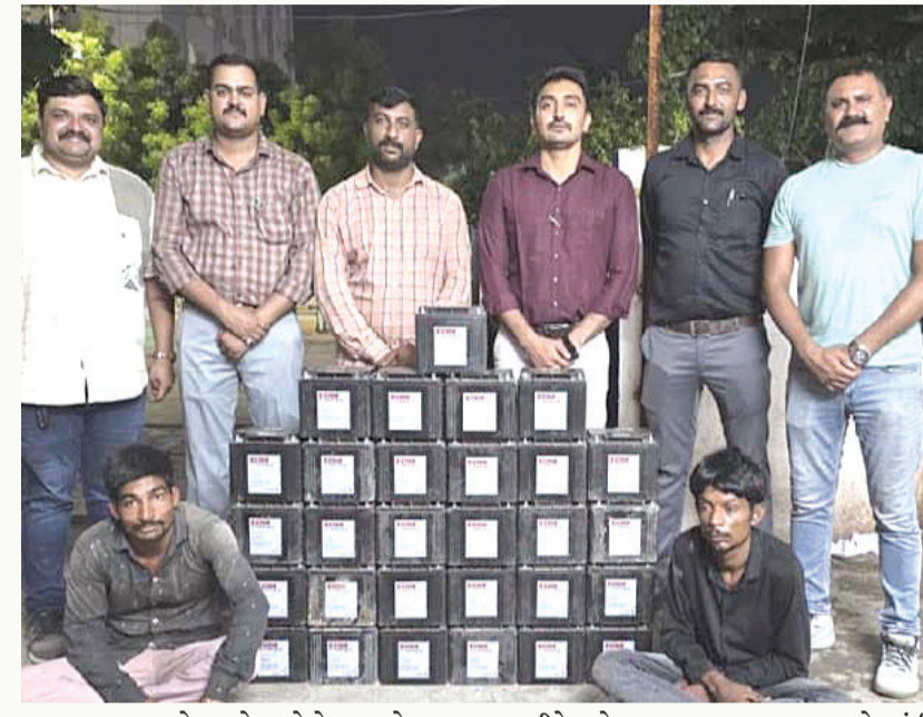
કબજામાં મળેલી બેટરીઓ અને રિક્ષા. ટીમે આ બેટરીઓ ચોરાઈ ગઈ હતી. આ ગુનાની તપાસ એ-ડિવીઝન પોલીસમાં કરવામાં આવી હતી.

ડિટેક્શનની વિગતો પર નજર કરીએ તો શહેરમાં મ્યુનિસિપલ કોર્પોરેશન દ્વારા અલગ અલગ રસ્તાઓ પર ફીટ કરાયેલા સીસીટીવી કેમેરાના આઉટડોર યુનિટમાંથી છેલ્લા દોઢ મહિનાથી બેટરીઓ ચોરાઈ જવાની ઘટના બની રહી હતી. અલગ અલગ ૧૫ જેટલા યુનિટમાંથી ૪૫ જેટલી બેટરીઓ ચોરાઈ ગઈ હતી. આ ચોરીઓનો ભેદ નાસતા ફરતા સ્કવોડ ઝોન-૨ની ટીમે ઉડેલી એક સગીર સહિતની ત્રિપુટીને ઝડપી લઈ બેટરીઓ, રિક્ષા, નાનુ કટર કબ્જે કર્યાં છે. ત્રણેય રિક્ષા લઈ બેટરીની ચોરી કરવા નીકળતાં હતાં. ચોરેલી પૈકી અમુક બેટરીઓ ભંગારમાં વેચી નાંખી હતી. પોલીસે ૨૯ બેટરીઓ કબ્જે કરી વિશેષ કાર્યવાહી હાથ ધરી હતી. વધુ વિગતો અનુસાર શહેરના અલગ અલગ વિસ્તારોમાં મહાનગર પાલિકા દ્વારા સીસીટીવી કેમેરા ફીટ કરાવવામાં આવ્યા છે. જેના આઉટડોર યુનિટમાંથી છેલ્લા કેટલાક સમયથી બેટરીઓ ચોરી જવાની ઘટનાઓ બની રહી હતી.