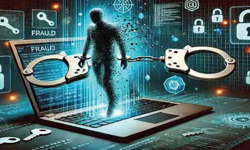
બીજી ઘટનામાં આંગણીયા પેઢીમાં દસકાથી નોકરી કરતો મેનેજર પચ્ચીસ લાખ ઉંડેડી છૂ થઈ ગયો

પાર્સલ ફેડેક્સ કુરિયર મારફતે મુંબઈથી ઈરાન જઈ રહ્યું છે, જેમાં તમારા આધારકાર્ડ તથા મોબાઈલનો ઉપયોગ થયો છે. આ પાર્સલમાં દવાઓ અને ટ્રાણસો ગ્રામ એમડી ડ્રગ્સ છે. મહિલાએ પાર્સલ તેનું ન હોવાનું જણાવ્યું છતાં મુંબઈ પોલીસમાં ફરિયાદ જનરેટ કરેલ છે. એમ કહી નોંધ કરવા જણાવ્યું હતું. ત્યારબાદ પોતાનું નામ શિવમ જણાવવારે મુંબઈ કાર્ડમબ્રાંચમાં કોલ કરેવડ કરે છે તેમ કહી ફોન અચને આવ્યો હતો. આ શખ્સે પોતે મુંબઈ પોલીસના પ્રદીપ સાવંત વાત કરે છે, એમ કહી મહિલાની પૂછપરછ કરી હતી. મહિલાએ નકલી પોલીસે કહ્યું કે તમારા આધારકાર્ડ અને મોબાઈલ નંબરનો ઉપયોગ અન્ય વ્યક્તિને ફોડમાં કરેલ છે. આ બાબતે તપાસ કરી તમારી ફરિયાદ લેવી પડશે, પછી મહિલા પાસે મોબાઈલમાં સ્ક્રીનપની ઓનલાઈન એપ્લીકેશન ડાઉનલોડ કરાવી હતી. એપ્લીકેશનમાં લોગઈન કરાવી ફોડ વેબસાઈટના માટે વિડીયો કોલથી વાતચીત કરી આધારકાર્ડ, બેંક ખાતા સહિતની વિગતો માંગી હતી. મહિલાને મુંબઈ પોલીસનો લેટર મોકલ્યો હતો. પછી મની લોન્ડરિંગ કેસમાં સંડોવાયેલા ફોટો મોકલ્યા હતા. ઠગએ મહિલા પાસે પહેલા એક લાખની રકમ ટ્રાન્સફર કરવાની વાત કરી હતી. જો કે મહિલાના ખાતામાં બે હજાર હતા.