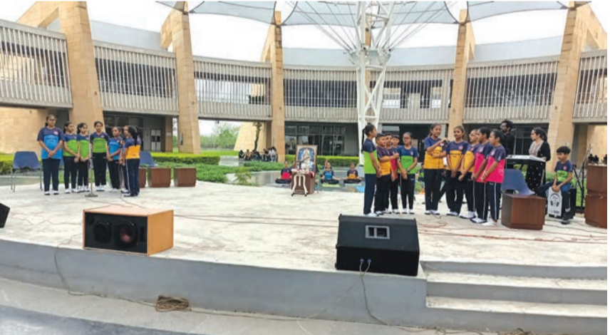
પણ ઉજવણી કરવામાં આવી, આ ઉજવણીમાં વિવિધ સંગીત એકેડમી, શાળાઓ, ઓરેકેસ્ટ્રા, તેમજ સામાન્ય જનતાએ ભાગ લીધો હતો. આ કાર્યક્રમની શરૂઆતમાં જે અધરવેણુ એજ્યુકેશન એન્ડ ચેરિટેબલ ટ્રસ્ટના વાંસળીવાદકો, ગિટારવાદકો, અને કીબોર્ડ વાદકો, એ ગુપ પરફોર્મન્સ આપી સુમધુર સૂરથી

સંગીત સંઘ્યાની શરૂઆત કરી હતી, ત્યારબાદ વેસ્ટવૂડ સ્કૂલના ૩૦ જેટલા વિદ્યાર્થીઓએ ગયાં અને વાદન સાથે પરફોર્મન્સ આપી લોકોને મંત્રમુગ્ધ કર્યા હતા. આ કાર્યક્રમમાં ૭૨ જેટલા કલાકારોએ ભાગ લીધો હતો અને સોલો, ડ્યુએટ અને ગ્રુપમાં ગાયન અને વાદન કલાઓ પ્રસ્તુત કરી હતી. આ કાર્યક્રમમાં ૭ ગ્રુપ દ્વારા વિવિધ સંગીત વાદ્યો જેવા કે ફ્લૂટ, તબલા, ગિટાર, કીબોર્ડ વગાડી કલા બતાવી, ૧૮ જેટલા ભાગ લેનાર કલાકાર વૃંદમાં રાજકોટની વેસ્ટવૂડ સ્કૂલની ઓરેકેસ્ટ્રા તથા આપવામાં આવ્યું, સંગીત પ્રેમીઓએ કારાઓકે સાથે ગાયનો પ્રસ્તુત કર્યા. વેસ્ટવૂડ સ્કૂલના બાળ કલાકારોએ ગાયન, વાદન અને સાથો સાથ યોગાસનો રજૂ કર્યા હતા. સહજાનંદ સ્કૂલના સારંગ સંગીત કલવુંદના બાળકલાકારો દ્વારા કૃતિ રજૂ કરવામાં આવેલ હતી. આ ઉપરાંત એચ. જી. ગિટાર એકેડમીના વિદ્યાર્થી ઓ અને અધરવેણુ એજ્યુકેશન એન્ડ ચેરિટેબલ ટ્રસ્ટ, રાજકોટના કલાકારોએ વિવિધ વાજિત્રવાદન રજૂ કરેલ હતું.