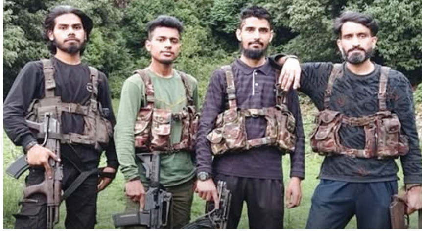
કરવામાં આવી છે.