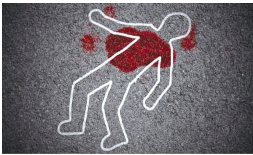
હત્યાની અન્ય એક ભેદી ઘટના: યુવાનને ગળું દાબી મોતને ઘાટ ઉતારાયો: રહસ્ય ઉકેલવા પોલીસ ઊંઘામાથે