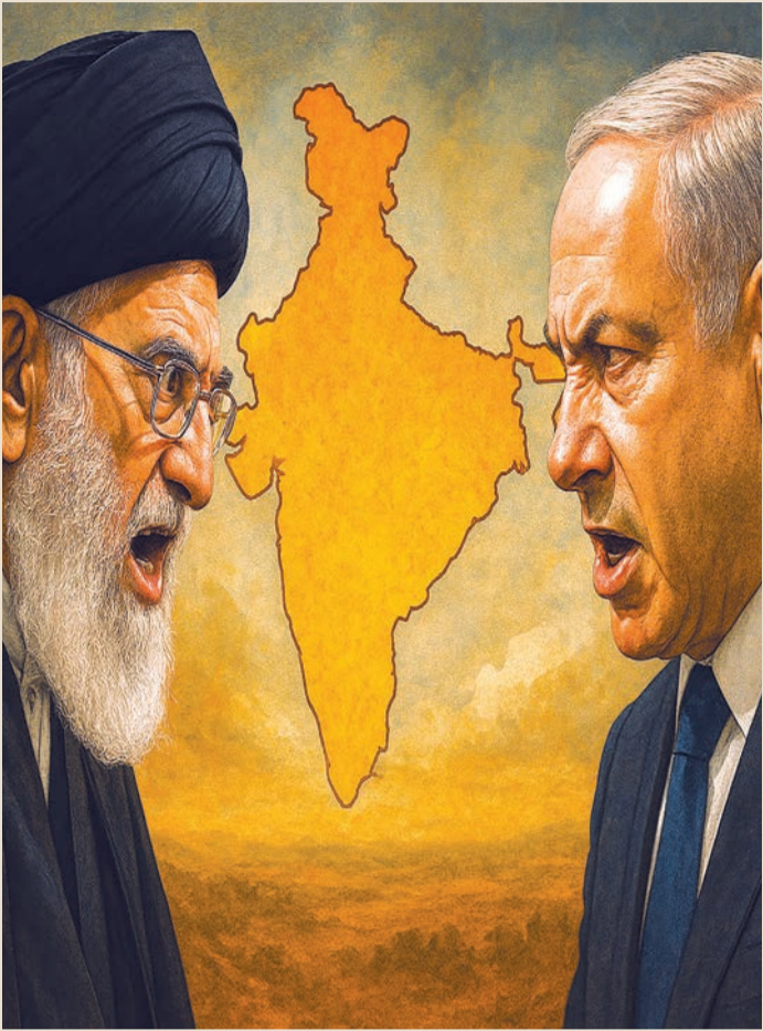
નવીદિલ્હી, તા. ૨૨

ભારત સરકાર દરરોજ બેઠકો કરી રહી છે અને આકસ્મિક યોજનાઓ બનાવી રહી છે : ભારતની લગભગ ૪૦% ફૂડ ઓઈલ આયાત અને ૫૪% લિક્વિડાઈડ નેચરલ ગેસ પુરવઠો હોર્મુઝ સ્ટ્રેટમાંથી પસાર થાય છે