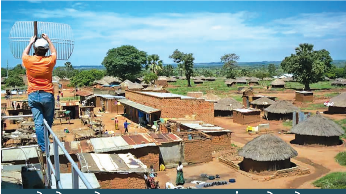
ભારતનેટ કેઝ-૩ હેઠળ કુલ ૧૪,૨૮૭ ગ્રામ પંચાયતો અને ૩,૮૯૫ ગામોને આધુનિક ડિજિટલ કનેક્ટિવિટી ઈન્ફ્રાસ્ટ્રક્ચર સાથે જોડાશે

મોરબી રોડ પર બાંધકામની સાઈટ પર કચ્છા બનાવ: મજૂર દંપતિએ લાડકવાળી ગુમાવતાં શોકની કાલીમા