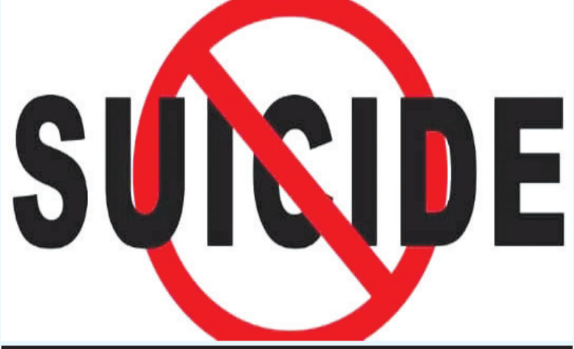
આર્થિક ભીંસને કારણે રત્નકલાકારે ટુંકાવી લીધી જિંદગી