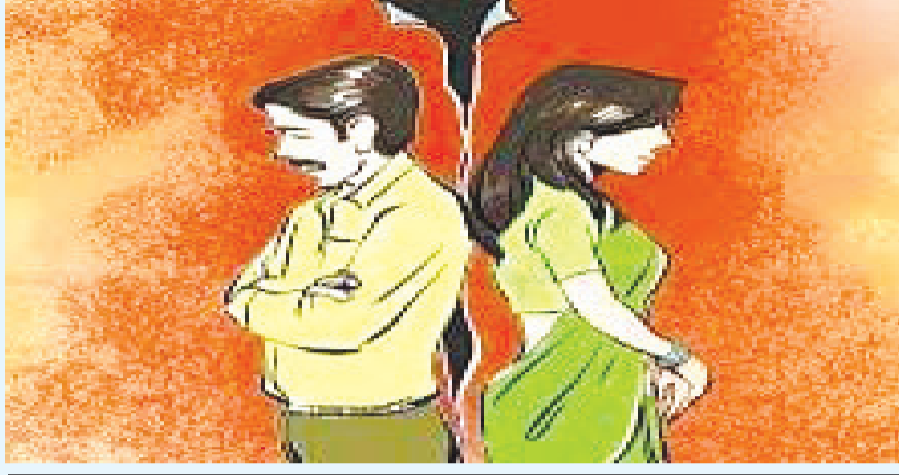
આવ-જા કરતી વખતે પત્નિને રિક્ષાચાલક સાથે પ્રેમ થઈ ગયો પતિએ ઠપકો દેતાં બેફામ ફટકારી ઈંટથી માર મારી લોહીલુહાણ કર્યો!