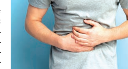
શક ખાધા બાદ તબિયત બગડી હોવાનું જણાવાયું હતું. તબિબે પોલીસ કેસ જાહેર કરતાં થોરાળા પોલીસે કાર્યવાહી