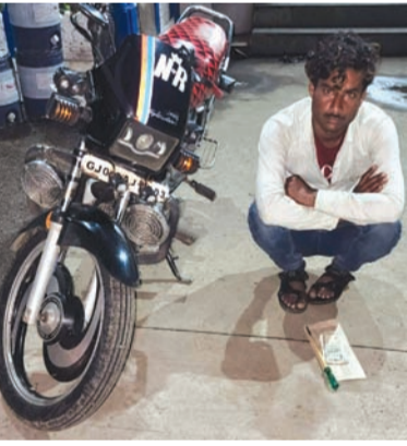
પાસે મોટરસાયકલની શંકાસ્પદ અવરજવર થઈ રહી છે. જેથી આ બાતમીના આધારે