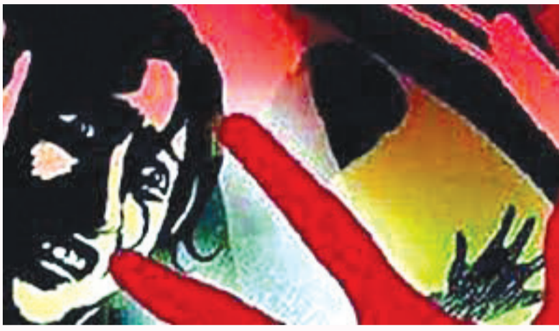
બીજી ઘટનામાં છ વર્ષની બાળા સાથે બે સંતાનના બાપે કર્યા બિભત્સ યાળા: પોલીસે કર્યો ખોખરો