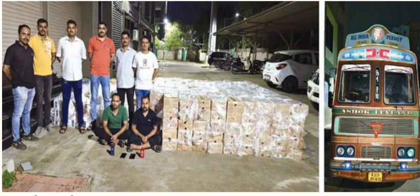
બાતમીને આધારે ટીમ કુવાડવા નજીક કિષ્ના વોટર પાર્ક પાસે પહોંચી ત્યારે બાતમી મુજબનો ટ્રક આવતાં તેને અટકાવી તલાસી લેતાં પાછળ વેસ્ટેજ ટાયરનો જથ્થો જોવા મળ્યો હતો. ટ્રકમાં દારૂ હોવાની બાતમી હોઈ કાઈમ બ્રાંચની ટીમે ટાયરોનો જથ્થો દૂર કરતાં જ