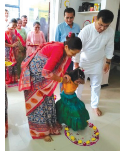
રાજકોટ, તા. ૨

શિક્ષણની યાત્રામાં પગરવ માંડતા ભુલકાઓને સ્નેહભર પ્રવેશ આપવાનો પ્રસંગ એટલે આંગણવાડી પ્રવેશોત્સવ, તારીખ: ૨૬ થી ૨૮ જૂન ૨૦૨૫ દરમિયાન રાજકોટ મહાનગરપાલિકાની આંગણવાડી ખાતે ત્રિ-દિવસીય પ્રવેશોત્સવની ઉજવણી કરવામાં આવી. શિક્ષિત ગુજરાત, વિકસિત ગુજરાત થીમ આધારીત પ્રવેશોત્સવ-૨૦૨૫ની ઉજવણીમાં રાજકોટ મહાનગરપાલિકાની તમામ LED સ્ક્રીન તથા આંગણવાડી ખાતે રેલી, સ્લોગન દ્વારા પ્રવેશોત્સવનો પ્રચાર-પ્રસાર કરવામાં આવ્યો. રીક્ષા, ગાડી જેવા વાહનો શણગારી બાળકોને ઉત્સાહપુર્વક આંગણવાડીમાં પ્રવેશ આપવામાં આવેલો. કુ મકુ મ, રાજકોટ મહાનગરપાલિકામાં આંગણવાડી