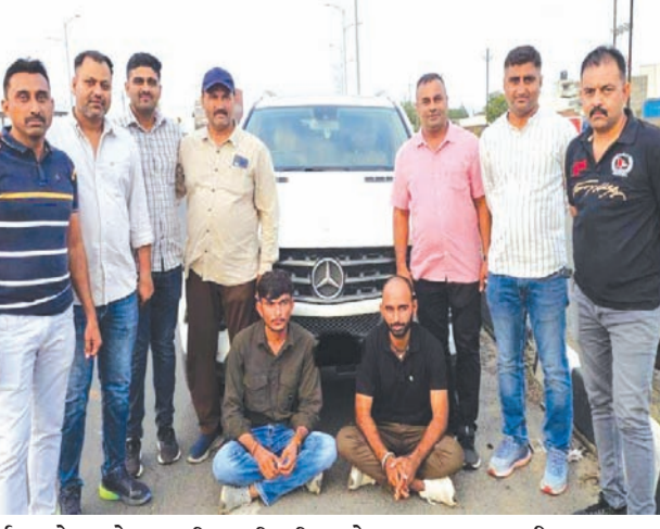
પાર્ક સામેના રોડ પરથી પકડી લીધા છે. આ બંનેને ડુંગરપુર પાસેથી દાડનો જથ્થો ભરેલી કાર અપવામાં આવી હતી. રાજકોટ પહોંચતા સુધીમાં ફોન આવે તેને આપવાની હતી. જો કે એ પહેલા કાઈમ બ્રાંચે પકડી લઈ દાડ,

રાજકોટ તા. ૨ શહેરમાં દાડની હેરાફેરીને ડામવા પોલીસ સતત કાર્યરત છે. છેલ્લા અઠવાડિયાથી જે રીતે ઘોંસ બોલાવાઈ રહી છે તે જોતાં બૂટલેગરો, સપ્લાયરોની કમ્મર તૂટી ગઈ છે. વધુ એક વખત કાઈમ બ્રાંચે સફળ કામગીરી કરી છે. રાજસ્થાનથી રાજકોટ આવી રહેલી બાર લાખની સ્કોચ-બ્લીસકોની બોટલો ભરેલી કારને કુવાડવા નજીકથી ઝડપી લઈ બે રાજસ્થાની શખ્સને પકડી લીધા છે. આ બંને રાજકોટ પહોંચ્યા પછી ફોન આવે તેને આ કાર સોંપવાના હતાં. પરંતુ એ પહેલા પોલીસની ટીમ પહોંચી ગઈ હતી. પોલીસે માલ મોકલનારા અને મંગાવનારા અંગે તપાસ હાથ ધરી છે. માહિતી પર નજર કરીએ તો વધુ એક વખત કાઈમ બ્રાંચે દાડની હેરાફેરીને નાકામ બનાવવામાં ચોક્કસ પોલીસ મળતાં તેને સફળ બનાવાઈ હતી. પોલીસે રૂપિયા ૧૧,૮૬,૫૬૦નો ૩૮૪ બોટલ દાડ ભરેલી મર્સીડીઝ કાર સાથે બે રાજસ્થાની શખ્સને રાજકોટ અમદાવાદ હાઈવે પર કિષ્ના વોટર