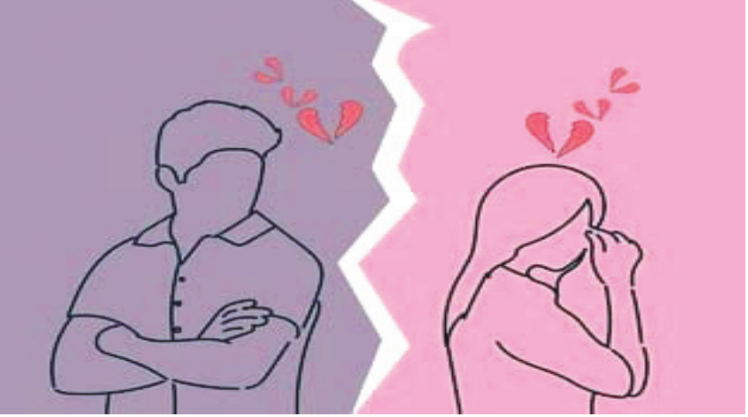
બીજી ઘટનામાં મનમેળ ન થતાં પત્નિ માવતરે જતા પતિએ બીજીને ઘરમાં બેસાડી લીધી : બંને વિરુદ્ધ દાખલ કરાવી પરિણીતાએ એફઆઈઆર

આવતી રહે છે. દરમિયાન વધુ બે એવા બનાવ સામે આવ્યો છે. જેમાં ફરી એક વખત ઘણી ઘોખેબાજી બન્યા છે. નારોલમાં રહેતી મહિલાને પડોશી સાથે પ્રેમલગ્ન કરવાનું ભારે પડ્યું હોવાનો કિસ્સો પ્રકાશમાં આવ્યો છે. લગ્નના બીજા દિવસથી પિયરમાં જવા દેતા ન હતા. એટલું જ નહીં પત્નિના નામે પાંચ લાખની લોન લઈને પતિ કાર લાવ્યો હતો છ મહિનામાં ઘરેથી કાઢી મુકી હતી. નારોલ પોલીસે પતિ સહિત ત્રણ લોકો સામે ગુનો નોંધી વધુ તપાસ હાથ ધરી છે. લાંબા કેનાલ પાસે રહેતી મહિલાએ નારોલ પોલીસ સ્ટેશનમાં નારોલમાં રહેતા પતિ સહિત સાસરીના ત્રણ લોકો સામે ફરિયાદ નોંધાવી છે કે ત્રણ વર્ષ પહેલા મહિલાએ પડોશમાં રહેતા યુવક સાથે પરિવારની સહમતીથી પ્રેમલગ્ન કર્યા હતા. જો કે લગ્નના બીજા દિવસથી પિયરમાં જવા દેતા ન હતા અને રૂપિયાની માંગણી કરીને માનસિક ત્રાસ આપતા હતા. મહિલાના